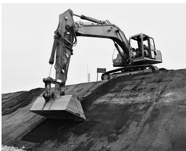
マシンガイダンスによる法面の整形

団長訓話においては、第1施設団がいかなる状況においても、あらゆる任務に即動・持続・完遂できる「強靱な施設団」を創造するため、引き続き及び人材育成の重要性について再度強調した。特に人材育成については、サービスと一体となった各級指揮官による感化・善導により帰属意識を高めるとともに、第1施設団生え抜きの各種要員を継続的に育成する必要があると、各級指揮官は基本教育と職務を通じた実践教育（とうや）を連携させ、自ら人材育成に取り