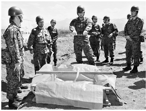
民生品（D・Box）を実視する総監（中央）