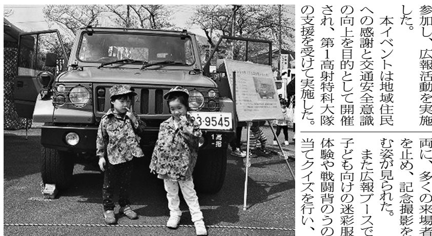
迷彩服を試着して記念撮影

自衛隊神奈川地方協力本部小田原地域事務所は4月12日、小田原ドライブインスクールで開催された「第11回感謝祭」に参加し、広報活動を実施した。 会場では1/2トトラックを展示し、車両の特徴や任務内容を分かりやすく説明した。普段目にする機会が少ない自衛隊車両に、多くの来場者が足を止め、記念撮影を楽しみ姿が見られた。