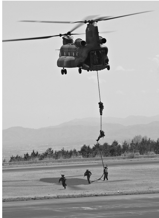
旅団ならではの迫力ある訓練展示