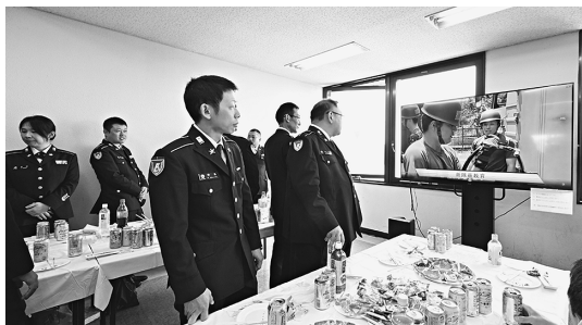
東部方面システム通信群は4月18日、朝霞駐屯地において群創隊43周年記念会食をシステム通信群OB会と共催で開催した。

本会食は「談結（だんけつ）（造語）（関連企業・団体、群OB会、システム通信群がくつろいで話し、協力関係及び結束の基盤を構築する）」をテーマとして、朝霞駐屯地の隊員のほか、東管内に分散している3個中隊、31個派遣隊が「中隊長・派遣隊長挨拶映像」で会場に登場し、群の一体感を醸成した。また令和7年度に、部内外で活躍した隊員を紹介する「令和7年度活躍隊員紹介」のほか、「令和7年度群活動状況」のダイジェスト映像を放映し、不撓不屈の精神を継承している隊員の姿を紹介した。現役世代の活躍状況をOBらと共有し、当時の苦労話や「変わらない志」を語るほか、我々を取り巻く環境の変化や最新のデジタル技術について、自衛隊とOB、企業の垣根を越えて語り合い、時代が変わっても変わらない国防の精神を継承していることを称え合った。 群は感謝の気持ちを忘れず、諸先輩が築いてきた伝統を継承するとともに、変化に適応し任務を完遂するため、引き続き任務に邁進していく。