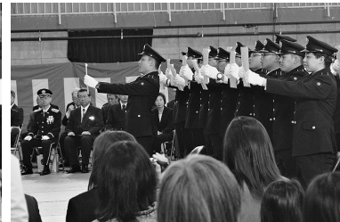
松本駐屯地 (第13普通科連隊)