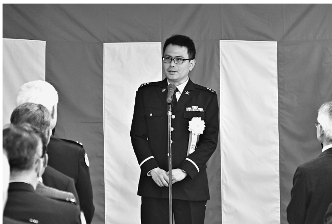
東部方面システム通信群長の挨拶