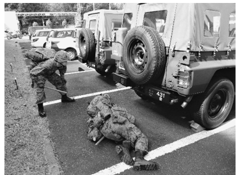
駐屯地警備（立川会計隊）