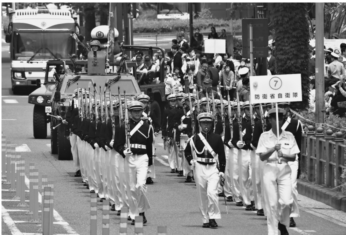
防大儀仗隊に先導される31普連隊長とはまにゃん

同パレードは昭和28年 から続く伝統的なイベン トでよこはま地域の活 性を目的に行われてい る。 防衛省自衛隊としての パレード行進は、防衛大 学校儀仗隊及びドラム隊 の軽快なドラムマーチと 洗礼されたドリル行進に より先導され、第31普通 科連隊長が自ら軽装甲機 動車から観客に手を振り 声をかけるなど、「海」の アピールを存分に行っ た。