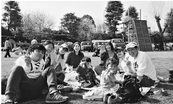
家族でお花見を楽しむ

練馬駐屯地は3月28日「さくらまつり」を開催し、約5300人の来場者で賑わった。 本行事は駐屯地の一般開放を通じて来場者にお花見の機会を提供するとともに、地域住民や協力会等との交流を深め、自衛隊に対する理解と信頼の獲得・拡大を図ることを目的として実施した。 当日は駐屯地内の桜も満開となり、来場者は思い思いにお花見を楽しんだ。 会場には複数の出店があり、飲食や買い物を楽しむ家族連れなどで終日にぎわいを見せた。満開の桜並木の下では、来場者同士の談笑や記念撮影の様子が見られ「普段入ることのできない駐屯地でお花見をすることができて良かった」といった声も聞き、和やかな雰囲気に包まれた。 また隊員による案内や来場者との触れ合いを通