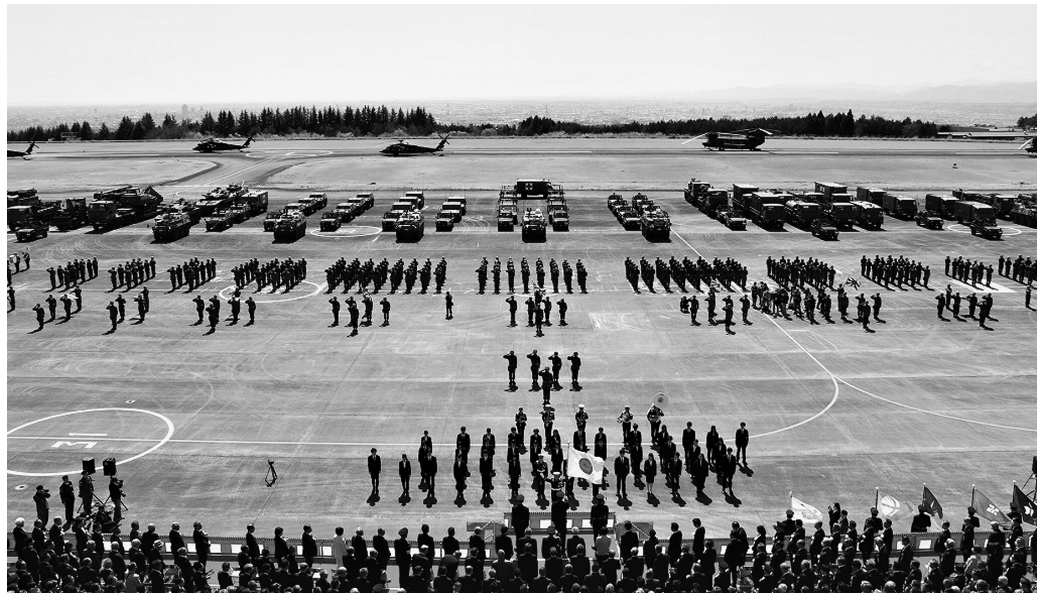
観閲式に整然と臨む隷下部隊と駐屯地所在部隊

旅団は4月11日、相馬原駐屯地及び相馬原飛行場において、第12旅団創立25周年及び相馬原駐屯地創設67周年記念行事を挙行した。