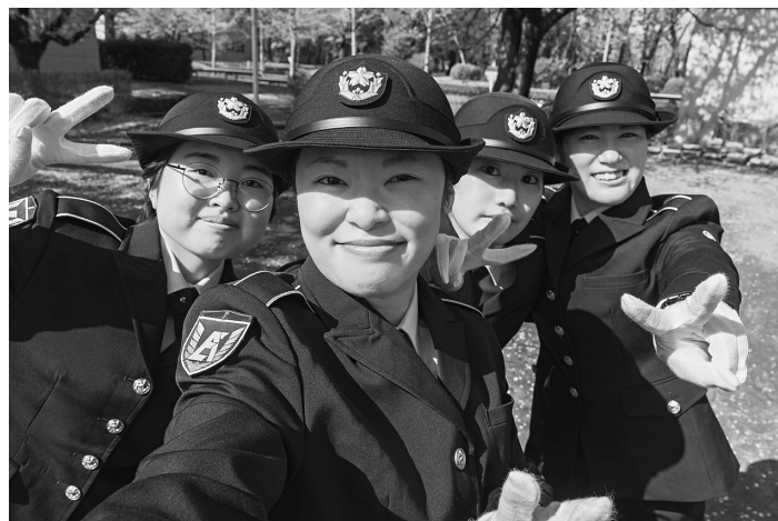
晴れ姿と満面の笑みで記念撮影を行う新隊員

女教隊では春の訪れを 感じさせる晴天の下、式 に臨む新隊員は同期や班 長達との記念撮影、服装 の点検などを行いつなが 緊張をほぐしている様子 が見受けられた。 入隊式が終わると、家族 との懇談の時間では安堵 して涙を流す隊員や家族 とのしばしの別れを惜し む隊員の姿がみられ、思 い思いの時間を家族と過 ごしていた。娘の制服姿 をみた家族は「こんなに も凛と立派になって、親 としての不安な気持ちか 吹き飛びました。同期の