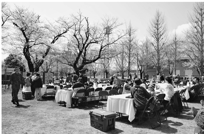
桜に囲まれた会食会場