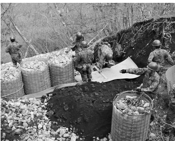
民生品を活用した崩落箇所の改修