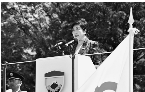
祝辞を述べる小池東京都知事

式典は多くの来場者が見守る中、陸上自衛隊の中でも高い格式を誇る1師団ならではの厳肅な行進儀しよつて幕を開けた。