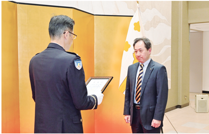
委嘱状を授与されるオピニオンリーダー