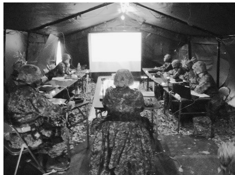
作戦会議（隊本部野外指揮所）