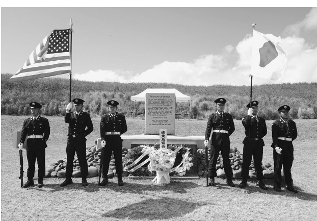
硫黄島で日米両国旗を奉持する旗衛隊

れている意義に触れ、恒久平和の実現に向けて歩みを進めて行く姿勢を示した。(要旨) 参加者は静粛な雰囲気での祈りを捧げ、戦没者への敬意と平和への決意を新たにされた。 式典を通じ、日米両国の相互理解と信頼の深化が示されるとともに、その歩みを次世代へ継承していく必要性が感じられる機会となった。