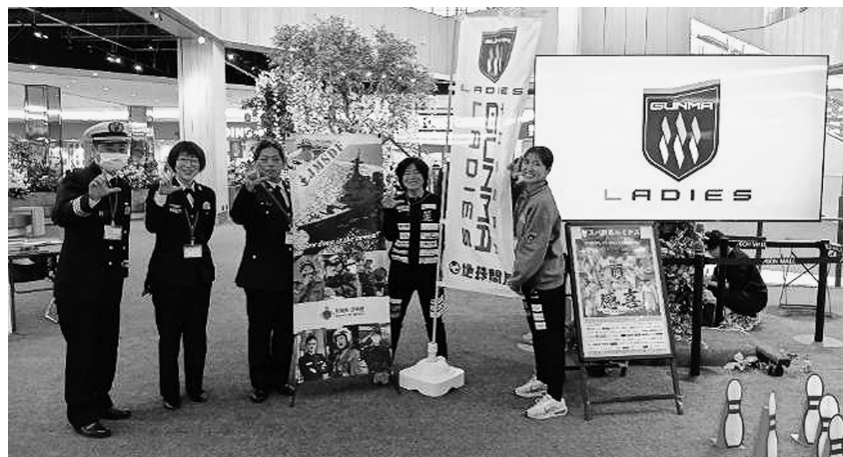
ルミナス選手とコラボイベントの盛況を祝して記念撮影

自衛隊群馬地方協力本部太田出張所は4月4日、イオンモール太田において開催された「ササパ群馬ルミナスエンジョイホ