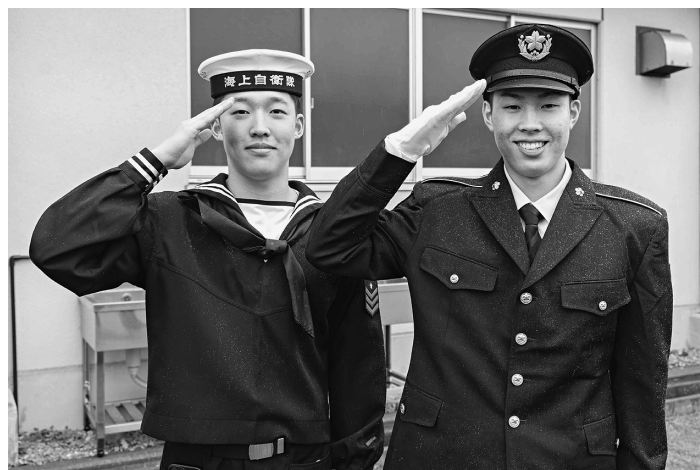
海上自衛隊の兄と陸上自衛隊に入隊した新隊員

音楽隊の演奏に合わせ て新隊員の入場が始まる と式に参列した家族は我 が子の晴れ姿を記録する 為、一斉に写真や映像を 撮りはじめることも、 その堂々とした姿と統制 された行動の迫力に会場 からは驚きの声も漏れて いた。 新隊員は同期の絆を強 固にしなが、約3ヶ月 にわたる教育により、自 衛官としての基礎を学ん でいく。