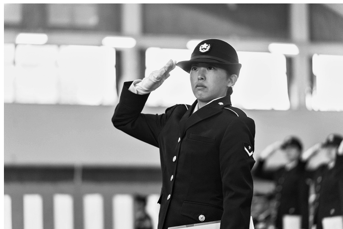
凛とした姿で敬礼を行う新隊員

地においてそれぞれ第26 期一般陸曹候補生及び第 30期自衛官候補生の入隊 式を挙行政した。