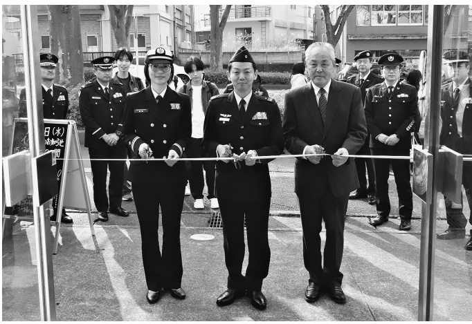
関係者に見守られる中行われたテープカット

自衛隊茨城地方協力本部日立出張所は3月17日、出張所が入るビルの一階部分の広報紙をラリースペースとしてリニューアルオープンし、オープニングセレモニーを実施した。 当日は自衛隊茨城地方協力本部長をはじめ関係者が多数出席し、施設の利用が促進されることを期待された。