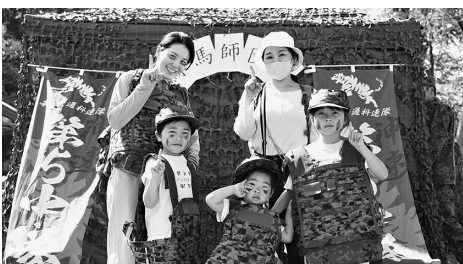
自衛隊体験を楽しむ来場者

部隊の威容が整然と示される中、師団長は式辞において「精強な師団として存在することが我々の果たすべき役割である。自分の国は自分で守るとの認識の下、隊員諸官には、平素より厳しい訓練に裏付けされた高い練度を保持し、土気旺盛にして団結強固な精強部隊の育成に努力していただきたい。国民の安らかな生活を守り抜くため、私も皆の先頭に立ち、率先垂範、統率していく」と述べ、来場者の視線が一斉に注がれた。