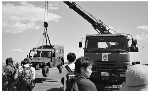
重レッカー車による車両回収の展示

動などを実際に行う動的展示を初めて実施し、日常から縁遠い防衛装備品の性能や隊員の慣れた操作に関心が寄せられた。募集に焦点を当てた企画では大学生サークルと共演した大学生サークルのダンスパフォーマンスや高校生などの募集対象者に向けた企画では、駐屯地見学のツアーを実施し、参加者からは「より身近に感じられた」と好評を得た。