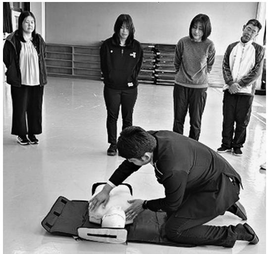
心肺蘇生法の展示を熱心に学ぶ教職員

自衛隊栃木地方協力本部大田原募集案内所は4月3日、那須塩原市立日新中学校において防災教育を実施した。 当日は教職員を対象に、心肺蘇生法やAEDの使用法について実技指導を実施した。 通学路や校舎内等で倒れている人を発見したという想定で行った訓練では、胸骨圧迫心臓マッサージや声掛け、救急者の依頼、AEDの装着といった役割分担など一連の流れを確認しながら、実践的に学んだ。