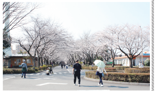
駐屯地に咲く2000本の桜

訪れた人は「多くの人が訪れ、キッチンカーもたくさんあって大盛況ですね。駐屯地が日頃から地元の方々に愛されている証拠ですね」と笑顔で感想を話した。今回新たに始めた装備品展示では、桜並木のアーチを形作る中央道に展示エリアを設け、オートバイ（偵察用）・軽装甲機動車・16式機動戦闘車を並べて隊員による丁寧な説明を行い来場者の注目を集めた。また、これらの装備品と桜との組み合わせは鮮やかなコントラストで写真撮影の人だかりを作るとともに、子供連れの家族がオートバイに子供を乗せて撮影に興じるなど賑わいを見せていた。陸上自衛隊広報センター「のつくしランド」及び「振武喜記念館」も通常運営していたことから、足を向ける来場者も多く、見どころ豊富な春のイベントとして来場者に思い出される春のひとつを提供することができた。