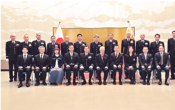
委嘱式終了後の記念撮影

方面隊は4月9日、朝霞駐屯地において令和8年度から東部方面隊オピニオンリーダーとして活動する方に対し、新規委嘱状交付式を実施した。東部方面音楽隊による歓迎の演奏後、厳粛な雰囲気の中行われた式では、推薦広報実施担当官等が陪列する中、参加者は総監から一人一人委嘱状を受け取った。交付後、総監はオピニオンリーダーに対し我々自衛隊のことを知っている