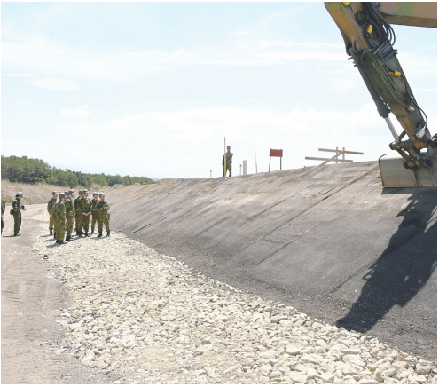
法面の整備状況を確認

団は整備にあたり民生品やICT（情報技術）を活用して効率化・省人化を図るとともに、空自中部航空方面隊との技術交流状況を説明し、総監から賞賛と激励を受けた。また総監は整備部隊を支える整備・補給支援部隊の支援状況を確認し、隊員士気を向上させ、視察を終了した。