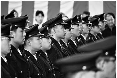
新発田駐屯地 (第30普通科連隊)

旅団隷下部隊は各駐屯地で新隊員教育隊を編成し、3月下旬から自衛官候補生を受け入れた。着隊当初は緊張の面持ちであった候補生も数日のうちにたくましい顔つきに成長し、前途有望な127人が入隊式に臨んだ。