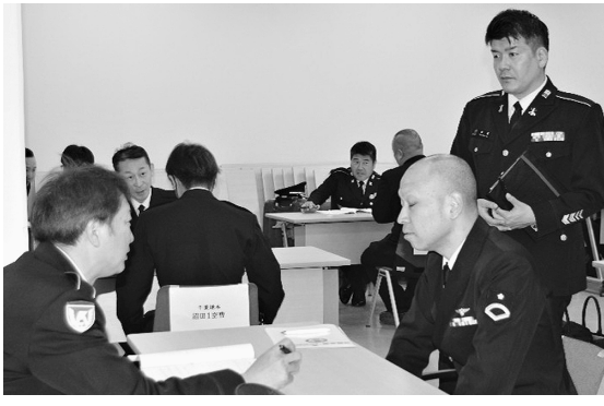
ロールプレイ方式での対面式実習