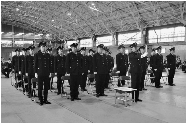
相馬原駐屯地 (第12偵察戦闘大隊)