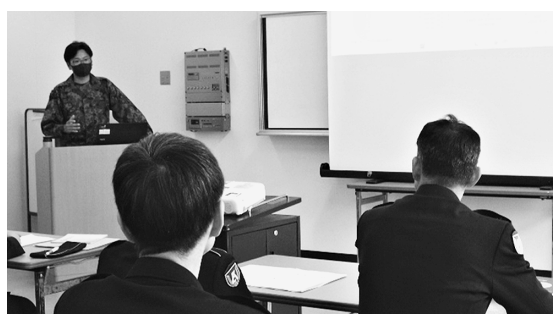
優秀広報官による広報官教育

実際に傾聴技法を取り 入れた対面式話法の実践 により、会話から相手の 特徴や思考の傾向などを 聞き取り、相手のニーズ にあった答えを準備しな がら次の接点を確実に獲 り組んだ。