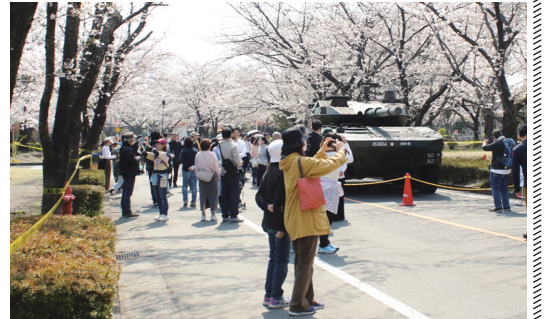
人だかりができた16式機動戦闘車