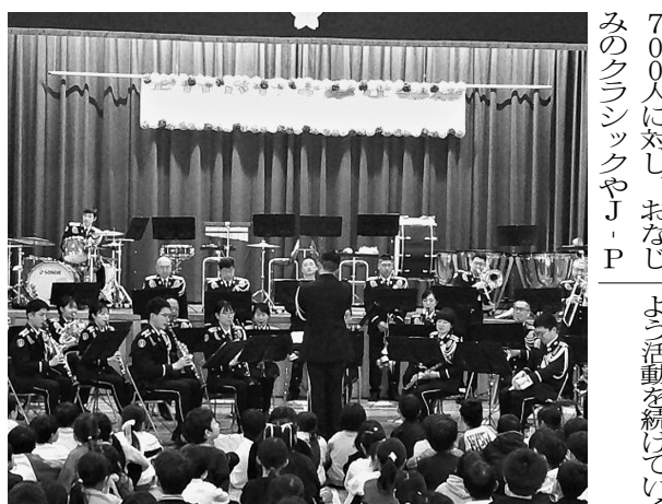
体育館さよなら演奏会

【室内楽演奏会】東部方面音楽隊は3月4日、彩の国さいたま芸術劇場音楽ホールにおいて、第46回室内楽演奏会を開催した。 室内楽演奏会は普段の吹奏楽編成（30〜50人程度）とは異なり2〜10人の奏者によって演奏され、各人の高度な技術や表現力が求められる。今回出演した組は昨年12月に実施された選考会を通り、8組