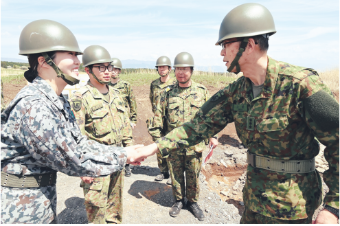
空自中部航空方面隊の作業小隊長を激励する総監

東部方面総監は4月13日、東富士演習場定期整備担任官（第1施設団長）を視察した。方面隊は演習場等整備推進委員会により、演習場の機能向上に、使用統制部隊と整備部隊との間で、運用ニーズと整備計画の整合を図っており、部隊が望む演練ができるよう着意している。担任部隊である第1施設