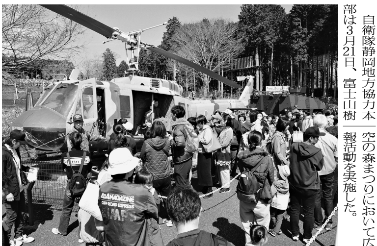
自衛隊静岡地方協力本部は3月21日、富士山樹空の森まつりにおいて広報活動を実施した。

当日は天候にも恵まれ親子連れを中心に約9300人が来場した。会場では高機動車の体験試乗や炊き出し、音楽演奏など多彩なイベントが行われ終日賑わいを見せた。 特に多用途ヘリコプターUH-1J、16式機動戦闘車や装甲車AMVの展示には多くの来場者が集まり、ヘリや車両の前で記念撮影を行う姿や隊員に熱心に質問する様子が見られた。(写真) 広報ブースでは装備や任務の紹介に加え、グッズ配布や施設見学も行われ、来場者は自衛隊の活動や任務について理解を深めた。 同本部は今後も体験型イベントを通じ、地域とのつながりを強化していく。