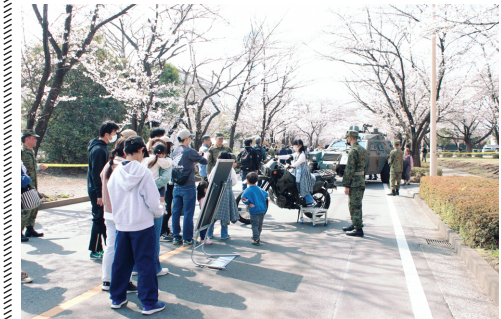
オートバイ（偵察用）の装備品展示