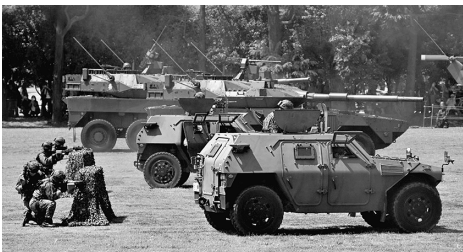
MCVやLAVを含む迫力ある訓練展示