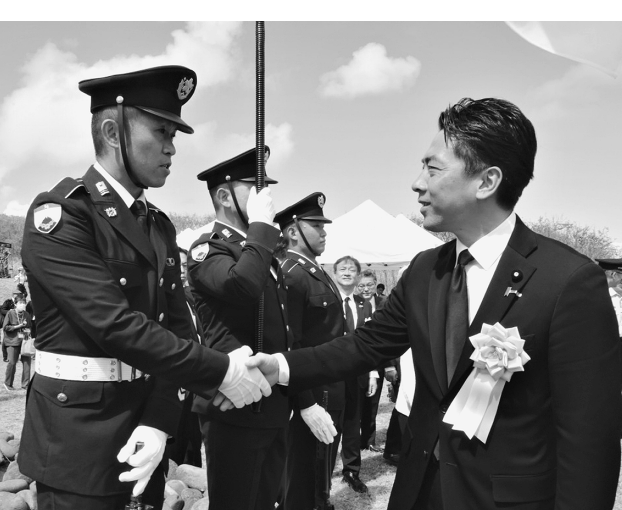
旗衛隊員を激励する小泉防衛大臣