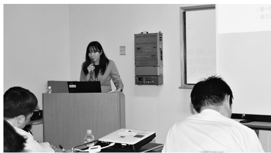
部外講師による ビジネスマナー等の教育