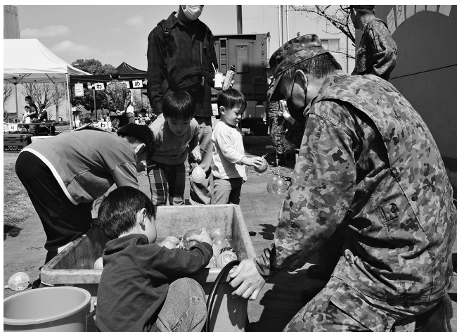
多くの子供で賑わったヨーヨー釣り

東部方面後方支援隊は朝霞駐屯地内において春の恒例行事である「観桜会」を開催した。本行事では日頃から部隊及び隊員を支える隊員家族や後援会、そして後方支援隊の伝統を築いてきたOBに対し、感謝の意を表するとともに、隊の活動に対して理解の促進を図ることを目的に開催した。 行事は部隊に多大な貢献のあった方に対する感謝状贈呈式から始まり、後方支援隊長より日頃の献身的な活動に対する深い謝意が伝えられた。続いて行われた隊員家族への説明会では、隊員の任務内容や家族支援制度について説明し、隊員家族の理解の促進及び安心感の醸成を図るとともに信頼関係をより強固なものとした。 会食会場では香ばしい匂いを漂わせる焼き鳥や、フランクフルト、ポテトやナゲットに加え、子供たちに人気の綿あめや、ヨーヨー釣りも用意され、会場の至るところまで賑やかな声が響き渡った。さらに装備品展示では小型トラックが展示され、特に子供たちが隊員の補助を受け運転席に座るなど自衛隊の装備品を肌で感じる貴重な体験を楽しんでいた。 引き続き東部方面後方支援隊は、地域や家族、そして後援会並びにOBとの絆を深め、今後も隊一丸となって任務に邁進する。