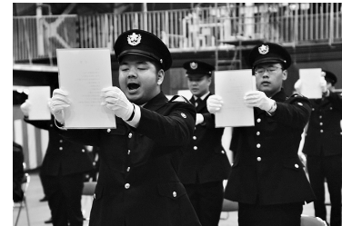
高田駐屯地 (第2普通科連隊)

旅団隷下部隊は各駐屯地で新隊員教育隊を編成し、3月下旬から自衛官候補生を受け入れた。着隊当初は緊張の面持ちであった候補生も数日のうちにたくましい顔つきに成長し、前途有望な127人が入隊式に臨んだ。