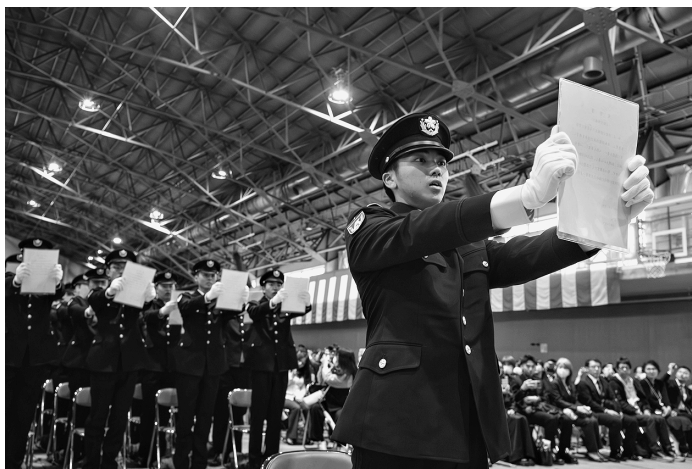
声高らかに宣誓文を読み上げる新隊員

混成団は令和8年度の 新隊員教育を女性自衛官 教育隊(女教隊)及び第 117教育大隊において 開始した。