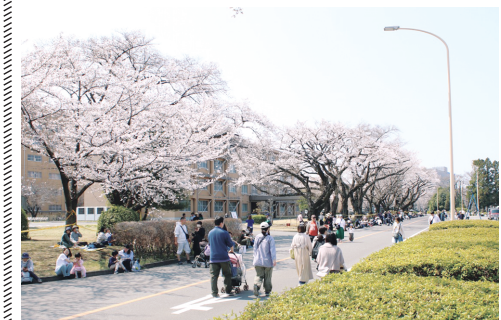
7400人が訪れた朝霞駐屯地