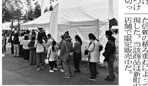
コラボ品購入に並ぶ記念行事来場者

はないか」との相談を受け、地域と共に被災地を元気づけたいと輸送支援に踏み切った。群馬県による義援物資の輸送態勢が整ったラスクは新町駐屯地を通じて被災地へ届けられた。その数は約4万枚に上る。今回の記念行事に合わせて新たに発売されたのはCAMPSHのINMACHIの文字が入ったラスク缶で、このコラボは同社からの提案と、隊員の希望という、地域に根差し