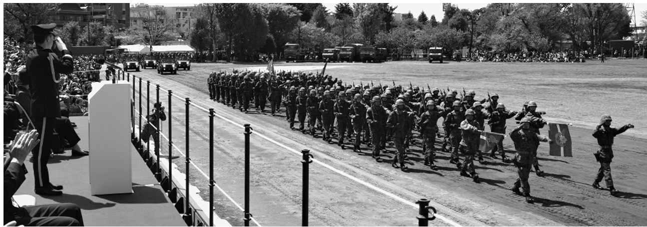
普通科部隊の一糸乱れぬ観閲行進

師団は晴天に恵まれた4月12日、第1師団創立64周年・練馬駐屯地創設75周年記念行事を開催した。当日は、小池東京都知事をはじめ、多数の来賓を招待し、約9000人の来場者が訪れる中、第1師団の精強性と練馬駐屯地の歴史を誇示した。