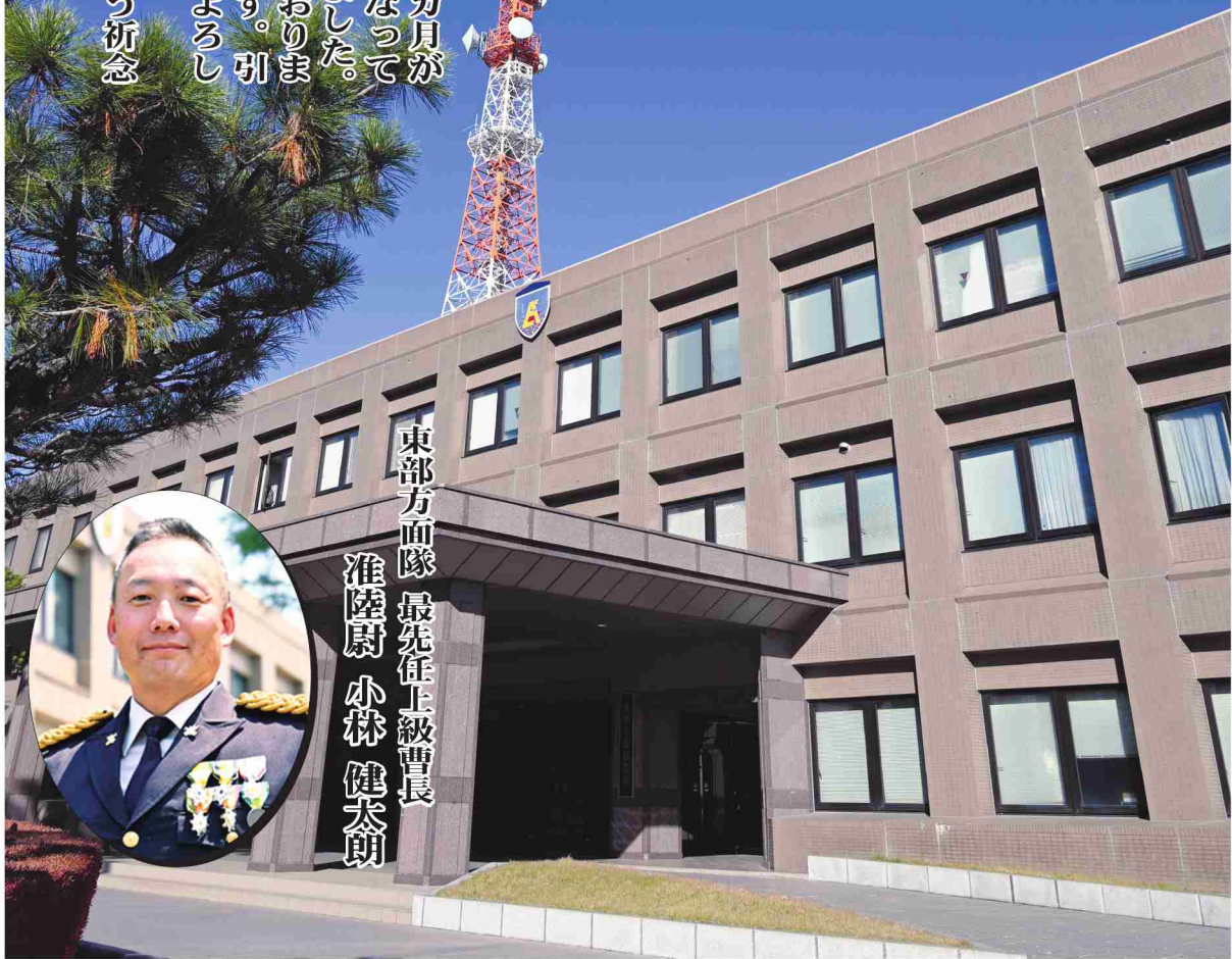
東部方面隊 最先任上級曹長