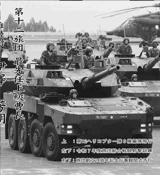
上：第12ヘリコプター隊6機編隊飛行 左下：令和7年度旅団総合戦闘射撃訓練 右下：旅団創設24周年記念行事観閲式予行