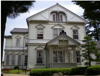
長岡外史師団長の 思い出入れ強く