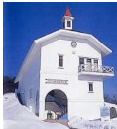
スキー発祥記念館

所在地:新潟県上越市大町2丁目3-30 建築年:明治43年(1910) ※平成5年に移築完成 構造:木造2階建て、地下室は復元せず 設計:陸軍経理部技手 加藤栄太郎 施工:高鳥組 見学:10:00~17:00 無料 休館日:祝日を除く月曜日、休日の翌日、年末年始 TEL :025-526-6903(上越市文化振興課)