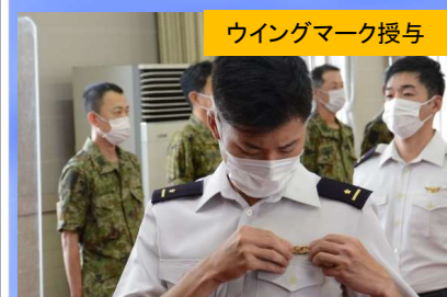
ウイングマーク授与

明野駐屯地は6月18日～7月11日の間、国内における米陸軍との実動訓練（オリエントシールド21）に、米軍航空機等の整備拠点として参加し、主に訓練部隊等の管理支援や米軍航空機の燃料給油支援などを行いました。各種支援を実施するにあたり、様々な事前準備を行い、「居心地の良い駐屯地」で訓練部隊ができるよう支援しました。