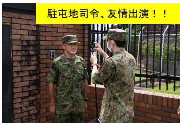
駐屯地司令、友情出演！！