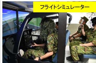
フライトシミュレーター