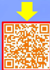
卒業編隊飛行動画

7月29日、航空学校で、第87期幹部航空操縦（前期）課程の卒業行事が行われ、6名の新たなパイロットが誕生しました。卒業生は、見事な卒業編隊飛行で有終の美を飾り、航空学校長からパイロットの証である、ウイングマークが授与され、喜びと、より引き締まった表情で陸上自衛官パイロットとしての第一歩を踏み出しました。卒業編隊飛行の様子を短編動画にまとめましたので、右のQRコード又は「航空学校/明野駐屯地」公式Twitterでは是非ご覧ください。「いいね」お待ちしております。