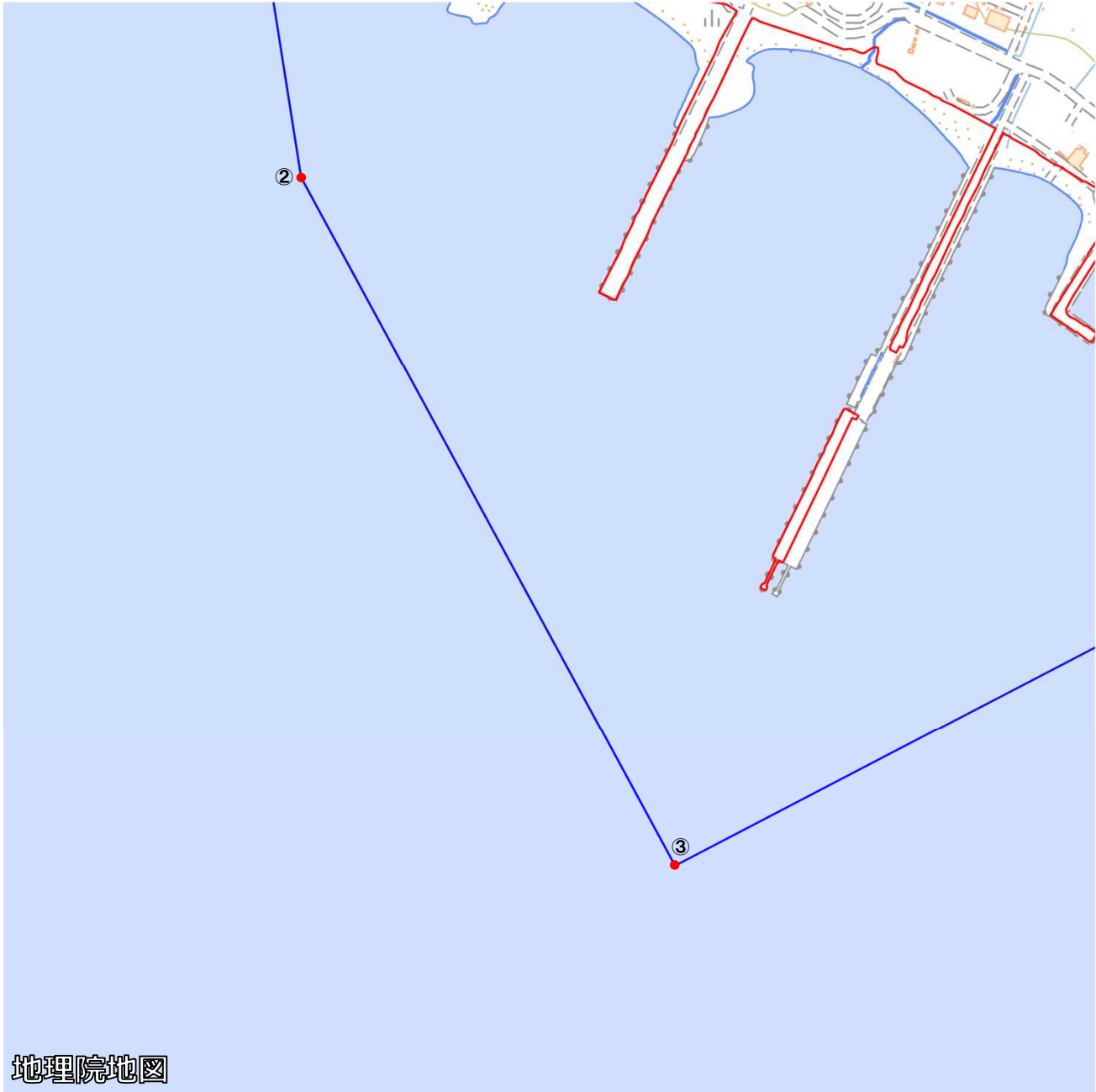
ホワイト・ビーチ地区周辺地域 図③