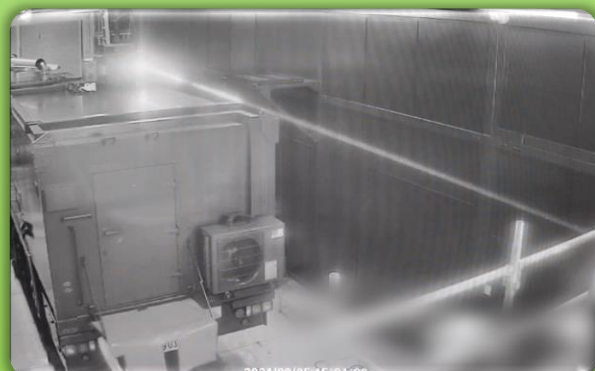
上：ビーム指向部 下：レーザー照射試験の様子