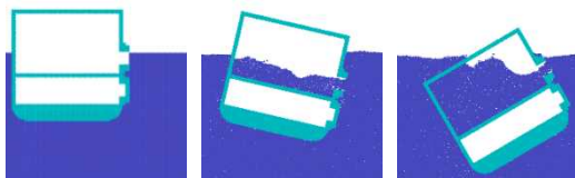
0.0 秒 1.0 秒 2.0 秒 図2 浸水を伴う浮体運動の数値解析

粒子法は、相互作用しながら移動する粒子として流体を表現する手法であり、自由表面での波崩れのような複雑な現象に対応できる特徴がある。ここで示した計算は、損傷した艦船に浸入した海水が復元性能に及ぼす影響に関する基礎研究である。本手法により、従来の解析手法では予測が困難であった、海水の出入りや浸入した海水の運動を含めた損傷時復元性の推定が可能である。