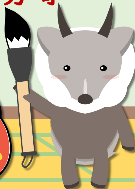
ニホンニ・キミシカ