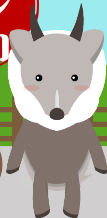
ニホンニ・キミシカ