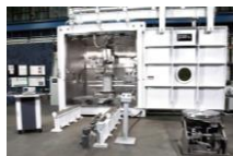
(3-② 参考) 製造工程の効率化 上：従来の手作業による製造工程 下：金属3Dプリンタ導入による自動化 (イメージ)