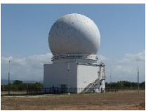
(4 参考) 装備移転 移転対象となり得る防空レーダー