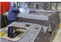
(6 参考) 米国における製造施設等の国有事例 上：空軍 United States Air Force Plant4 下：陸軍 Joint Systems Manufacturing Center