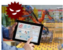
(3-③ 参考) サイバーセキュリティ強化 基盤強化の措置 (イメージ)