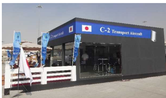
防衛装備庁の出展ブース