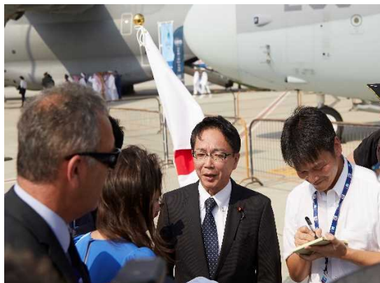
海外メディアへの対応