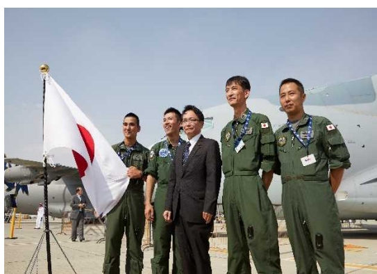
C-2 運航クルーへの激励