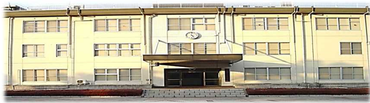
【中部航空方面隊司令部】