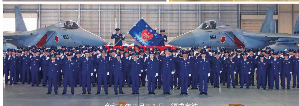
令和6年3月31日 編成完了