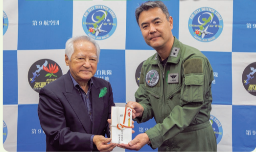
令和6年3月15日、隊員から集まった募金が、基地司令から公益社団法人沖縄緑化推進委員会理事長へ手渡されました。(編集室)