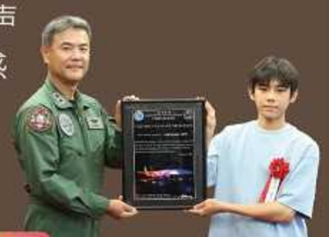
ライトアップの写真がこれ!

7月19日のサマーフェスタ当日は、F-15戦闘機が色鮮やかにライトアップされた希少な姿を見た来場者の方々から歓喜の声が上がるなど、感動する姿が見られました。