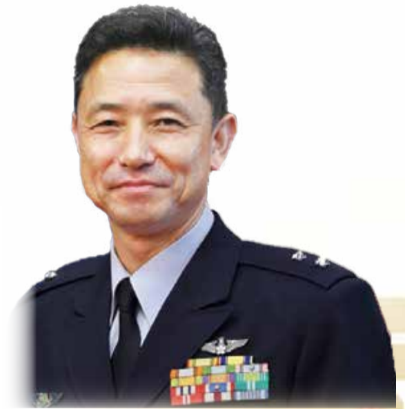
第9航空団司令 兼 那覇基地司令 空将補 高石 景太郎

新たな年を迎えるにあたり、隊員諸官、ご家族の皆様、そして地域の皆様のご益々のご多幸とご健勝をお祈り申し上げますとともに、今後とも変わらぬご理解並びにご支援を賜りますようお願い申し上げます、新年のご挨拶とさせていただきます。