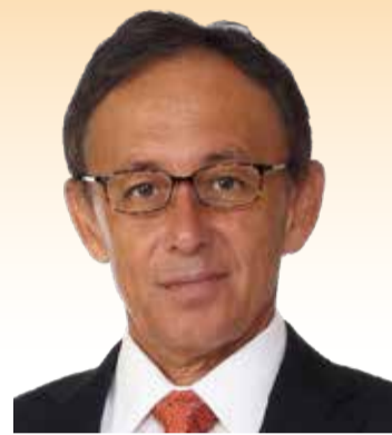
沖縄県知事 玉城 デニー