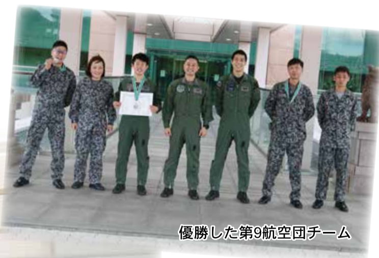
優勝した第9航空団チーム