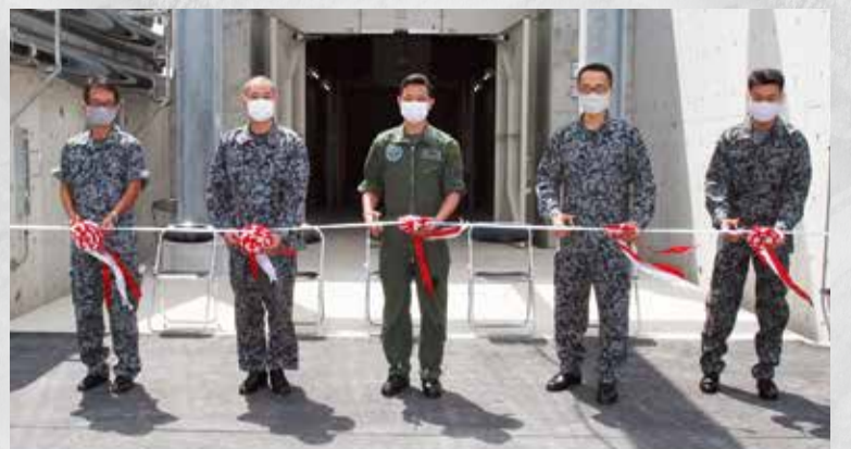
13番火薬庫完成 9空団整備補給群補給隊 令和3年4月12日