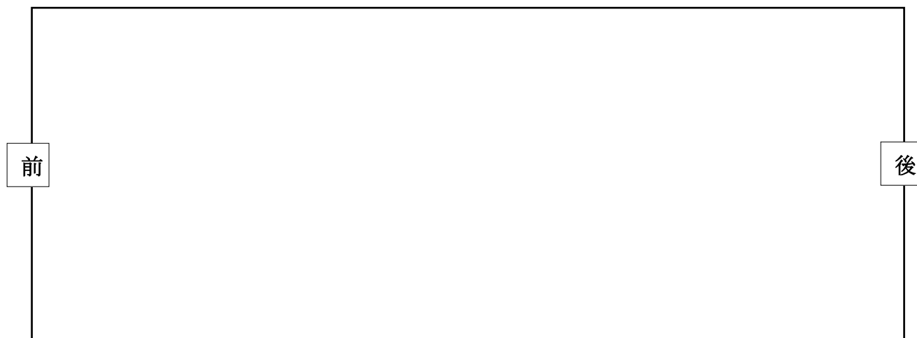
キッチンカー側面図 (販売窓を前面とした図)