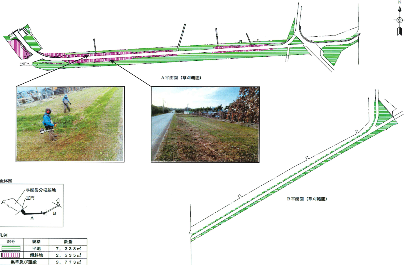
図1 - 与座岳分屯基地全体図及び草刈り範囲