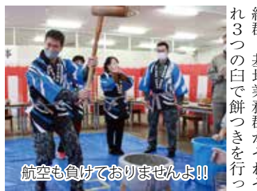
航空も負けておりませんよ!!

ターと基地モニターの方など多くのご来賓に臨席をいただいた。 與儀基地司令からの挨拶、與森航空自衛隊美保基地協力会会長からの挨拶が終ると、飛行群、整備補給群、基地業務群がそれぞれ3つの臼で餅つきを行った。