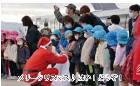
ウサギのトピコもクリスマス仮装で大人気♡ メリークリスマス! はい! どうぞ!

場所(パラシュート)に着地すると大きな歓声と拍手が湧き起こった。 プレゼントを見事狙い通りに届けたC-2はふわりと着陸して園児らが待つ駐機場へと戻って来た。 貨物用の大きな扉が開くと、中から大勢のサンタと2匹のトナカイが仲良くスキップを踏みながら園児のもとへ駆け寄り、代表の柴サンタが園児にクリスマスメッセージを届けた後、サンタたちからプレゼントの