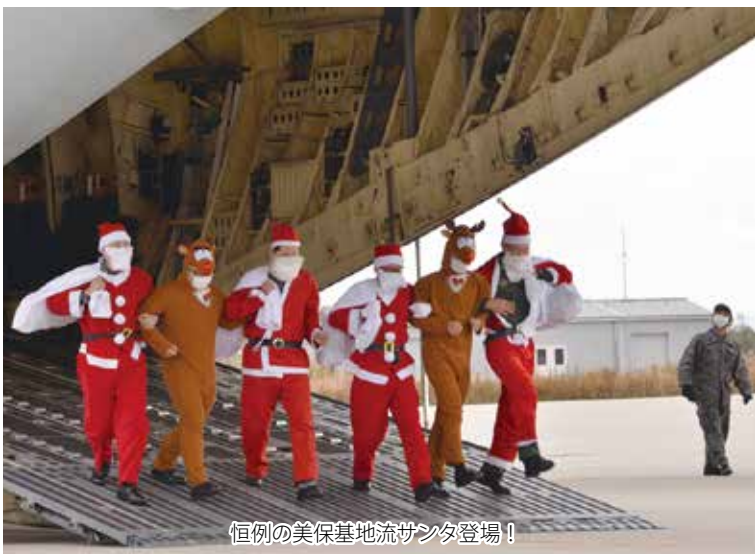
恒例の美保基地流サンタ登場!

そして見事に狙い通りの場所にパラシュート(プレゼントのコンテナ)が着地すると大きな歓声と拍手が湧き起こった。 プレゼントを見事狙い通りに届けたC-2はふわりと着陸して園児らが待つ駐機場へと戻って来た。 貨物用の大きな扉が開くと、中から大勢のサンタと2匹のトナカイが仲良くスキップを踏みながら園児のもとへ駆け寄り、代表の柴サンタが園児にクリスマスメッセージを届けた後、サンタたちからプレゼントの