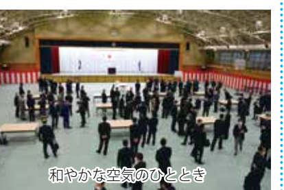
和やかな空気のひとつ

くった。今回の取材で、地域住民の方々、協力団体の皆様、写真員として、地域住民の皆様から一目で理解と信頼を得られるような、そんな写真を撮っていきたくと決意を新たにしました。(松坂特派員)