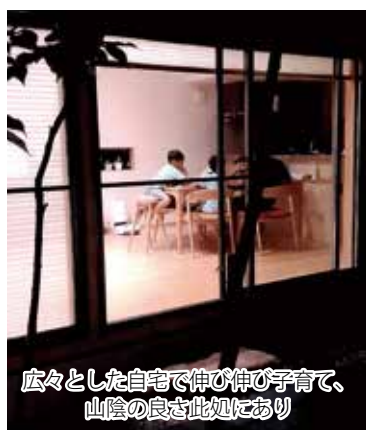
広々とした自宅で伸び伸び子育て、山陰の良さを此処にあり

付きの贅沢な平屋を建てられるのも、ここならではの魅力だと感じています。美保にきてからは、子供達も大きく成長しました。長男は今年、大山でスキーデビューし、次男は春から小学校へ。三男は赤ちゃんだったのが、今では兄弟で一番のいたずら好きです。こうして豊かな自然や新しい自宅で、家族とたくさんの思い出を共有できるとに感謝しています。今日も家族からたくさん元気をもらって、精一杯仕事に取り組み、日々成長していきたいと思っています。