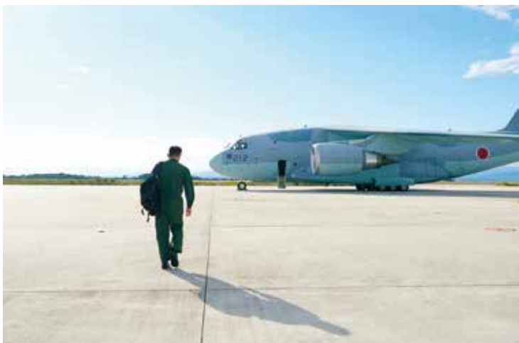
相棒たちとのラストフライト

秋のことだった。晴れ渡ったある朝、一人の男が最後のフライトに向けて歩を進める。212号機が最後の相棒、今待ち受ける乗組員たちが最後の相棒。この東の間のフライトが終われば、やがて彼は自衛隊を去る。