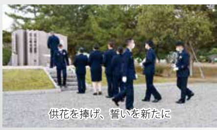
供花を捧げ、誓いを新たに