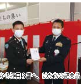
與儀基地司令から江目3曹へ、はたちの記念品

本日はありがとうございます。」「要旨」と謝辞を述べると会場はあたたかい拍手に包まれた。 催しは基地准曹士先任の万歳で締めくくられた。