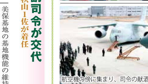
航空機の傍に集まり、司令の献酒を見守った

もう二十年近く前に私は二級のファイナンシャルプランナー(FP)の資格を取得した。自衛官である私がこの資格を目指したのは、普段の業務で馴染みの薄いお金のことについて、もっとよく知ろうと思ったから、と言えは聞かぬが、実際はただ合法的な形でお金儲けしたかっただけなのかもしれない。私がFPを目指したときはそれほどメジャーな資格ではなかった。ただ最近では老後二千万円問題もあつてか、お金のことに関心が集まり、自衛官の中にも定年を前にして、FPの資格を取る人が増えてきている。