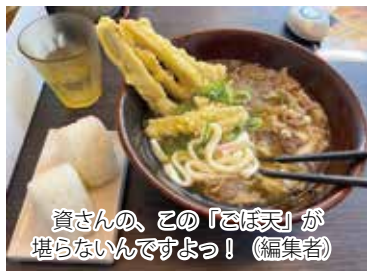
資さんの、この「ごぼ天」が堪らないんですよ!! (編集者)