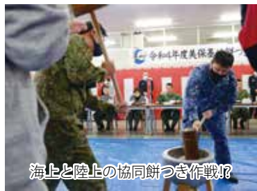
海上と陸上の協同餅つき作戦!?