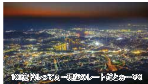
100億ドルってえ...現在のレートだとお...¥€