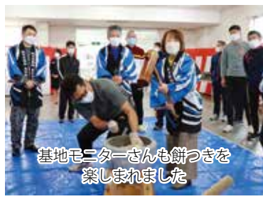
基地モニターさんも餅つきを楽しみました