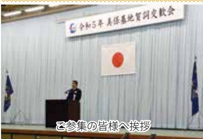
ご参集の皆様へ挨拶

の拠点空港となります米子鬼太郎空港、「住民の足」、生活に欠かせないものですので、我々航空自衛隊美保基地は常に迅速、確実、安全に除雪を実施して自衛隊の任務遂行はもとより、空港の安心安全な利用に貢献すべく尽力してまいります」と意気込みを語った。当日は悪天候のため、車両行進の視界は取り止め、整列した隊員ら