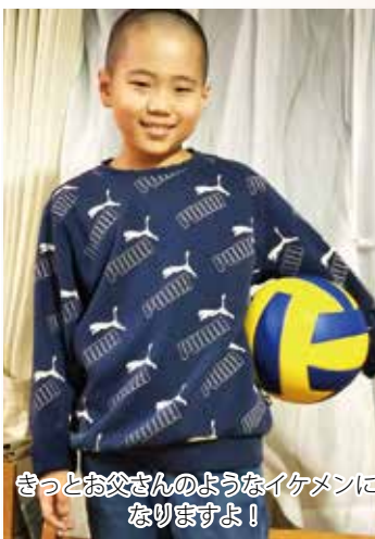
きっとお父さんのようなイケメンになりますよ!

ぼくのお父さんは力もちです。よくお父さんのうでにぶら下がらせてくれます。あと、かみを切るのもうまいです。ぼくのかみがのびると切ってくれます。休みの日にはテニスやバドミントンやバレーボールをいっしょにやってくれます。バレーボールをやっていたのにうまいです。ぼくも大きくなったらお父さんみたいなになりたいです。