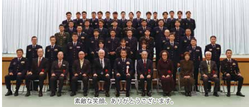
素敵なお顔を、ありがとうございます。

た。これを皮切りに、與儀基地司令をはじめ基地主要幹部や、ご来賓も交えて餅つきが行われ、会場は和気と活気に満ち溢れた。 餅つきを終えたご来賓の方々は、振舞われたつきたてのお餅と力うどんを味わいながら、目前で更に続く令和5年の年男・年女たちによる餅つきを笑顔で浮かべ、愛でていた。 にぎやかとなった会場ではご来賓の方々と隣席の主要幹部らとの会話に花が咲き、令和4年最後の基地行事となった基地餅つきは盛況のうちに幕を下ろした。