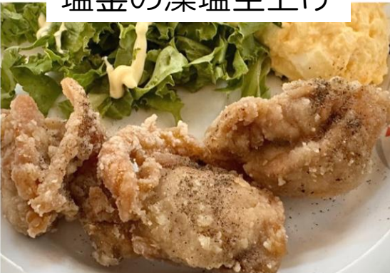
塩釜の藻塩空上げ

色白の古風なあなたと・・・ ついに出会ってしまいました。 も～ドウしお～☆ 他の塩にうわきは禁物よ～