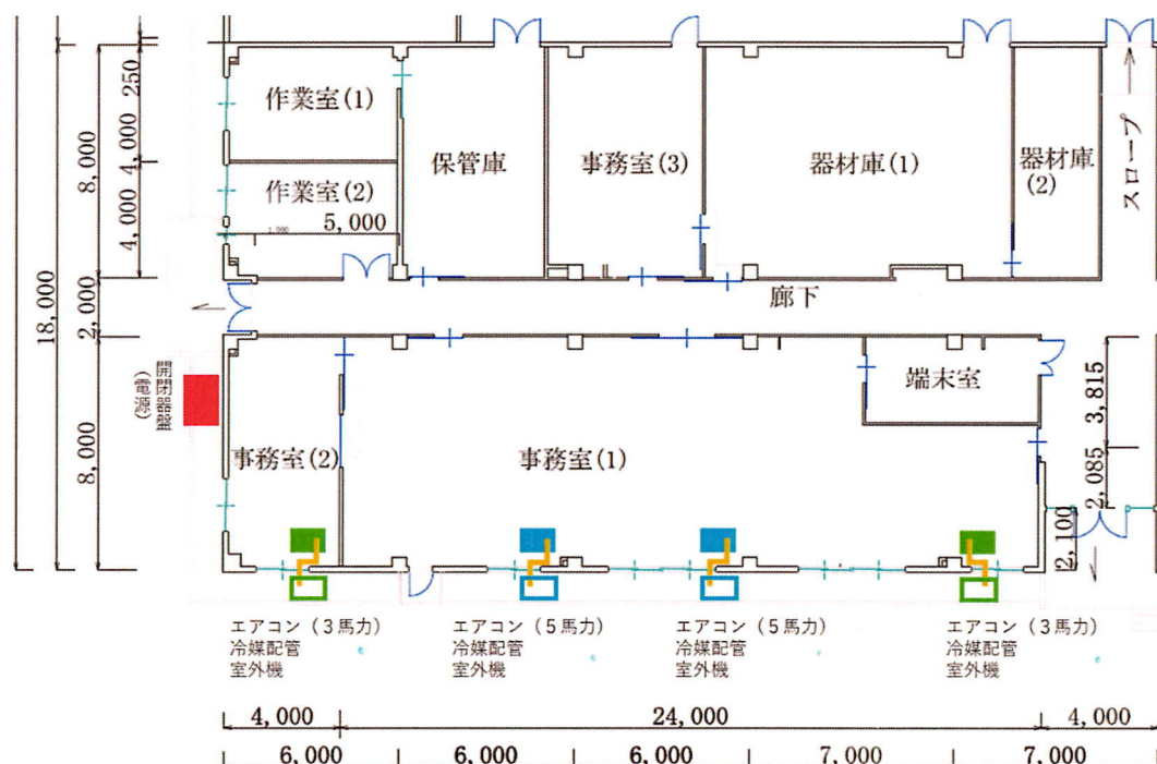
図2-設置場所等(平面図)

※ 設置場所は図の位置を基準とし、窓パネル等を使用して冷媒配管を設置することで窓を施錠可能な状態にするものとする。細部は契約担当官との協議による。