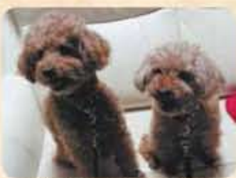
モカ(左) ショコラ(右)