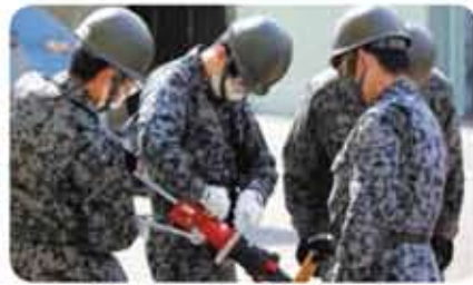
油圧カッター取扱い訓練