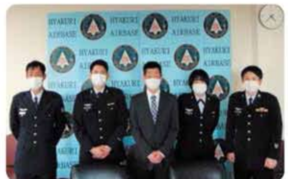
参加したh&s for Uとスズメバスターズ2