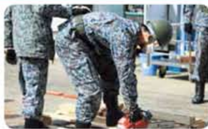
チェーンソーで木材を切断