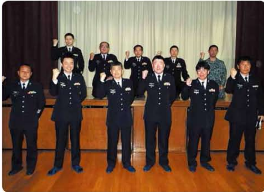
令和3年度百里基地准曹会役員

百里基地准曹会は、3月4日(木)にレクリエーションセンター2階にて、令和2年度百里基地准曹会定期総会を実施しました。 実施に関して、新型コロナウイルス感染拡大防止のため、参加人数を制限する処置にご協力いただき、ソーシャルディスタンスを確保した形で実施しました。この総会において、令和2年度の事業成果及び令和3年度の事業計画が承認されるとともに、第46代准曹会会長に7空団整備補給群装備隊の〇〇曹長が就任しました。伝統あるこの百里基地准曹会の意思を受け継ぎ、「人」を育てることを意識して活動していただければと思います。 計画のほとんどを中止し、活動実績の少ない年になってしまいましたが、1年間の百里基地准曹会活動へのご理解、ご協力に感謝いたします。今後とも百里基地准曹会をよりよくお願い申し上げます。 第45代会長