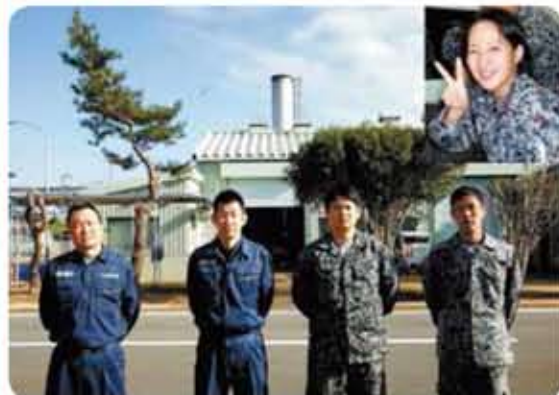
優秀賞受賞したh&s for Uのメンバー