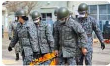
要救助者の搬送演練