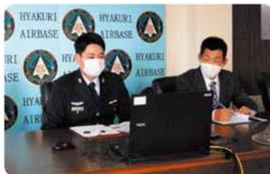
リモートでの質疑応答中