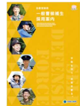
採用種目別 パンフレット