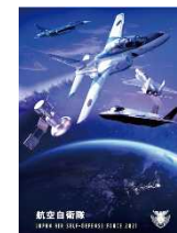
航空自衛隊 パンフレット

パンフレットは航空自衛隊ホームページから▼ https://www.mod.go.jp/asdf/