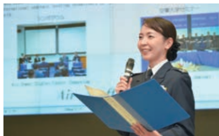
国際フォーラムでの様子