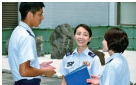
同僚の厚い信頼と高い評価