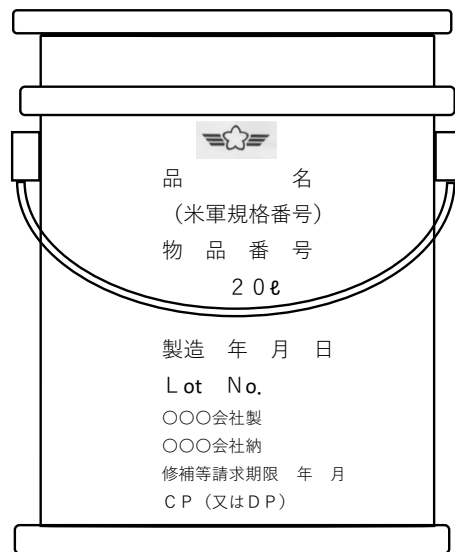
付図8 - 20リットルペール缶