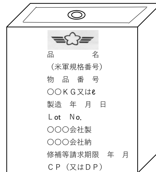
付図6－グリース用缶 (航空機用)