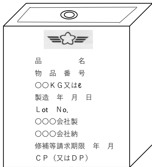
付図7 - グリース用缶 (航空機用以外)