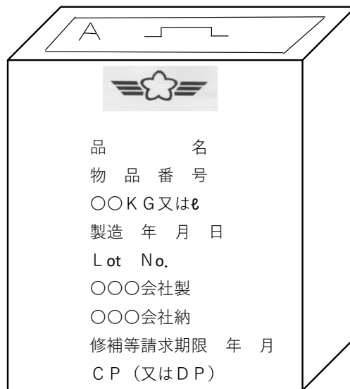
付図5－金属板製18リットル缶新缶 (航空機用油類用以外の油類用)