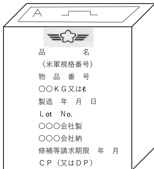
付図4－金属板製10リットル缶新缶 (航空機用油類用)