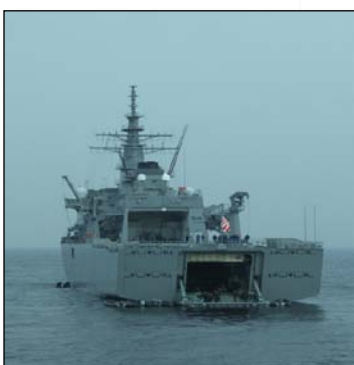
“うらが”の艦尾ハッチ開口の様子