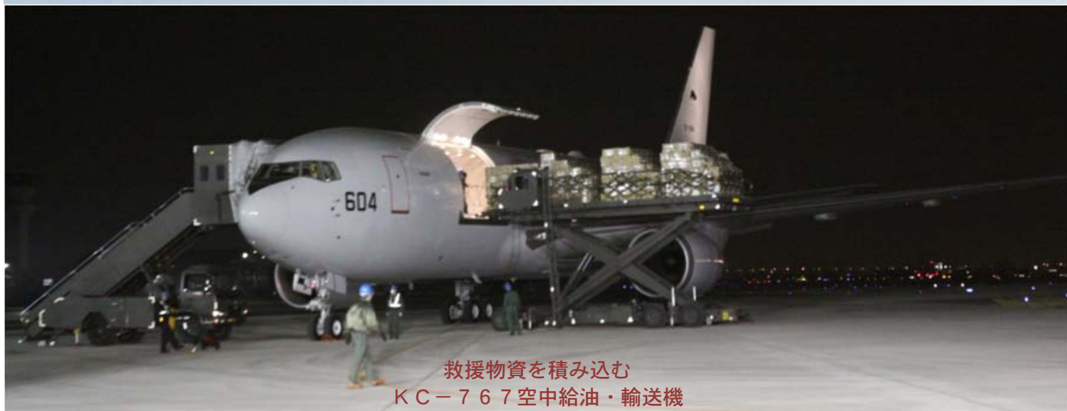
救援物資を積み込む KC-767 空中給油・輸送機