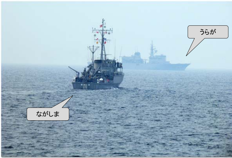
訓練中の“ながしま”船尾後方にケーブルを流して訓練を行います。