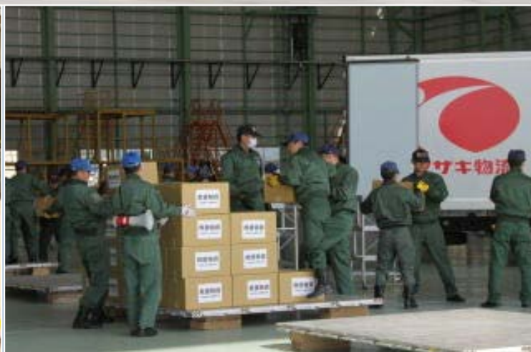
トラックから救援物資を降ろす隊員

航空自衛隊小牧基地は、東北地方太平洋沖地震における大規模災害派遣に関する地方公共団体及び民間からの救援物資の統合輸送構想に基づき、C-130H輸送機やKC-767空中給油・輸送機などを使用して、近畿、東海、北陸地域等から集められた救援物資（食料、水、各種生活用品等）を福島空港やいわて花巻空港、航空自衛隊松島基地などへ空輸しています。