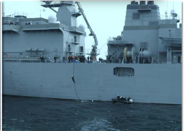
“うらが”から降下する訓練中の水中処分隊員。