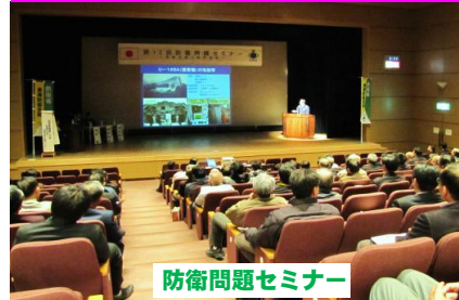
防衛問題セミナー