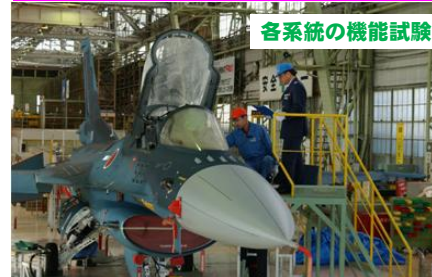
各系統の機能試験

自衛隊の任務遂行に必要な装備品の調達にかかる原価監査及び監督・検査を行っています。