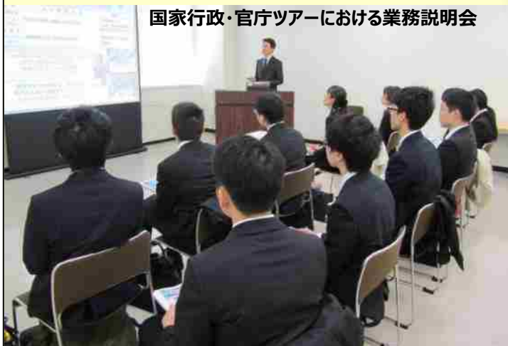
国家行政・官庁ツアーにおける業務説明会

地方防衛局は、人事院が実施する国家公務員採用一般職試験及び防衛省が実施する防衛省専門職員採用試験の合格者から職員を採用しています。