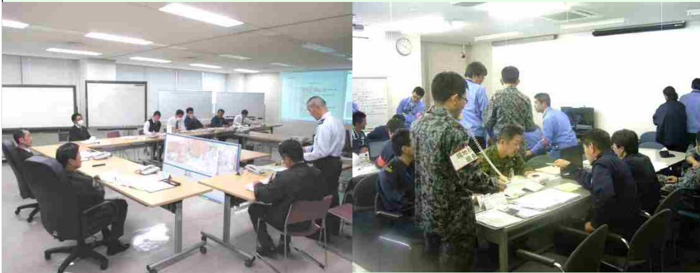
対策本部（東海防衛支局）

平成29年3月6日、三菱重工業（株）の協力を得て、官民合同による「航空事故対処訓練」を実施し、連携した対処要領を再確認しました。この訓練は、同社における定期修理中の自衛隊機に航空事故が発生したことを想定し、官民相互の対処能力の向上を図ることを目的として、毎年実施しているものです。