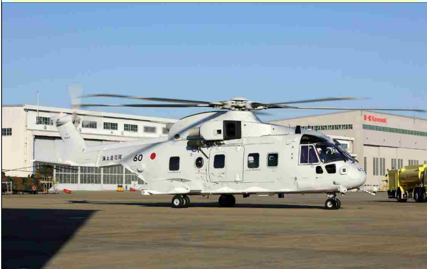
完成した最終13号機

平成29年3月10日、航空自衛隊岐阜基地に隣接する川崎重工業（株）岐阜工場において、掃海・輸送ヘリコプター（MCH-101）／多用機ヘリコプター（CH-101）の最終号機の完成記念式が行われました。