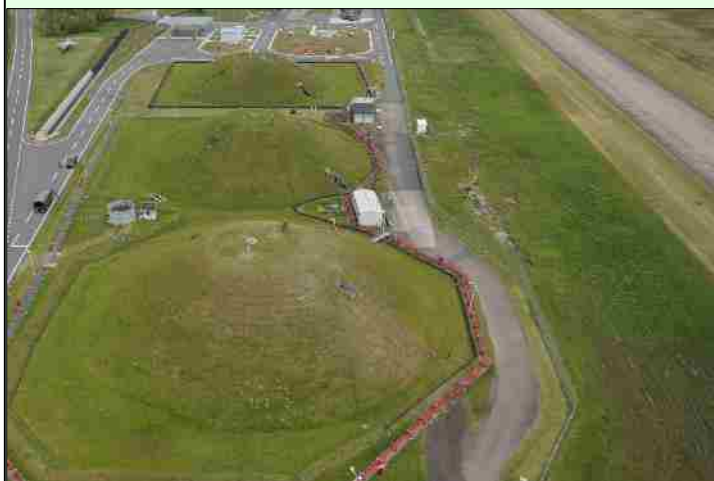
整備前の燃料施設

同施設は、岐阜基地内の航空機の燃料を保管するための施設として昭和50年代に建設された施設であり、建設後40年以上を経過し、老朽化していたため、整備工事を平成23年度から逐次行い、今回の燃料タンク、給油施設及び付帯施設の完成により、同整備が完了したものです。