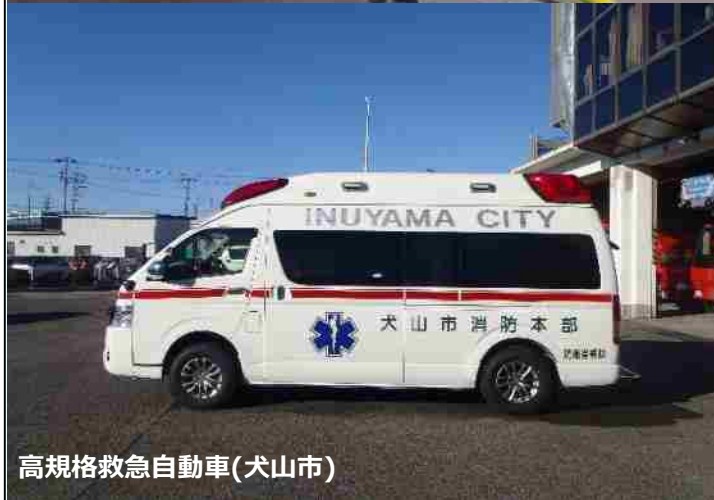
高規格救急自動車(犬山市)

当消防本部では、水を2,000ℓ積載した圧縮空気消火装置搭載の水槽付消防ポンプ自動車を導入しました。この車両は、火災現場に最も接近し重要な初期の火災戦闘を行います。消火時の水量を抑えることで建物などへの水による損害を軽減し、泡を壁に付着させることで延焼を防止でき、よりの確かつ効率的に消防活動を行うことができますようになりました。