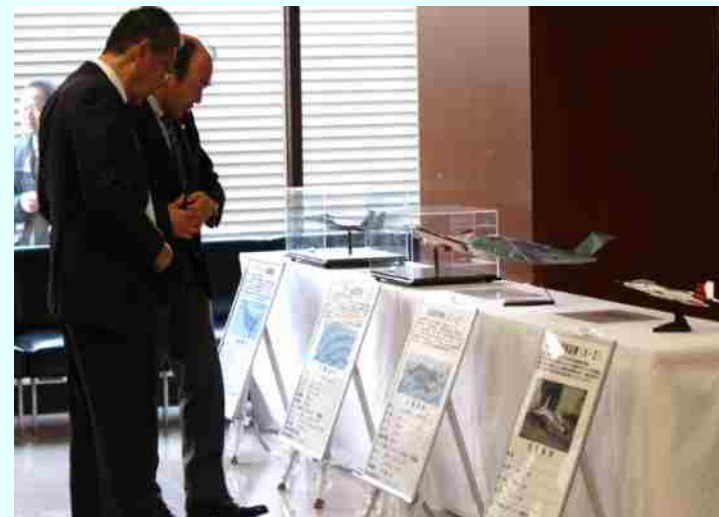
岐阜基地から協力を受けた模型展示に見入る来場者