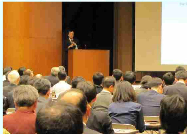
講演を熱心に聞き入る来場者

来場者からは多数の質問があり、終了後には、「普段聞けない話を聞くことができ大変有意義で参考になった」などの感想が寄せられました。