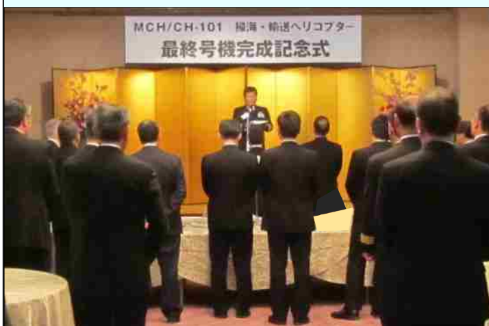
最終号機完成記念式の様子

同機は、レオネルドMW社（旧アグスタ・ウェストランド社）が開発したものを川崎重工業（株）がライセンス生産した機体であり、MCH-101は航空掃海及び輸送の任務を遂行しています。また、CH-101は多用機として、平成21年度からの南極地域観測協力に参加しています。