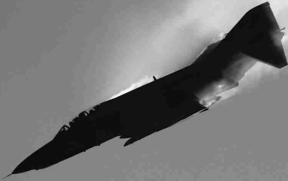
作品名「頑張れ ファントム!」

防衛省では、隊員が余暇活動を通じ創作した作品の絵画、書道、写真を募集し、優秀作品を表彰する「全自衛隊美術展」を隔年で実施しています。