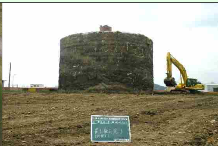
盛り土撤去後の旧燃料タンク