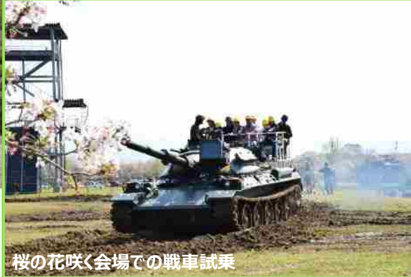
桜の花咲く会場での戦車試乗