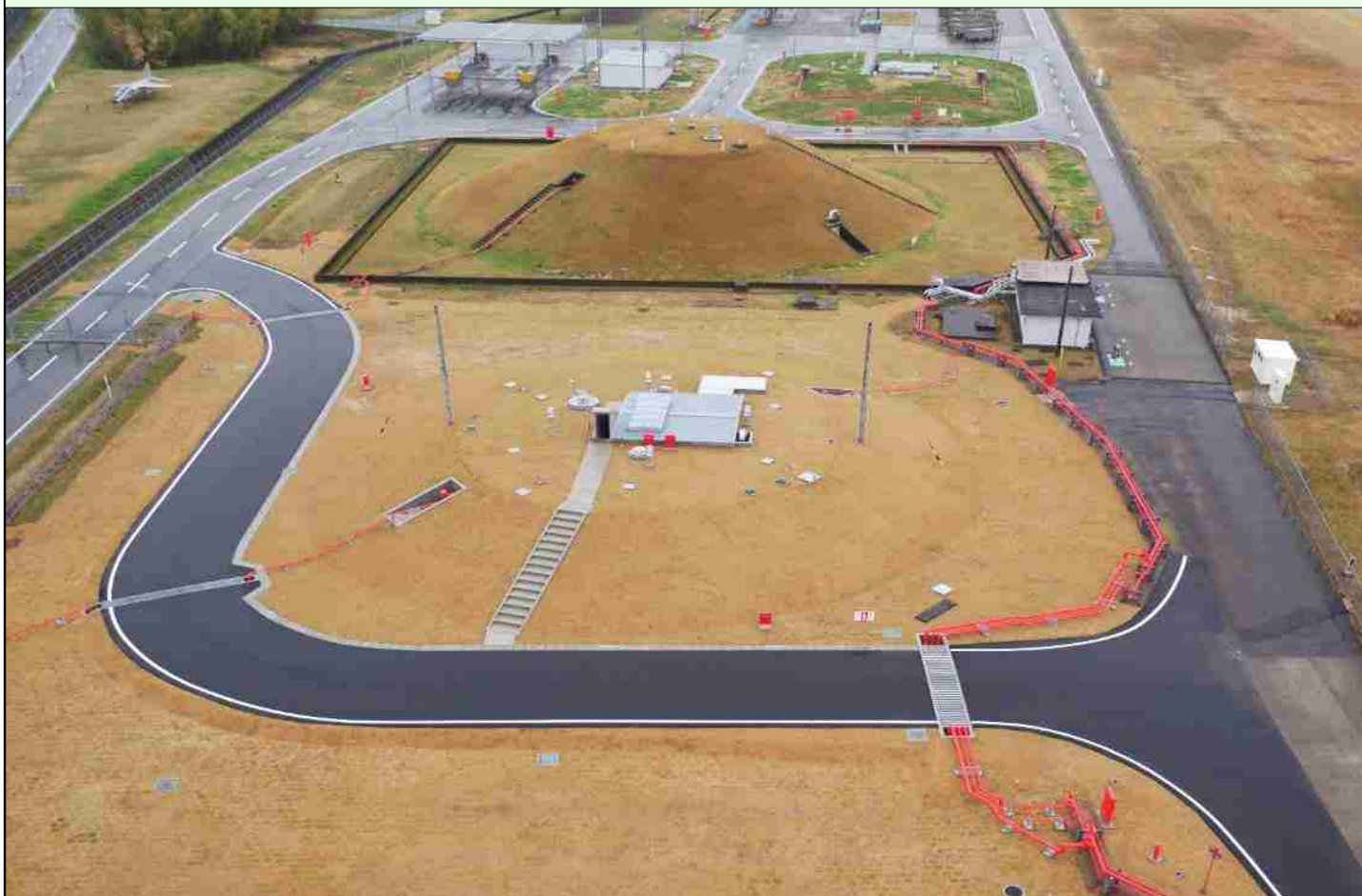
完成した燃料施設