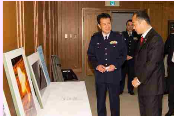
宮澤防衛大臣政務官に作品を説明