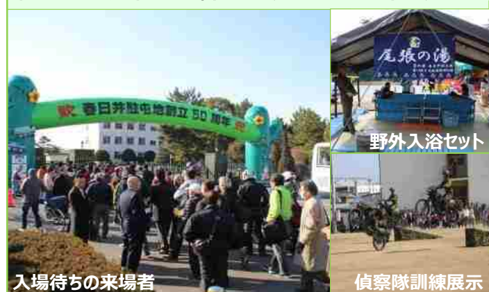
入場待ちの来場者