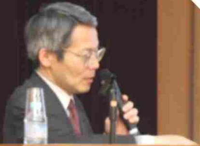
野間俊人技術戦略部長 (防衛装備庁)