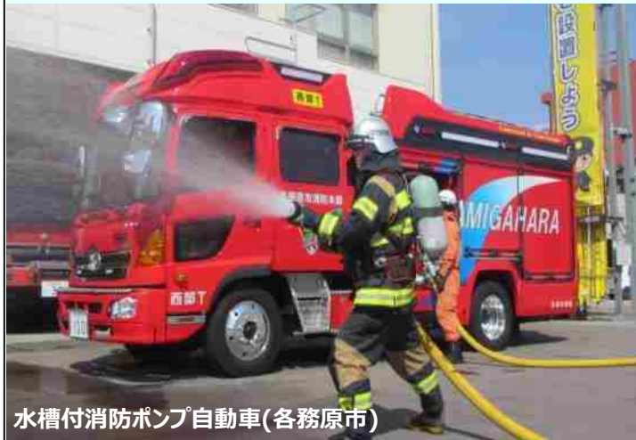
水槽付消防ポンプ自動車(各務原市)

各市の消防施設を更新したことにより、より万全の消防態勢を整えることができ、各市の防災体制の向上につながっています。