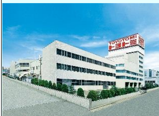
株式会社トヨトミ本社

需品は、隊員の衣食住に係る器材であり、毎日のように身近で使用するものです。同社のストーブは、決して目立つことのない後方支援用器材のひとつですが、自衛隊員の健康を守り、士気を高めることにより、自衛隊の活動を支えているのです。