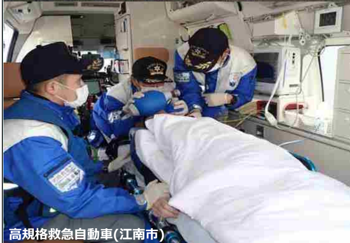
高規格救急自動車(江南市)

今回の高規格救急自動車の更新により、高まる救急業務の要請に対応可能となりました。