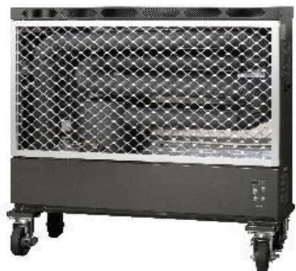
天幕ストーブ、業務用2型