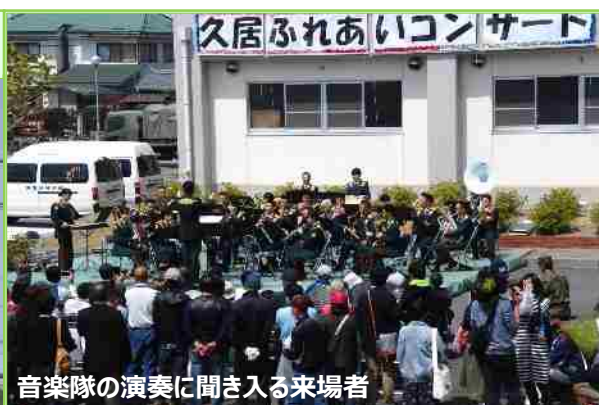
音楽隊の演奏に聞き入る来場者

津市（三重県）にある久居駐屯地において「久居駐屯地開設65周年記念行事」が開催され、約6,000名が来場しました。