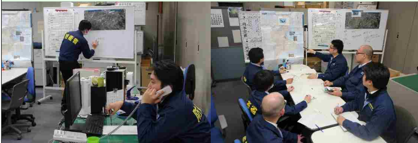
関係機関に情報を伝達する職員

平成29年3月29日、米軍航空機が予防着陸したという事故想定を基に本省や関係自治体（仮想）に情報伝達を実施し、米軍航空機事故が発生した場合の通報体制が迅速かつ効果的に機能するよう訓練しました。当該訓練は、事故発生時における職員の対処能力向上を図ることを目的に定期的な実施しているものです。