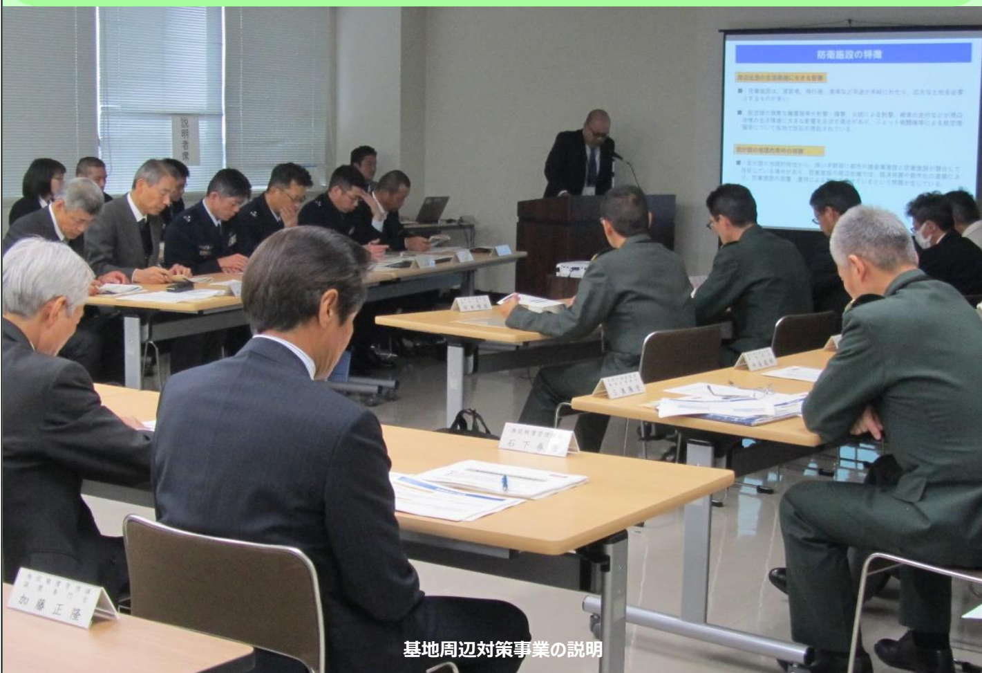
基地周辺対策事業の説明