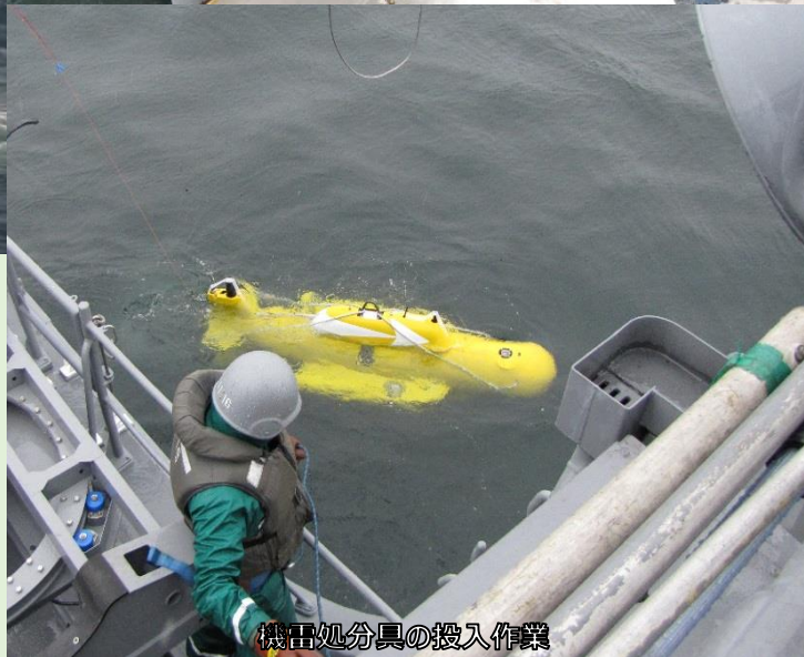
機雷処分具の投入作業