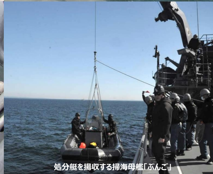
処分艇を揚収する掃海母艦「ばんご」