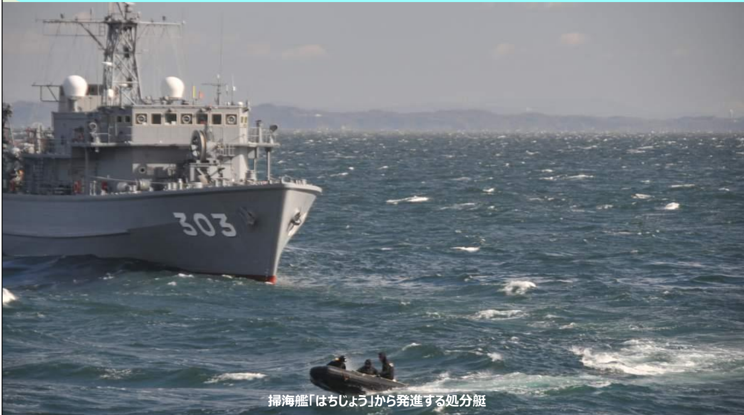
掃海艦「はちじょう」から発進する処分艇