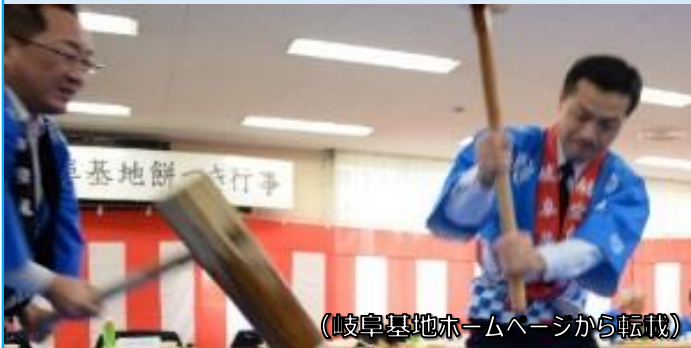
(岐阜基地ホームページから転載)

管内の駐屯地や基地では、12月に「餅つき行事」を開催し、地域と交流しました。(写真は各務原市長(左)と空自岐阜基地司令(右))