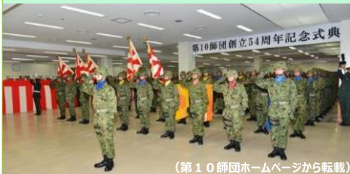
(第10師団ホームページから転載)

名古屋市にある守山駐屯地において、「第10師団創立54周年記念行事」が開催され、約4,500名が来場しました。