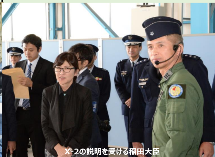
X-2の説明を受ける稲田大臣