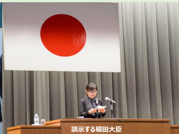
訓示する稲田大臣