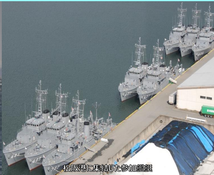
松阪港に集結した参加艦艇