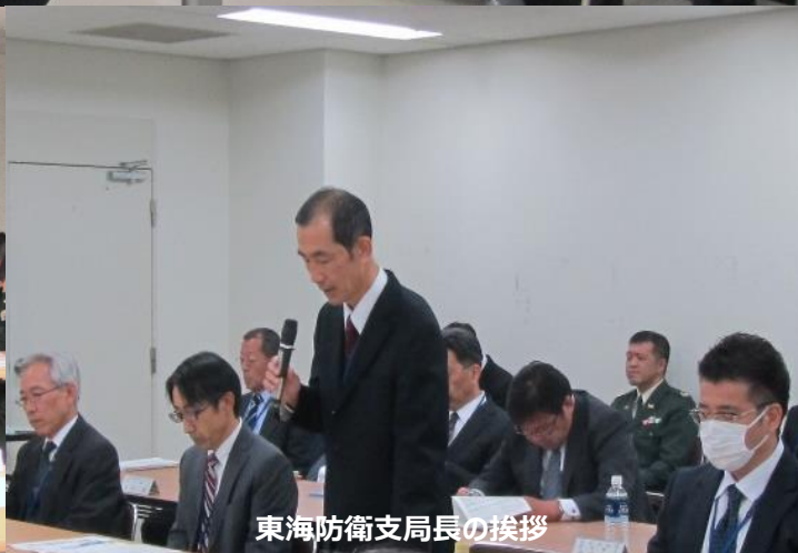
東海防衛支局長の挨拶

東海防衛支局では、平成28年11月30日、管内の部隊や自衛隊地方協力本部と基地周辺対策事業や防衛施設周辺における諸問題について意見交換を行い、基地運用の充実を図るため、「平成28年度東海防衛支局管内部隊等連絡調整会議」を開催しました。