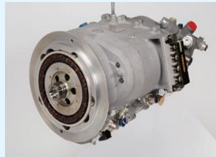
シンフォニアテクノロジー伊勢製作所 （航空宇宙生産工場）