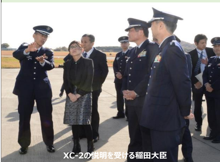
XC-2の説明を受ける稲田大臣