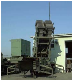
発射機 (ミサイルを搭載及び発射する)