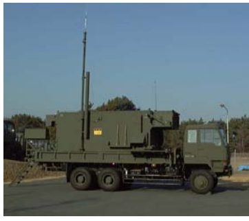
射撃管制装置 (射撃の指令等を行う)