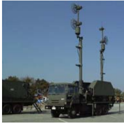
アンテナ・マスト (無線中継装置を通じた、射撃管制装置と他の部隊との間の通信の増幅を行う)