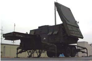
レーダー装置 (電波を照射して目標の搜索、追尾、ミサイル誘導等を行う)