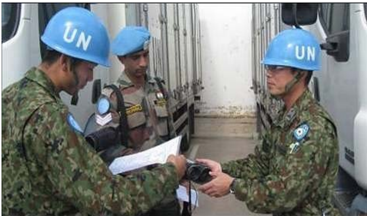
インド隊との輸送調整