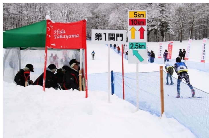
クロスカントリー競技での通信支援

陸上自衛隊第35普通科連隊は、2月14日（火）から17日（金）までの間、高山市の鈴蘭シャンツェや鈴蘭高原スキー場で行われたスキー競技（スペシャルジャンプ、クロスカントリー）で、ジャンプ台とクロスカントリーコースの整備や会場設営などに協力しました。