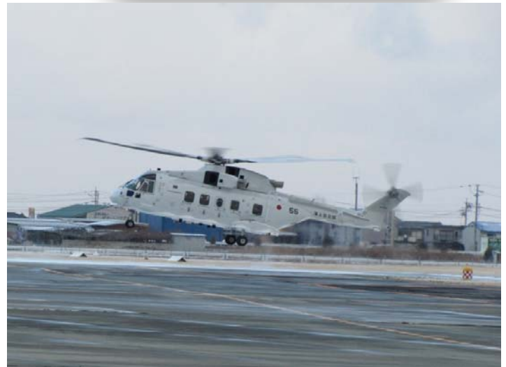
明野飛行場に着陸する訓練中の掃海ヘリ