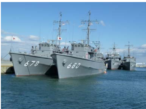
松阪港に集結した掃海艦艇