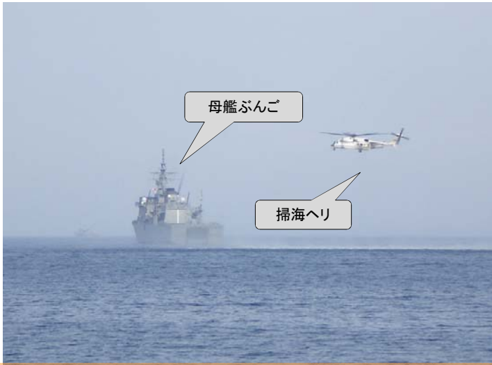
訓練中の“母艦ぶんご”と掃海ヘリ