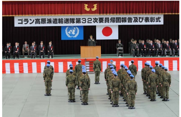
国会議員等来賓多数参列のもと執行された帰国報告