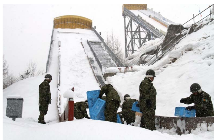
スキージャンプ台のコース整備