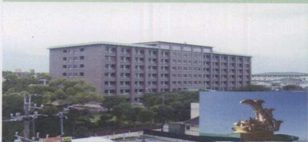
守山駐屯地 本部庁舎 平成21年5月完成