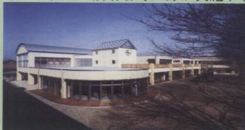
各務原市那加中央保育園

飛行場周辺において、航空機の頻繁な離着陸等による音響の障害を防止・軽減するため、市町村等が実施する学校、病院、特別養護老人ホームなどの防音工事や音響障害が著しいとして指定された区域内の住宅の所有者等の方が実施する防音工事に対して助成を行っています。