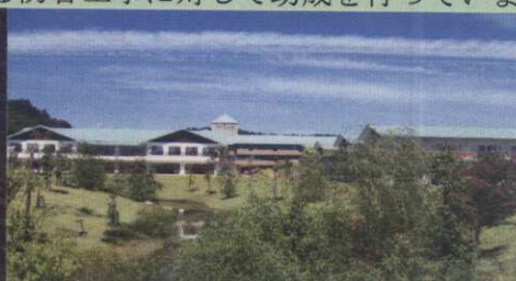
飛鳥美谷苑(特別養護老人ホーム)