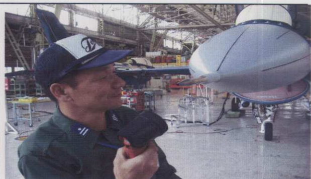
速度検知センサーの工程確認