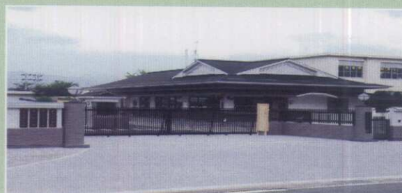
豊川駐屯地 警衛所 平成20年8月完成