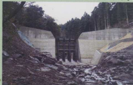
大原川砂防工（三重県）

飛行場・演習場などがあることによって周辺住民の方に影響を及ぼす場合には、その障害を緩和するため、市町村が行う公園・消防施設・道路等の整備に対して助成を行っています。