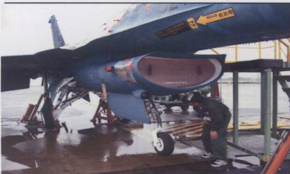
航空機の前脚室内の工程確認

これら航空機以外にも、ペトリオットなどの誘導弾、小型トラックなどの車両、小銃、弾薬など様々な装備品の検査・監督・原価監査を実施しています。