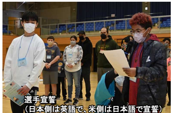
選手宣誓 (日本側は英語で、米側は日本語で宣誓)