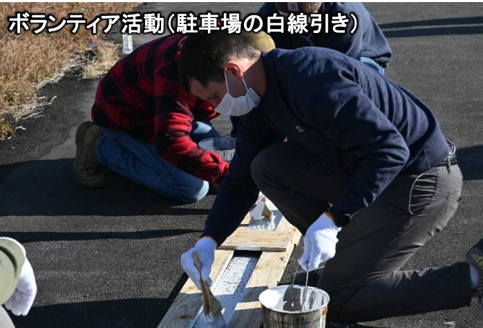
ボランティア活動(駐車場の白線引き)