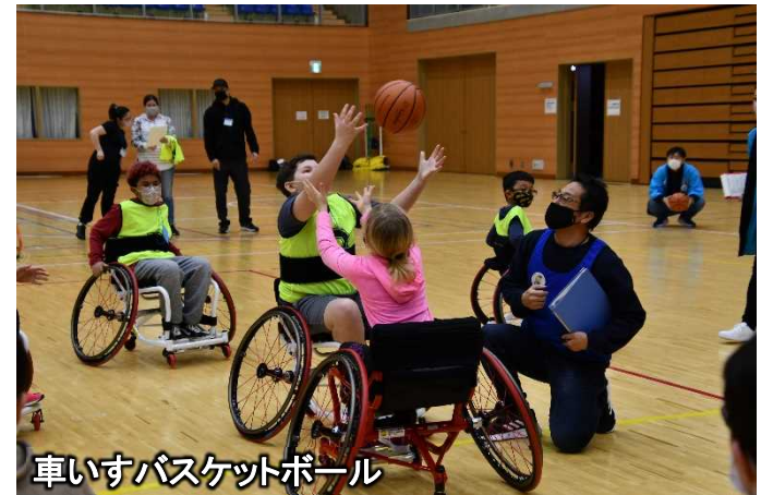
車いすバスケットボール