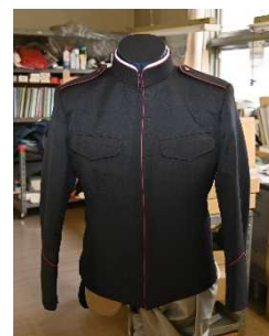
左: 高等工科学校 制服