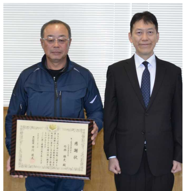
竹林猿ヶ森漁業協同組合長(左)