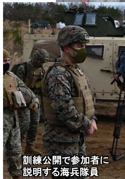
訓練公開で参加者に説明する海兵隊員