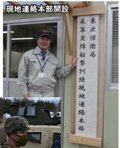
現地連絡本部開設