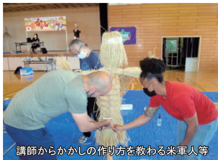
講師からかかしの作り方を教わる米軍人等

金賞に輝いた作品名「ユーシン」を制作したチーム「車力ボーイズ」の児童からは、「米軍の人達と直接会うことはできなかったが、協力して作ったかかしが、金賞になってうれしい」と喜びの声があがっていました。