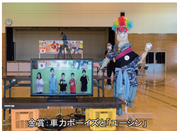
金賞：車力ボーイズと「ユーシン」