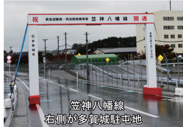
笠神八幡線 右側が多賀城駐屯地