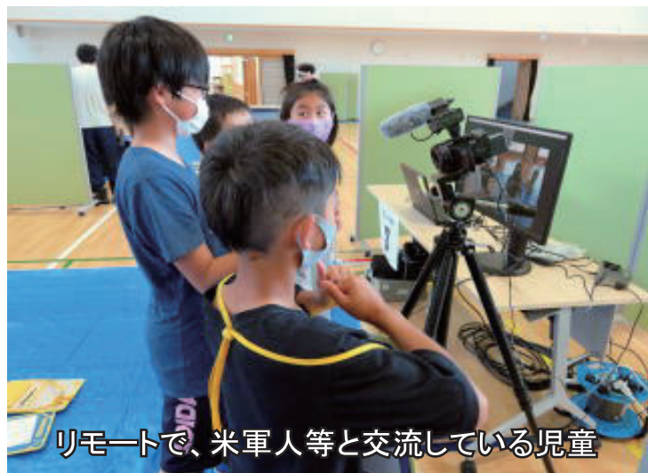
リモートで、米軍人等と交流している児童

参加者たちは、「仲良く協力して作れたので、とても楽しかった」(児童)や「子供ならではのユニークな発想があり、学ぶことが出来た」(米軍人等)と笑顔で話していました。