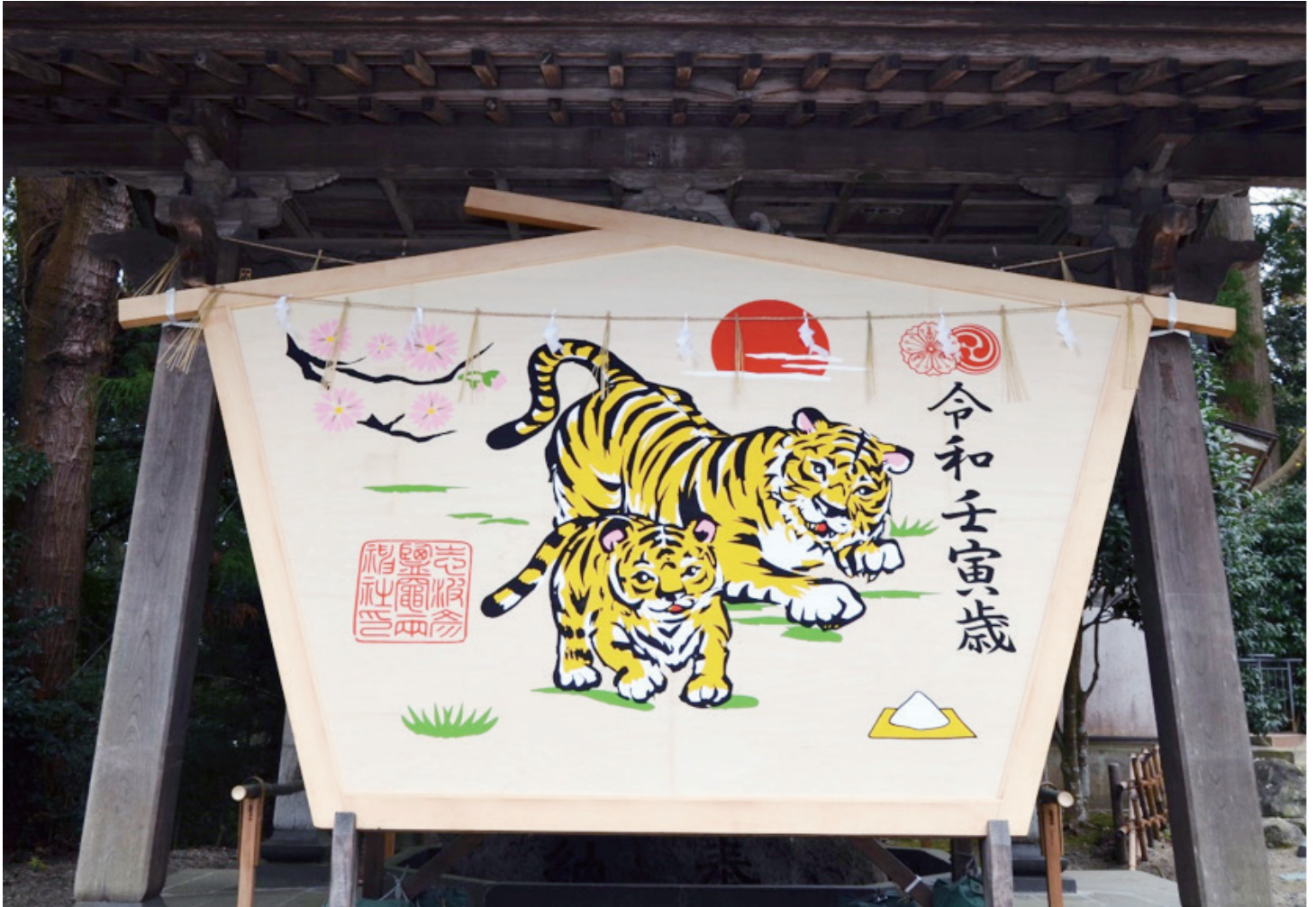
しおがま しおがま 鹽竈神社(宮城県塩竈市)

干支である寅の親子のほか、縁起物である「盛り塩」や境内にある 国の天然記念物「鹽竈桜」が描かれています。