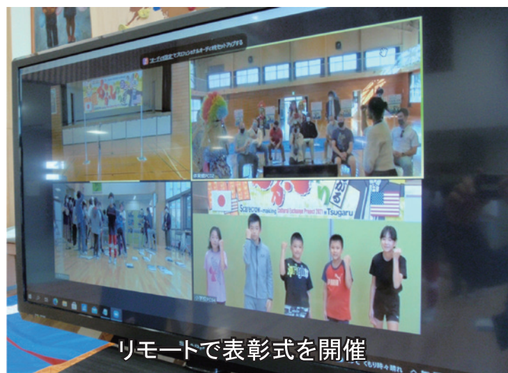
リモートで表彰式を開催