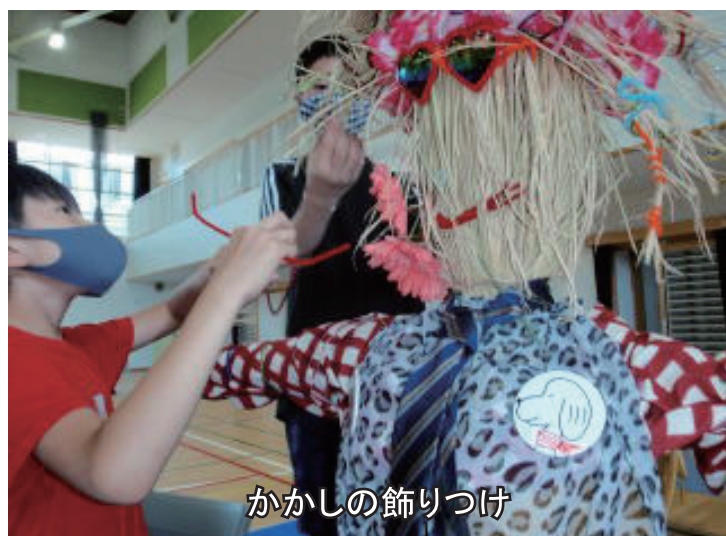
かかしの飾りつけ