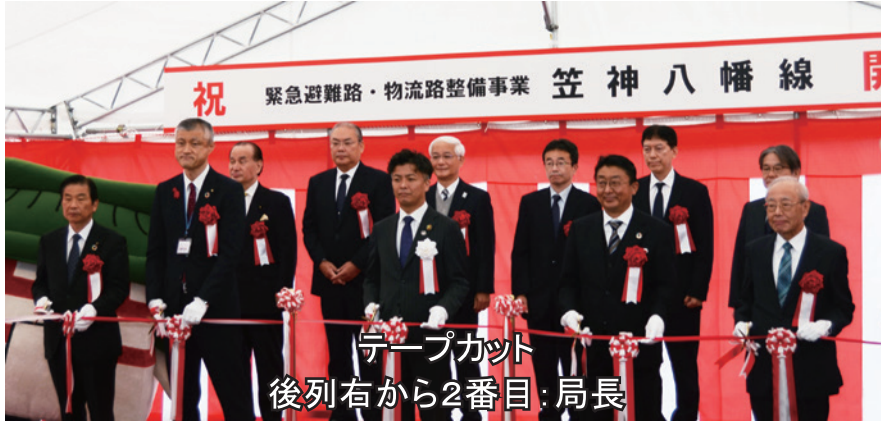
テープカット 後列右から2番目:局長

道路整備に際し、同市から道路用地として駐屯地敷地の一部割譲要望があり、同市道の重要性を考慮し、関係機関との調整を進め、道路敷地として必要な約1.2haの土地割譲の事務手続きを行いました。