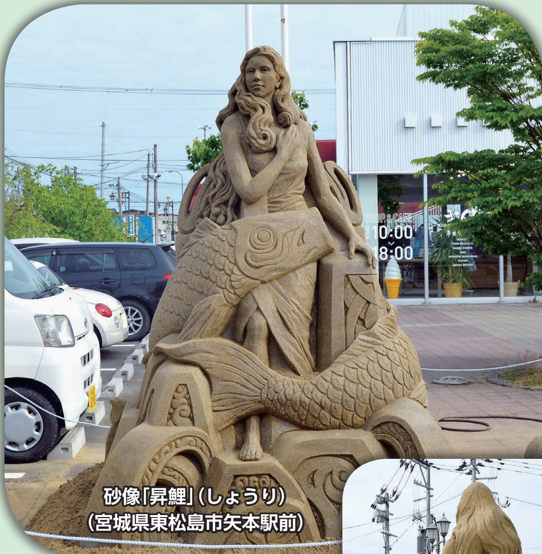
砂像「昇鯉」(しょうり) (宮城県東松島市矢本駅前)