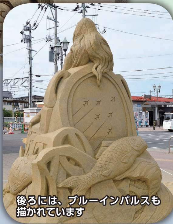
後ろには、ブルーインパルスも描かれています