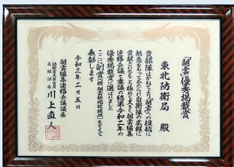
「表彰状」と記念品「盾」

朝雲新聞社では、毎年「朝雲」に掲載された部隊や機関などからの優れた投稿記事や写真を表彰する「朝雲賞」を実施しています。「記事賞」「写真賞」「個人投稿賞」「掲載賞」の4部門があり、昨年(2020年1月～12月)、朝雲新聞への掲載が最も多かった「掲載賞」の地方防衛局部門で、東北防衛局が5年連続の「優秀掲載賞」を受賞しました。昨年1年間で、当局投稿記事が11件掲載されました。