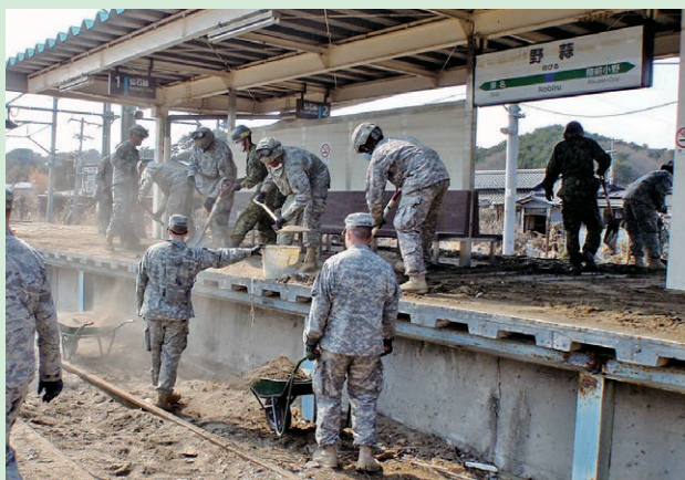
上：トモダチ作戦 「ソウルトレイン」(JR仙石線旧野蒜駅)

活動には、陸・海・空・海兵隊から最大2万人以上、艦船約20隻、航空機約160機が参加、支援物資の輸送、仙台空港の復旧、JR仙石線のがれき撤去や行方不明者の集中捜索等が行われました。