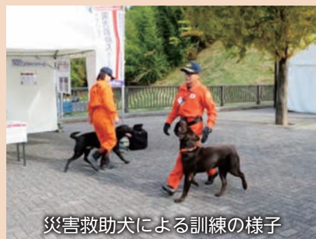
災害救助犬による訓練の様子

東北防衛局は、各種防災訓練参観等を通じ、災害などの緊急事態発生時への迅速かつ的確な対応のため、引き続き各関係機関との連携強化を図ります。