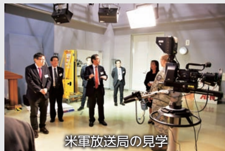
米軍放送局の見学