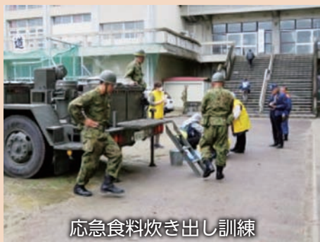
応急食料炊き出し訓練