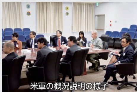
米軍の概況説明の様子