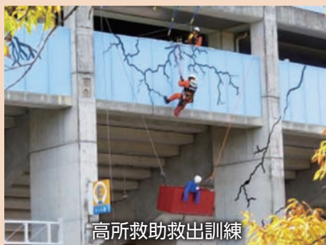
高所救助救出訓練