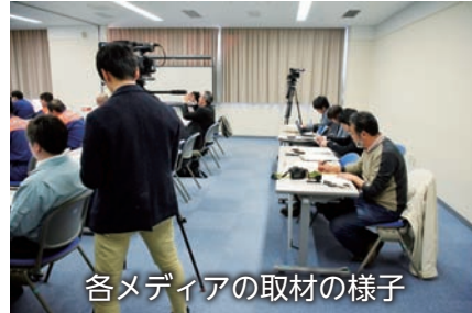
各メディアの取材の様子