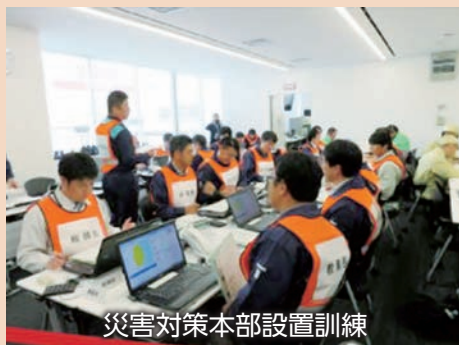
災害対策本部設置訓練