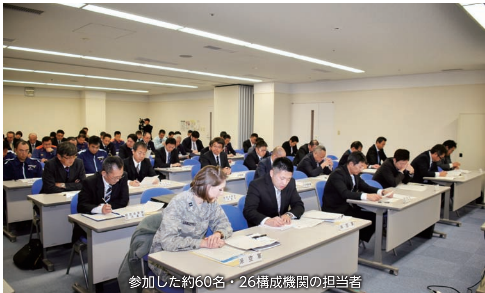
参加した約60名・26構成機関の担当者

特に、今回は平成30年2月に発生した小川原湖（青森県東北町）への米軍F-16戦闘機タンク投棄事案以後初の開催であったため、多くの新聞、テレビメディアが本協議会取材しました。