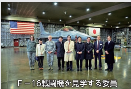
F-16戦闘機を見学する委員