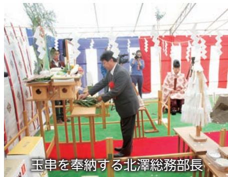
玉串を奉納する北澤総務部長