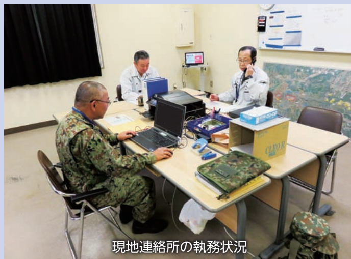
現地連絡所の執務状況

東北防衛局は、周辺住民の不安解消等を図るため、10月3日から10日までの間、「日英共同訓練現地連絡所」を王城寺原演習場内に設置し、関係自治体等に対し日々の訓練情報等の提供を実施しました。