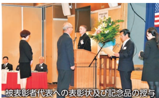
被表彰者代表への表彰状及び記念品の授与