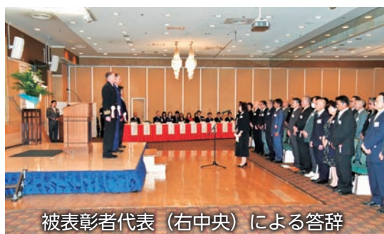
被表彰者代表（右中央）による答辞