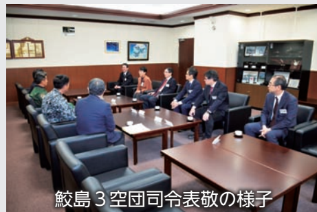
鮫島3空団司令表敬の様子