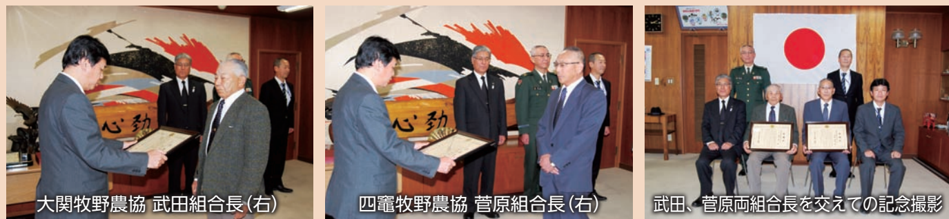
大関牧野農協 武田組合長(右)