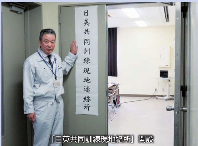
「日英共同訓練現地連絡所」開設

陸上自衛隊は富士教導団偵察教導隊基幹の約60名が、イギリス陸軍は第1情報・監視・偵察旅団名誉砲兵隊基幹の約50名が参加しました。