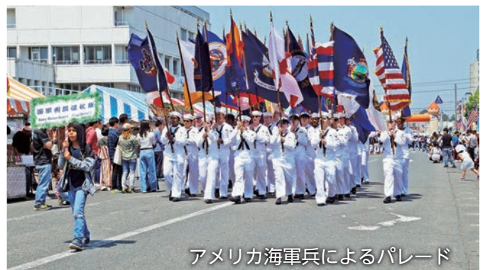
アメリカ海軍兵によるパレード