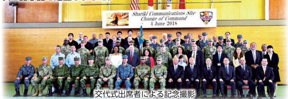
交代式出席者による記念撮影