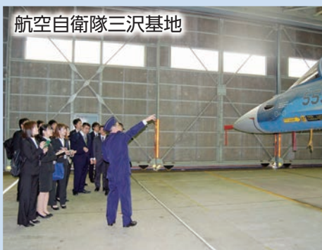
航空自衛隊三沢基地