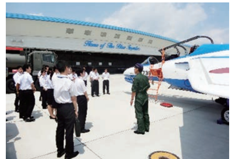
△過去の現場見学会