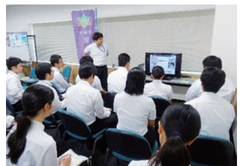
△過去の官庁合同業務説明会

日時：平成30年8月22日(水) ※官庁訪問の受付予約は8月6日(月) 14時からです。 場所：仙台第3合同庁舎(仙台市宮城野区五輪1-3-15)