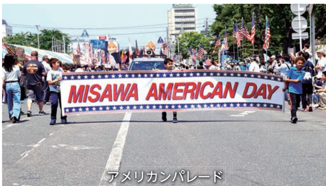
アメリカンパレード

平成30年6月3日(日)、平成元年の開催以来、今年で30周年の記念となる「三沢アメリカンデー2018」が開催されました。三沢市中心部や米軍三沢基地内の一部を開放し、アメリカンパレードやハーレーなど大型バイク約200台の行進が行われ、約8万人が来場するなど大盛況なイベントとなりました。