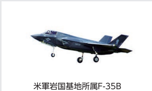
米軍岩国基地所属F-35B

今回の訓練移転には、米軍岩国飛行場からF-35Bが初めて参加し、航空自衛隊三沢基地に今年配備されたF-35Aも初めて参加しました。