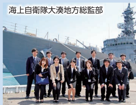
海上自衛隊大湊地方総監部