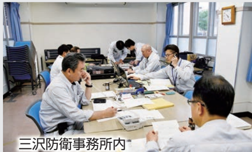
三沢防衛事務所内