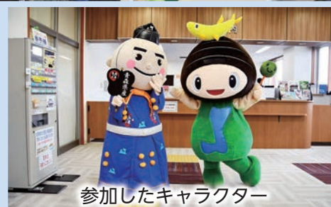
参加したキャラクター