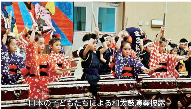
日本の子どもたちによる和太鼓演奏披露

平成30年4月14日(土)、第31回「三沢ジャパンデー2018」が米軍三沢基地統合クラブで開催されました。今回は、「文化は違って一つのコミュニティ」をテーマに、県内外の協力団体やボランティアが日本の伝統文化や芸能を紹介するブースなどを開設し、基地内の米国人らに日本文化の素晴らしさを伝えました。