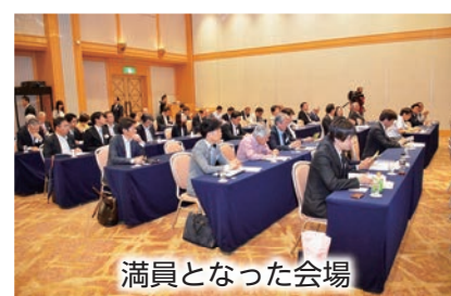
満員となった会場