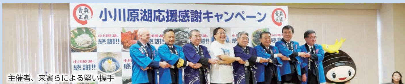
主催者、来賓らによる堅い握手

これは、今年2月20日に発生した小川原湖への米軍機燃料タンク投棄事故によりその後約一ヶ月間の禁漁期間があり、期間中心配をしてくださった消費者の方々の応援への感謝のための開催でした。