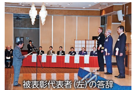
被表彰代表者(左)の答辞