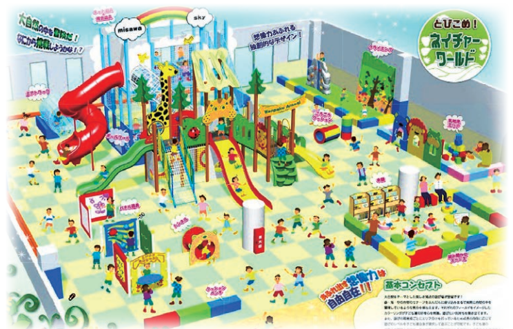
「(仮称)子ども館」遊戯室イメージ