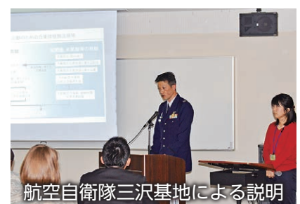
航空自衛隊三沢基地による説明