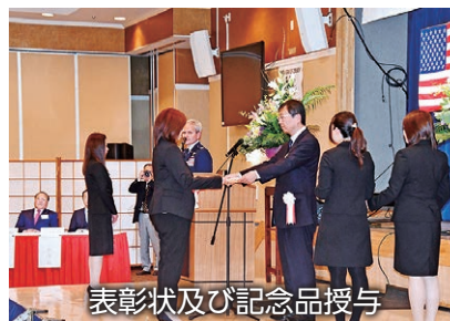
表彰状及び記念品授与