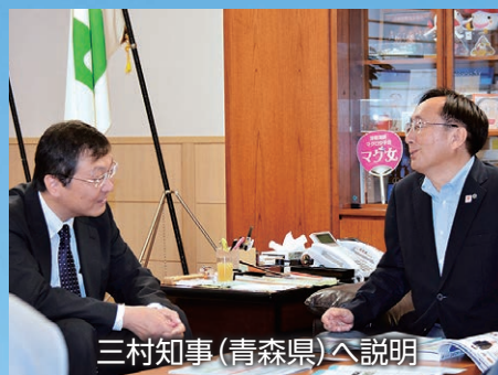
三村知事（青森県）へ説明