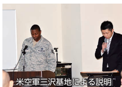
米空軍三沢基地による説明