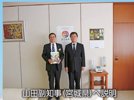
山田副知事（宮城県）へ説明