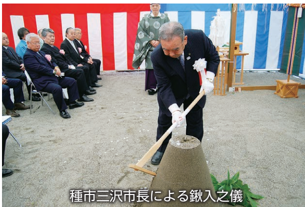
種市三沢市長による鍬入之儀

平成29年10月17日、平成31年4月のオープンを目指す、三沢市「(仮称)子ども館」建設安全祈願祭が行われました。