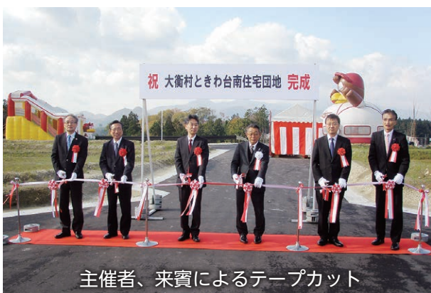
主催者、来賓によるテープカット

平成29年11月5日、宮城県大衡村において、「ときわ台南住宅団地」完成記念式典が行われました。