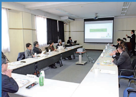
東北防衛局概況説明の様子

平成29年11月15日、平成29年度東北防衛施設地方審議会を、航空自衛隊松島基地（宮城県東松島市）において開催しました。