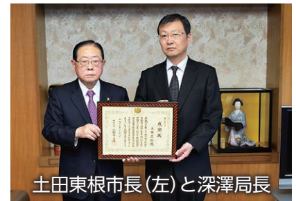
土田東根市長(左)と深澤局長

我が国の防衛と自衛隊任務の重要性について深く認識され、永年にわたり防衛施設の安定運用と防衛基盤の育成に貢献されたとして、土田正剛東根市長（山形県）に対し、防衛大臣感謝状を深澤雅貴東北防衛局長より贈呈しました。