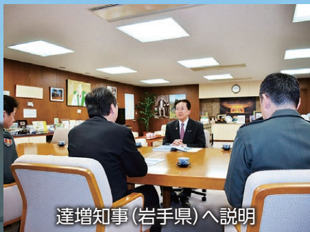
達増知事（岩手県）へ説明