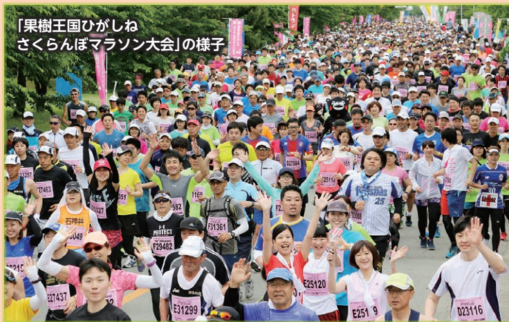
「果樹王国ひがしね さくらんぼマラソン大会」の様子

は、地理的表示(GI)保護制度に神戸ビーフや夕張メロンなどとともに「東根さくらんぼ」として登録されており、全国の皆さんに喜ばれています。さらに本市は、陸上自衛隊神町駐屯地の皆さんに多くの場面でご協力いただき、駐屯地が所在するまちとしての特色を生かした魅力あるまちづくりに取り組んでいます。なかでも、「果樹王国ひがしね さくらんぼマラソン大会」は、隊員の皆さんに会場となる駐屯地内をきれいに整備していただき、毎回、定員いっぱい12,000人ものランナーがさくらんぼロードを駆け抜ける、東北で最大規模の人気の大会となりました。