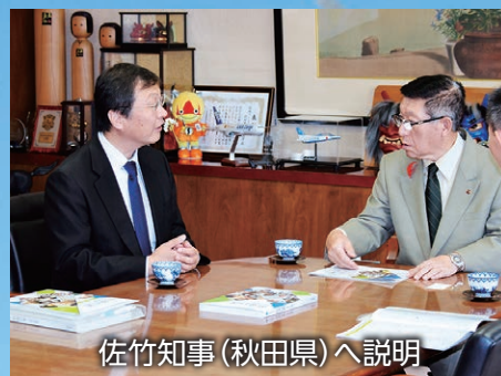
佐竹知事（秋田県）へ説明