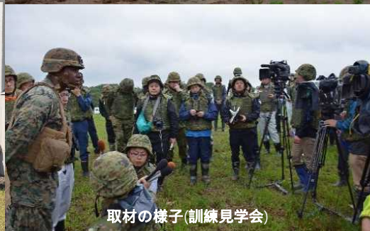
取材の様子(訓練見学会)