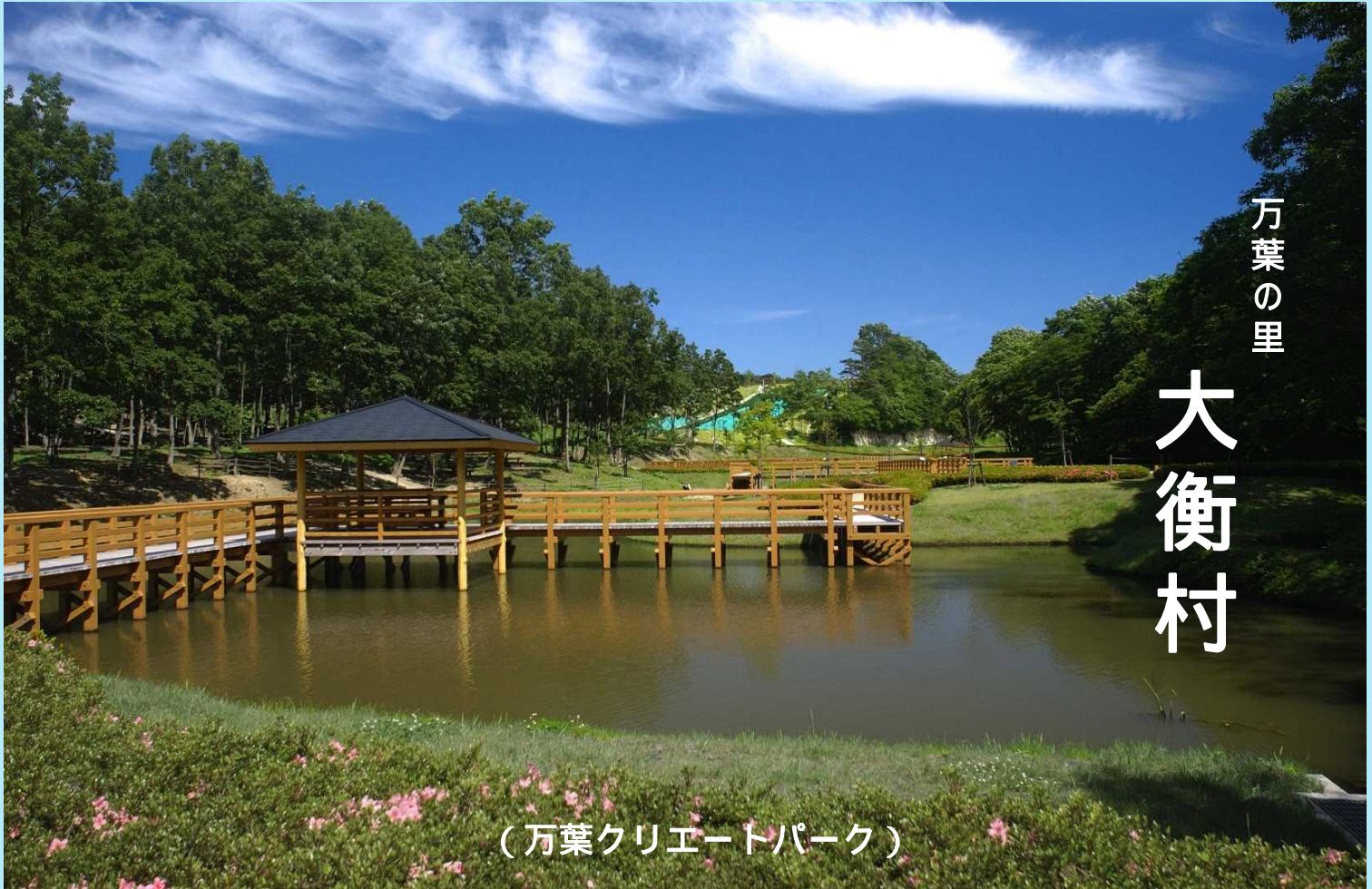
(万葉クリエートパーク)

大衡村は、宮城県のほぼ中心に位置し、中央部に国道4号、東部に東北自動車道大衡インターチェンジ、総面積の約20%を占める北西部一帯は、陸上自衛隊の王城寺原演習場として利用されています。