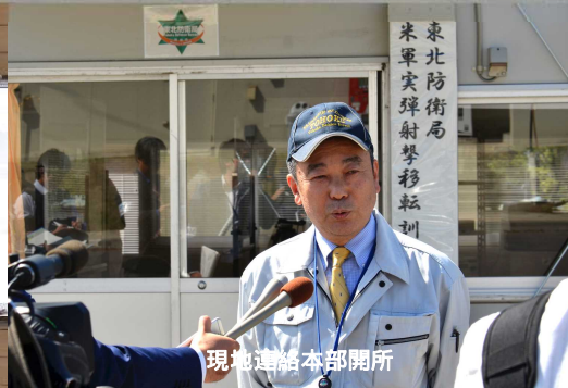
東北防衛局 実弾射撃移転訓練 現地連絡本部開所