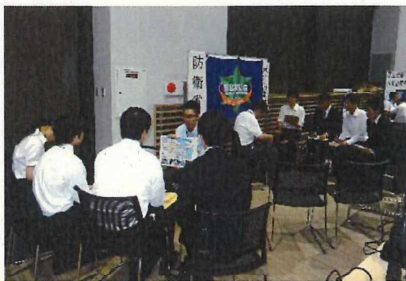
△昨年度官庁合同業務説明会