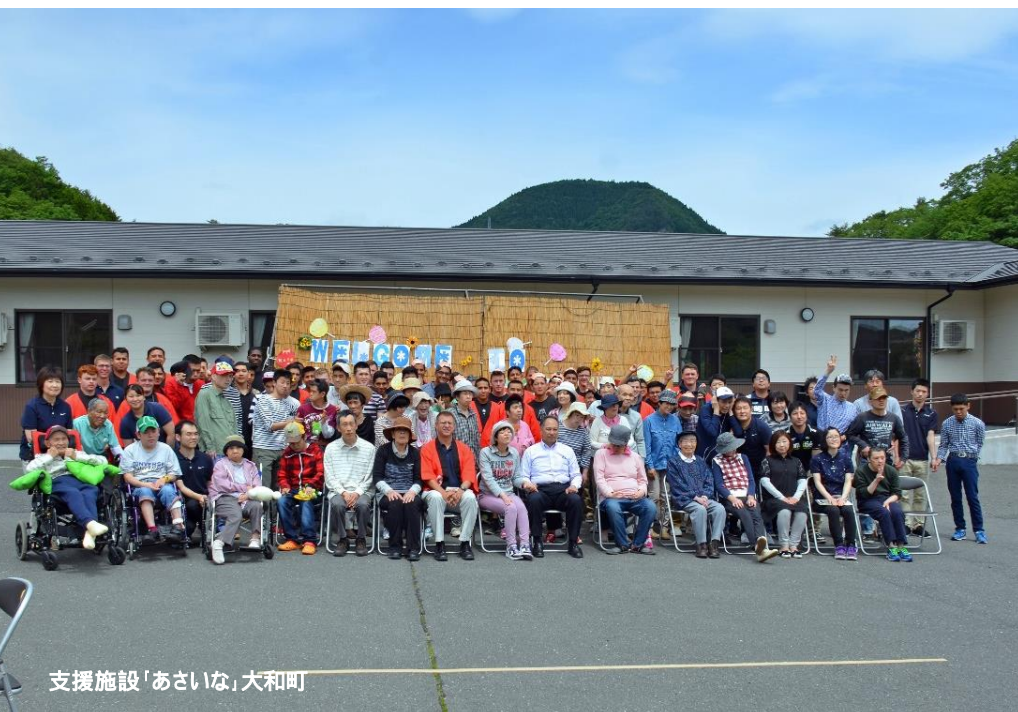
支援施設「あさいな」大和町