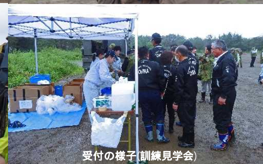
受付の様子(訓練見学会)