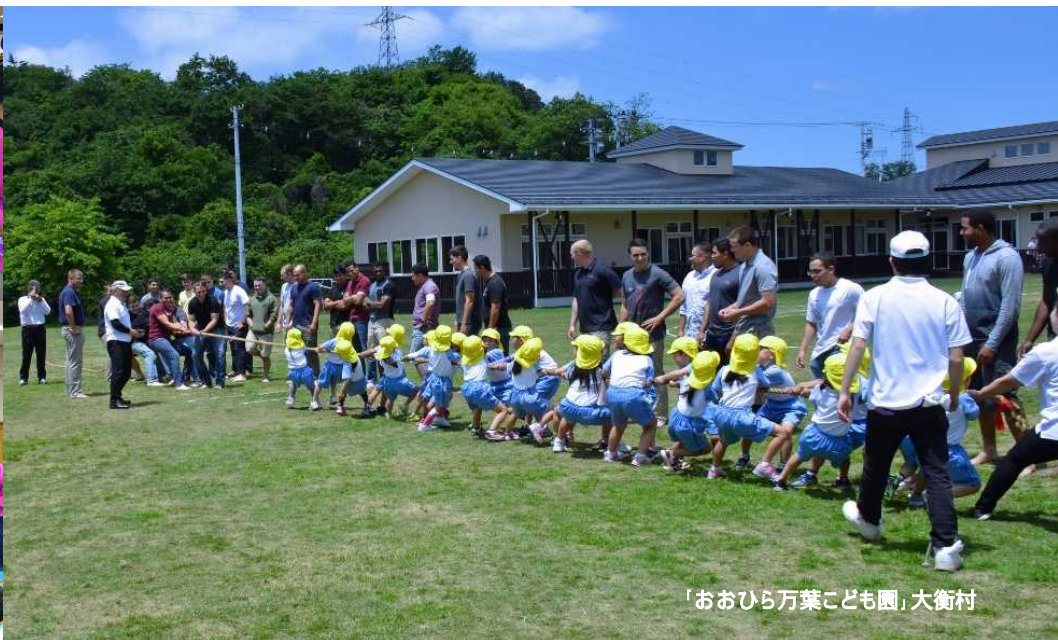
「おおひら万葉こども園」大衡村