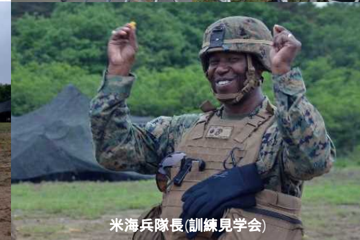
米海兵隊長(訓練見学会)