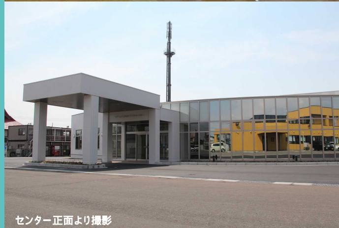
センター正面より撮影