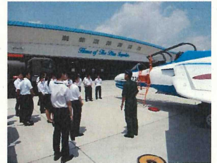
△過去の現場見学の様子