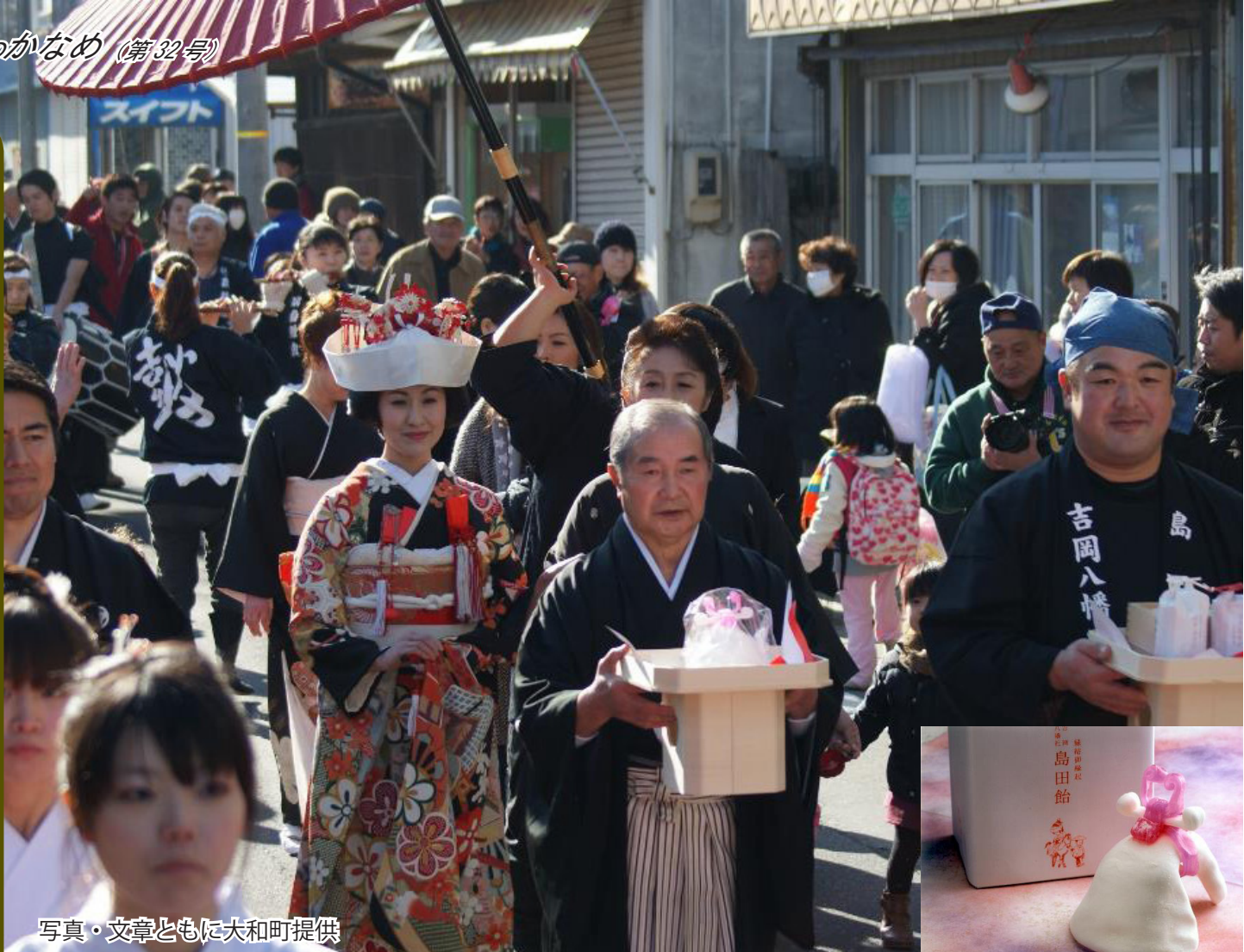
写真・文章ともに大和町提供