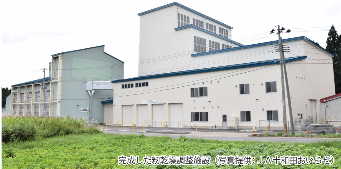
完成した粃乾燥調整施設

9月11日、東北町の小川原 こがわら ライスセンターにおいて、東北防衛局補助事業により設置した粃乾燥調整施設の竣工式が開催されました。