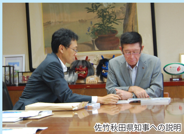
佐竹秋田県知事への説明

平成27年版防衛白書の説明は、8月17日の青森県八戸市長から始まり、みなさまの自治体にもお伺いします。