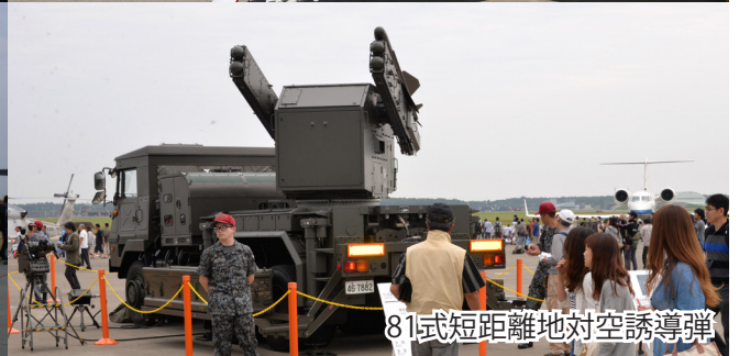
81式短距離地对空誘導弾