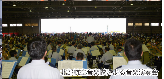
北部航空音楽隊による音楽演奏会