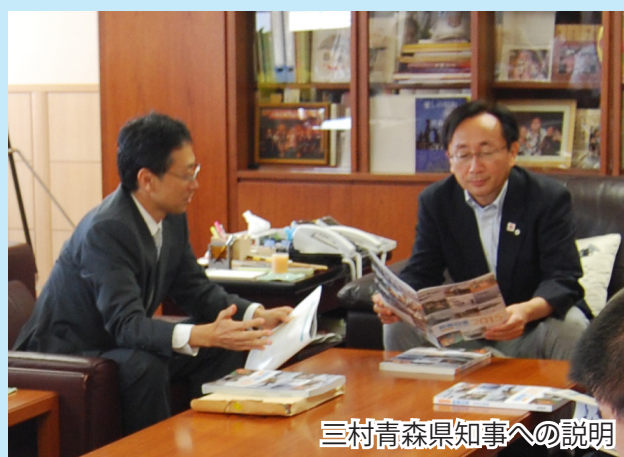
三村青森県知事への説明