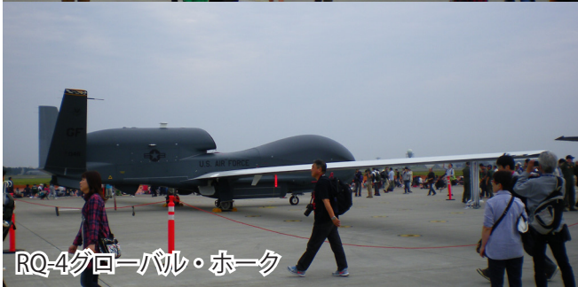
Q-4グローバル・ホーク