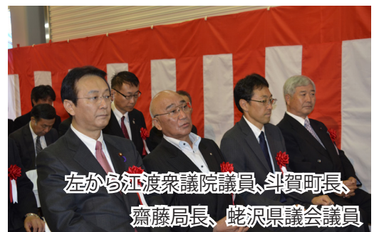
左から江渡衆議院議員、斗賀町長、齋藤局長、蛇沢県議会議員

竣工式には、施主である竹ヶ原幸光十和田おいらせ農業協同代表理事組合長をはじめ、斗賀壽一東北町長、江渡聡徳衆議院議員、蛇沢正勝青森県議会議員、齋藤雅一東北防衛局長など多数の方々が出席し、竹ヶ原組合長からは、「十和田おいらせ農協ではじめての防衛省補助事業で、念願の施設が完成しました。稲作経営を軸に地域農業の発展に努力してまいります。」と式辞が述べられ、齋藤局長からは、「本施設の重要性を深く認識するとともに、防衛施設の円滑な運用と周辺地域の農業経営の安定化を図るべく、今後とも皆様の生活