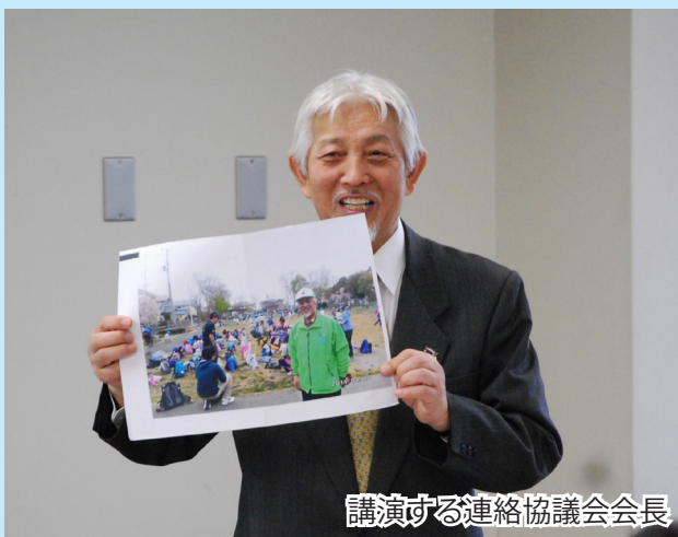
講演する連絡協議会会長

東北防衛局では、多方面の分野で活躍される識者を講師としてお招きし、職員向けの講演会を開催しています。