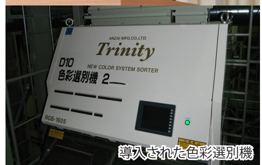
導入された色彩選別機

今後とも皆様の生活の安定及び福祉の向上に寄与するよう、積極的に取り組んで参る所存であります。」と祝辞が述べられました。