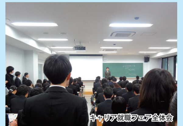
キャリア就職フェア全体会