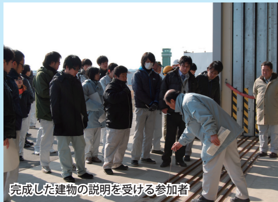
完成した建物の説明を受ける参加者

東北防衛局では、今後もこのような研修を定期的で開催し、若手職員の技術向上を図ります。