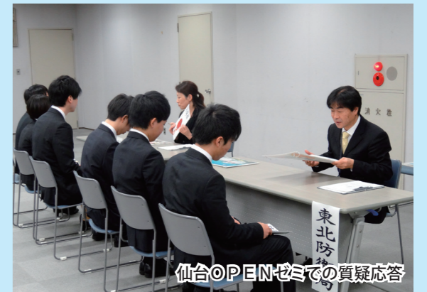
仙台OPENゼミでの質疑応答

平成27年度国家公務員採用試験等の日程は以下のとおりです。多数の応募をお待ちしております。