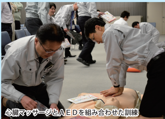
心臓マッサージとAEDを組み合わせた訓練