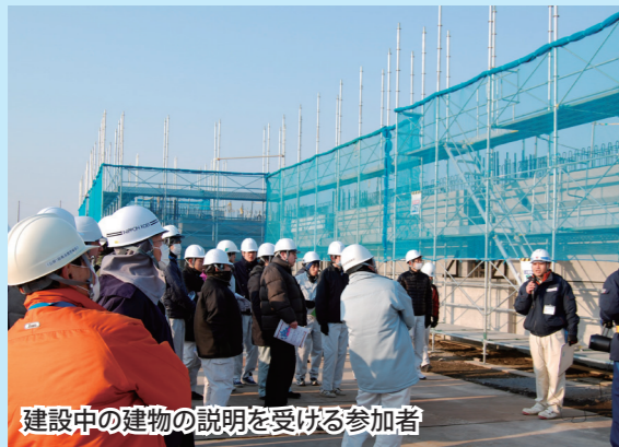
建設中の建物の説明を受ける参加者