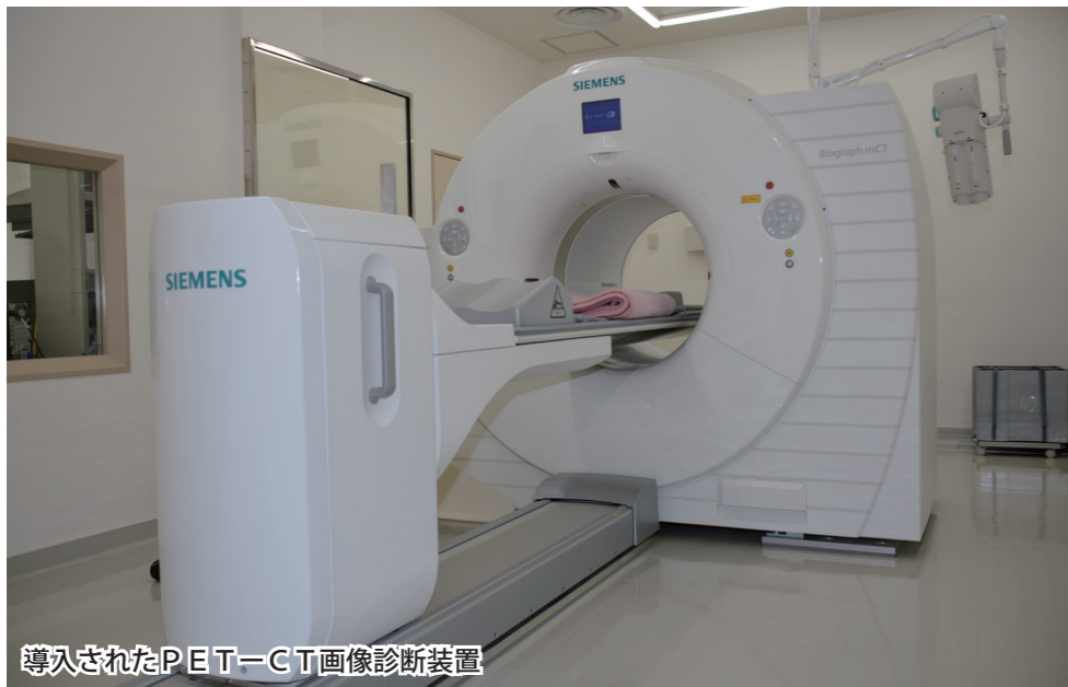
導入されたPET-CT画像診断装置

東北防衛局では、今後とも、基地の安定的な運用に向け、地元の皆様への生活の安定及び福祉の向上に一層取り組んで参ります。