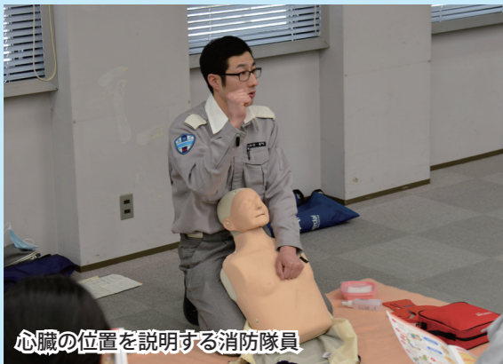
心臓の位置を説明する消防隊員