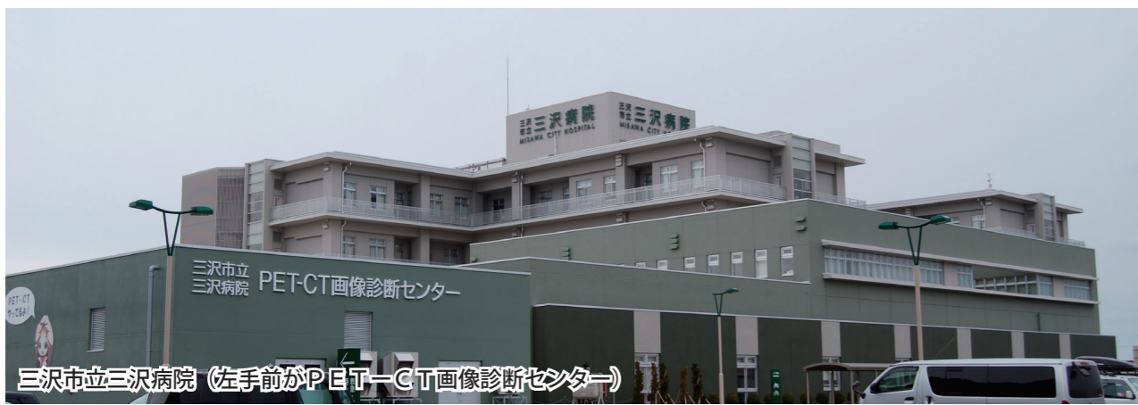
三沢市立三沢病院（左手前がPET-CT画像診断センター）