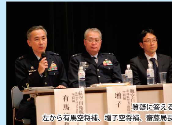
左から有馬空将補、増子空将補、齋藤局長 質疑に答える