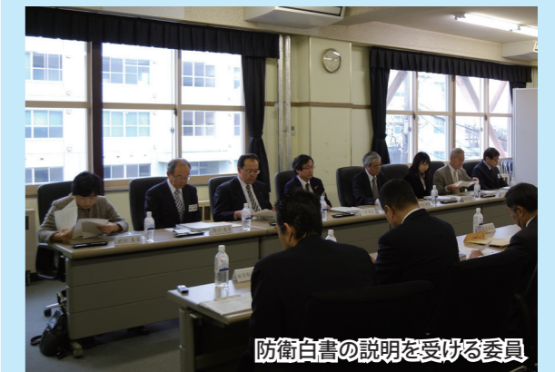
防衛白書の説明を受ける委員

当日は、会長をはじめ各委員は、同基地の隊員等に対し熱心に質問されるなど、自衛隊施設や自衛隊の活動等に対する知見をなお一層広めておりました。