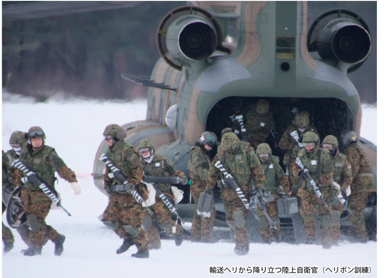
輸送ヘリから降り立つ陸上自衛官（ヘリボン訓練）

日米共同訓練「フォレスト・ライト2」が1月28日から2月8日までの12日間、岩手山演習場（岩手県滝沢市及び八幡平市）及び岩手駐屯地（岩手県滝沢市）で実施され、日本側からは陸上自衛隊第9師団第21普通科連隊（秋田）等から約250名、米側からは第3海兵師団第4海兵連隊第1大隊（沖縄）等から約270名が参加しました。