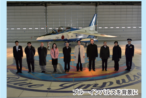
ブルーインパルスを背景に