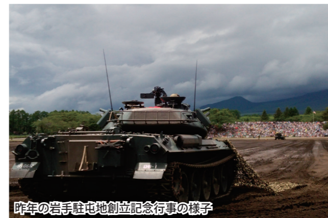
今年の岩手駐屯地創立記念行事の様子

※事前の申し込み、入場整理券等が必要なイベントもありますので、お出かけの前に問い合わせ先にご確認ください。