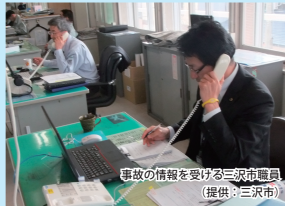
事故の情報を受ける三沢市職員

今年度において、同種訓練は3回目となりますが、東北防衛局としては、今回の訓練成果を今後の通報訓練等に活かすとともに、関係機関の参加を呼びかけていくなど、米軍航空機事故が発生した場合の対応に遺漏なきよう、職員の練度の維持及び向上に積極的に取り組んで参りたいと考えております。