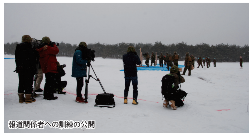
報道関係者への訓練の公開

この訓練は、日米の部隊が、それぞれの指揮系統に従い、共同して作戦を実施する場合における連携要領を実行動により訓練し、相互運用性の向上を図ることを目的とし、戦闘射撃訓練、ヘリボン訓練、市街地戦闘訓練等を行いました。共同訓練の期間中においては、1月30日、31日の両日に報道関係者及び自治体関係者等を対象に訓練の全般説明及び訓練の公開が行われました。