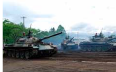
△ 岩手山中演習場に配備されている74式戦車