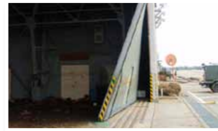
△ 津波により被害を受けた大扉

そのため、東北防衛局は、震災直後の3月末、同基地の復旧工事（建築、土木、電気、機械及び通信の各工事）を発注しました。当時、まだまだ混乱が続く中であって、大豊建設（株）東北支店他4社が請け負いました。