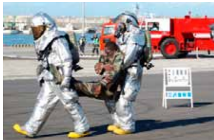
△ 事故機搭乗員救出作業

平成24年10月5日、当局は青森県三沢市の三沢漁港地区において実施された、日米ガイドラインに基づく実動訓練に参加しました。 日米合同での実動訓練は二度目で、今回の訓練では、飛行中の米軍所属のヘリコプターが、機体の異常により三沢漁港に緊急着陸する際、落下した部品が停泊していた漁船を直撃し、船員は海に投げ出され船は沈没、更には、ヘリコプター搭乗員が脱出した直後に炎上したとの想定の下、110番通報等により事故発生を認知した日米当局が連携し、「日米ガイドライン」に基づいた初動活動での役割を確認しました。 今回の訓練では、警察・米軍憲兵隊による現場周辺への立ち入り規制、消火隊による発煙筒を焚いた乗用車を事故機に見立てた、消火活動及び搭乗員や巻き添えになり負傷した住民等の応急措置、ま