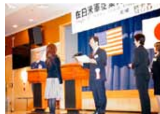
△ 表彰された永年勤続者