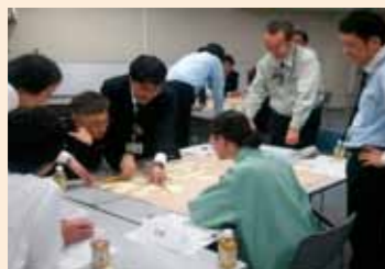
△ 係長クラスの討議の様子

東北防衛局では、職場環境を良くするための意見交換会として、これまで係員クラスの自由な話し合いや、係長クラスの討議等を行っています。