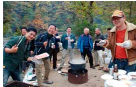
△ 広瀬川の河原での芋煮会

て付き合いの少ない職員同士や、若手職員と幹部職員との間の良いコミュニケーションの場となりました。