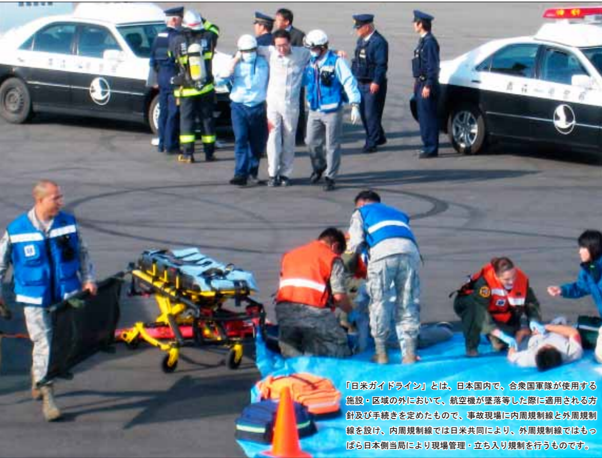
「日米ガイドライン」とは、日本国内で、合衆国軍隊が使用する施設・区域の外において、航空機が墜落等した際に適用される方針及び手続きを定めたもので、事故現場に内周規制線と外周規制線を設け、内周規制線では日米共同により、外周規制線ではもっぱら日本側当局により現場管理・立ち入り規制を行うものです。