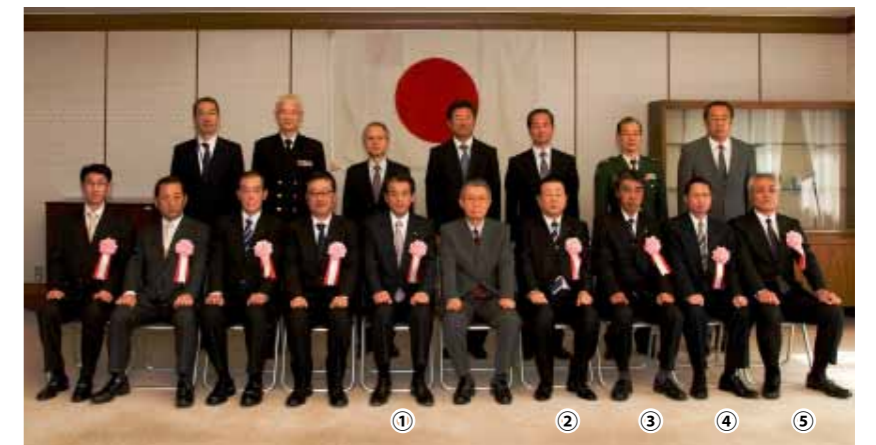
△ 装備施設本部長感謝状受賞者