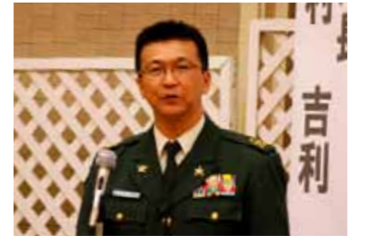
△ 笹木自衛隊宮城地方協力本部長