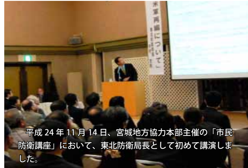
平成24年11月14日、宮城地方協力本部主催の「市民防衛講座」において、東北防衛局長として初めて講演しました。