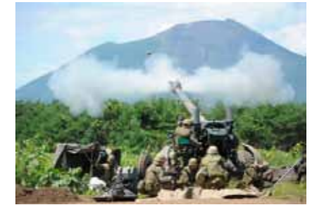
△ 岩手山中演習場の砲撃訓練

防衛省は、演習場での頻繁な射撃訓練によって生じる砲撃音騒音障害について、その障害を防止、軽減するために住宅防音工事を実施しています。今回は、砲撃音に係る住宅防音事業について特集しました。