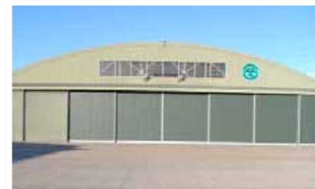
△ 復旧工事完了後の救難格納庫