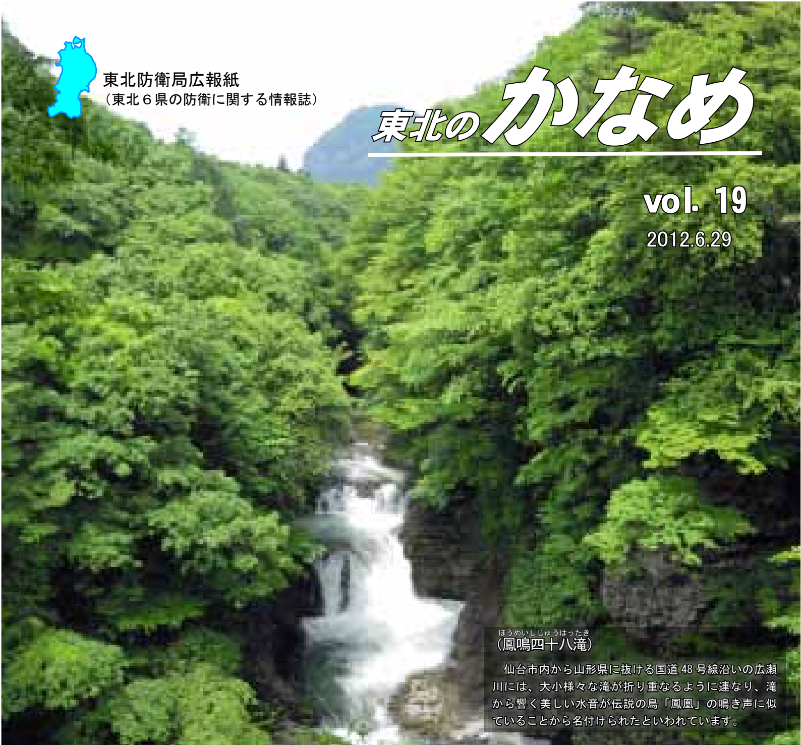
ほうめいしじゅうはったき (鳳鳴四十八滝)

仙台市内から山形県に抜ける国道48号線沿いの広瀬川には、大小様々な滝が折り重なるように連なり、滝から響く美しい水音が伝説の鳥「鳳凰」の鳴き声に似ていることから名付けられたといわれています。