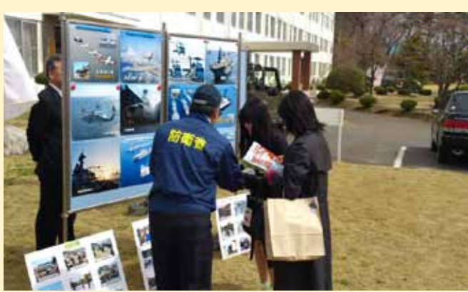
△ 船岡駐屯地(宮城県柴田町)