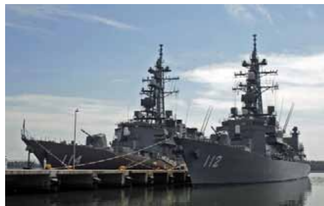
△ 護衛艦すずなみ(左) 護衛艦まきなみ(右)