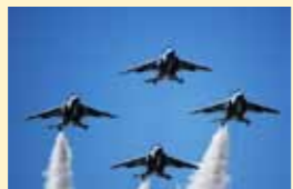
△ 配布しているポストカード(イメージ)