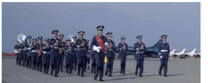
△ 三沢基地航空祭(青森県三沢市)

本音楽隊が配置される三沢基地は米軍と共用していることもあり、三沢アメリカンデーや三沢基地航空祭など国際色豊かな場における演奏会のほか、防衛省の儀式等及び自治体からの広報演奏を任務とする音楽隊です。