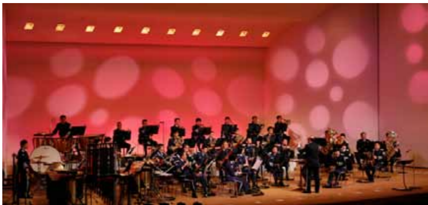
△ クリスマスコンサート(北海道千歳市)

航空自衛隊北部航空音楽隊は、昭和51年、青森県三沢市に所在する航空自衛隊三沢基地において、北部航空方面隊の直轄部隊として発足し、現在、約40名の隊員が所属しています。 主な活動範囲は、北東北3県（青森・秋田・岩手）及び北海道全域で、特に、