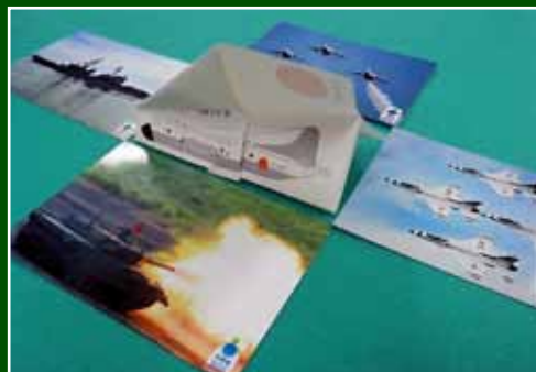
東北防衛局オリジナルグッズ