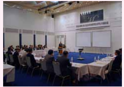
危機管理担当者連絡会議