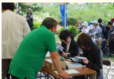
マンガ防衛白書で防衛政策を説明する職員