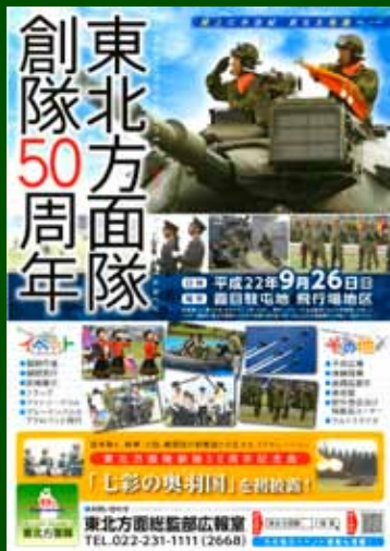
写真：昨年度の創隊記念行事の様子

9月26日(日)、宮城県仙台市若林区にある陸上自衛隊霞目駐屯地飛行場地区において今年創隊50周年を迎える東北方面隊の記念行事が開催されます。 陸上自衛隊東北方面隊は昭和35年1月に創設され、管内に第6師団(山形県東根市)、第9師団(青森県青森市)の2個師団を有し、その隷下に13の駐屯地などを配置し、地域における防衛のほか災害派遣などを実施しています。 記念行事では、式典、観閲行進、訓練展示などのほか戦車の体験搭乗やブルーインパルスの展示飛行が予定されており、当日は東北方面隊創隊50周年記念曲「七彩の奥羽国」が初披露されます。 また、開催前の24・25日には、仙台サンプラザホールにて東北方面音楽隊による音楽フェスティバルも開催されます。