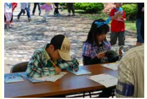
マンガ防衛白書読書コーナー