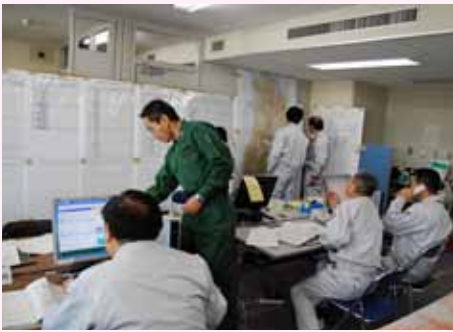
東北防衛局震災対処訓練

最近では、平成22年2月のチリ沖地震による津波が東北地方に到着した際、管内に被害が発生していないか情報収集を行いました。また、平成20年6月に発生した岩手・宮城内陸地震の際は、局職員を現地に派遣し、被災建物の解体にあたる自衛隊の部隊に対し技術的支援を行うなどの活動も実施しています。