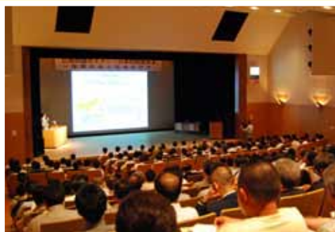
防衛問題セミナー