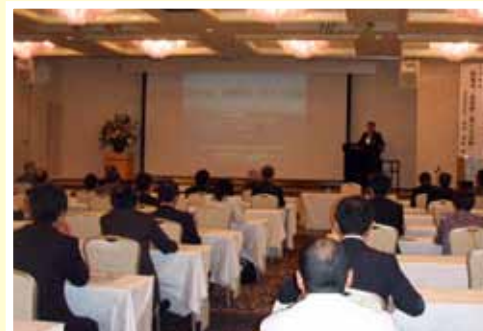
防衛政策の講演（講師派遣）