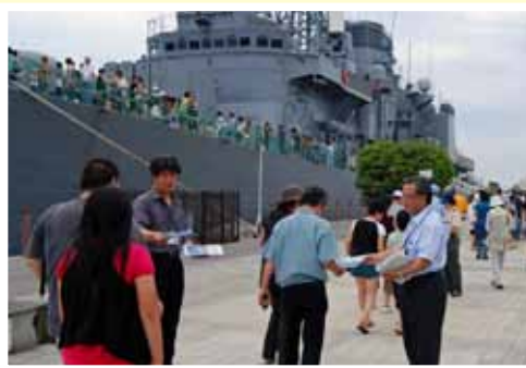
政策パンフレットの配布

8月は、4日の青森港の艦艇広報、22日の松島基地航空祭で、「青い腕章」を着用し、「青いのぼり」を立てて活動しておりますので、お気軽にお声掛け・お立ち寄りください。