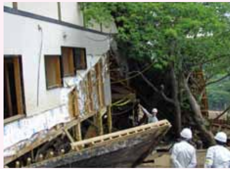
岩手・宮城内陸地震への技術支援活動