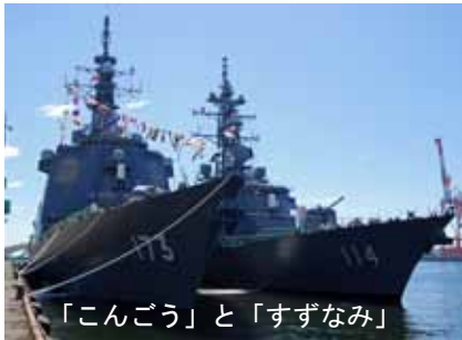
「こんごう」と「すずなみ」

7月24日、25日の両日宮城地方協力本部のイベントである「自衛艦 in 仙台港」のため海上自衛隊「こんごう」と「すずなみ」が、また日米友好親善のため米海軍「ラッセル」が寄港し、一般公開されました。