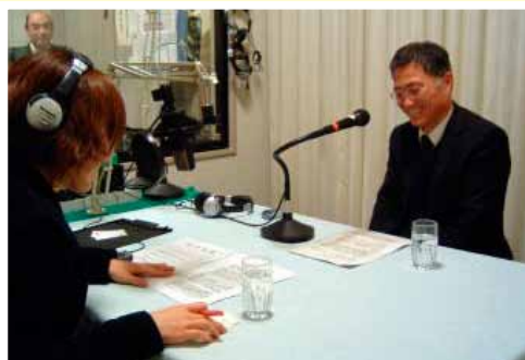
FMラジオでの収録状況

また、東北各地へ出掛け、防衛問題セミナーや防衛政策の講演など様々な政策広報活動も行っております。