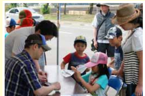
紙飛行機教室で子供たちに折り方を指導する職員