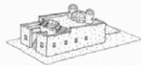
イーハトーブ火山局 (イメージ図)