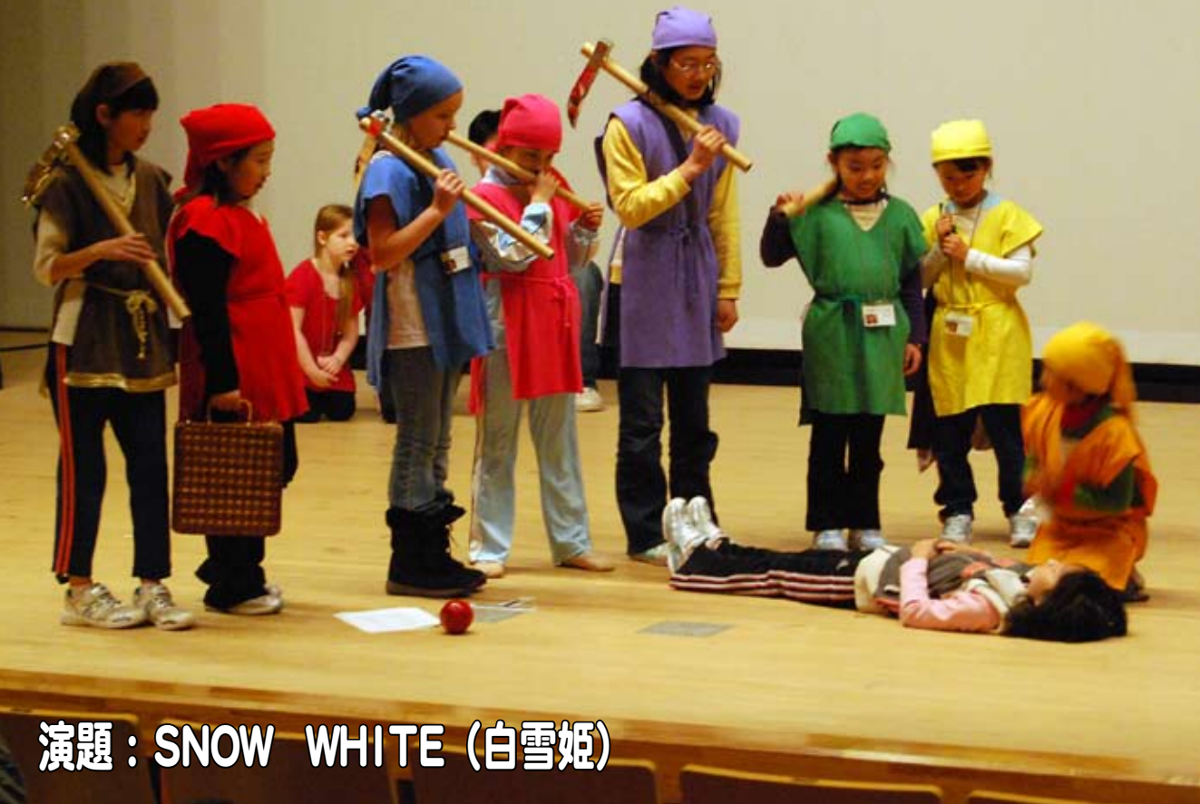
演題：SNOW WHITE (白雪姫)