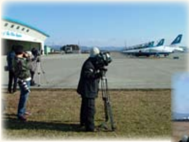
松島航空基地 1/6 ブルーインパルスは今年 発足から50周年を迎えま す。