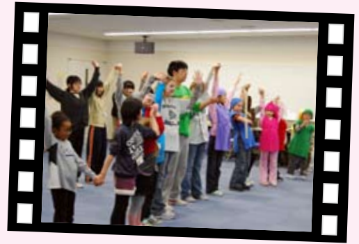
1/16 みんなでわきあいあいと