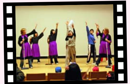
1/17 練習の成果もあり、さまになってきました

1月9日から、東北防衛局主催日米交流事業「英語音楽劇」(白雪姫)の今年の初稽古が三沢市国際交流教育センターで始まりました。 日米親善の一環として企画されたこの催しは、2月28日16:30から国際交流教育センターで開演されるもので米軍三沢基地の学生10名と日本側からは幼稚園児から高校生までの25名計35名が参加しています。 稽古は、プロの指導の下、昨年11月28日から正月休みを挟み、ほぼ毎週土日に実施されており、本番に向けて、真剣に稽古に取り組んでいきます。 最初はぎこちなかった参加者も今ではみんな仲良く練習しています。 そんな子供たちの練習の成果をぜひ見に来てください。 また、当日は15:00から食文化交流も行われ日米自慢の料理が紹介されます。