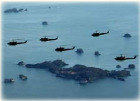
東北方面隊 1/7 編隊飛行訓練 松島湾上空を飛行