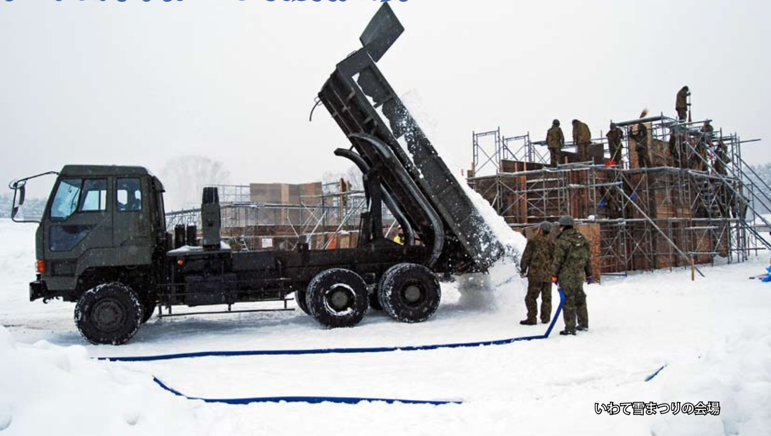
いわて雪まつりの会場