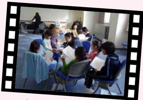
1/10 セリフも覚えないと