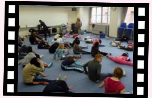
1/9 今年初稽古・まずは準備体操