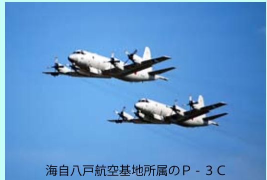
海自八戸航空基地所属のP-3C

注1：航空機はジブチ空港を活動の拠点としています。 注2：その他、部隊の運用調整や海賊対処に係る情報交換等のため連絡官がバーレーンに派遣されています。