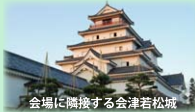
会場に隣接する会津若松城