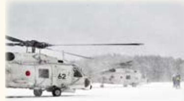
大湊航空隊 1/5 むつ湾上空を飛行