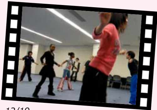
12/19 ヒップホップでリズム感覚