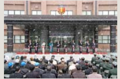
オープニングのテープカット

昨年12月19日、陸自東北方面総監部新庁舎（RC造3階建（一部地下1階）約4,200㎡）の完成及び新庁舎への移転に伴い開庁記念式典が行われました。