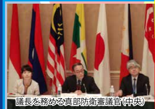
議長を務める真部防衛審議官(中央) 9月21日の本会合では、「地域における安全保障環境を向上するために～日ASEANの防衛協力の強化」と題して、 (1)「地域の安全保障環境の現状」 (2)「共通の課題に対する取組」 (3)「今後の日ASEAN防衛協力」 の3つのテーマについて、出席者の間で意見交換を行いました。