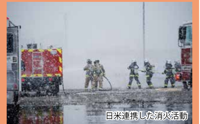
日米連携した消火活動

当日は、米軍三沢基地所属のF-16戦闘機1機が、青森県三沢市の三沢漁港に墜落したとの想定で、吹雪の悪天候のなか、日米が連携して機体の消火活動、負傷者の救助活動、内周規制線等の設置を行い、参加各機関の迅速かつ的確な初動対応が確認されました。