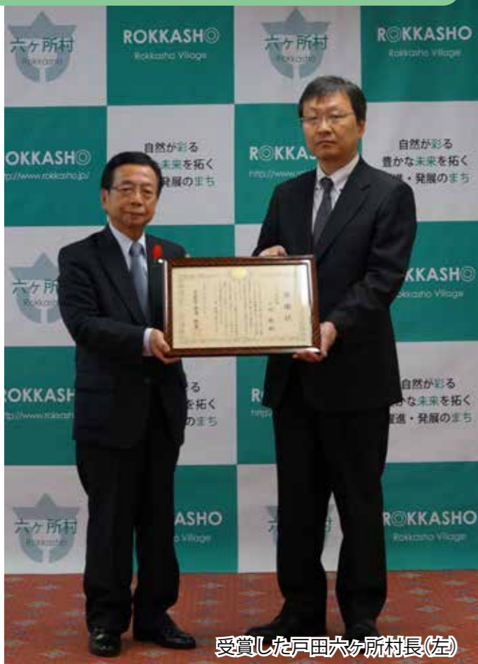
受賞した戸田六ヶ所村長（左）