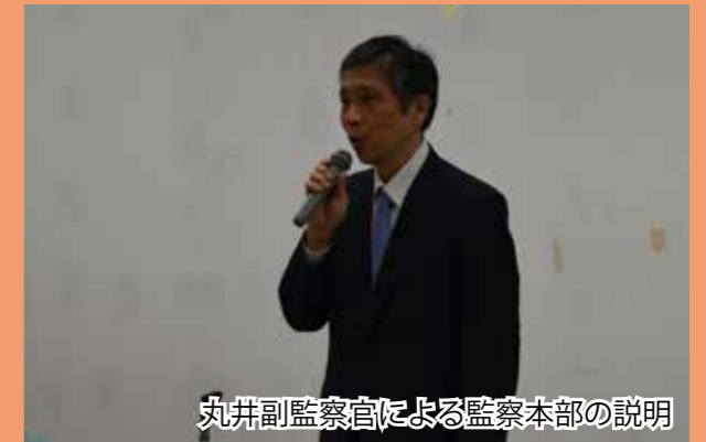
丸井副監察官による監察本部の説明