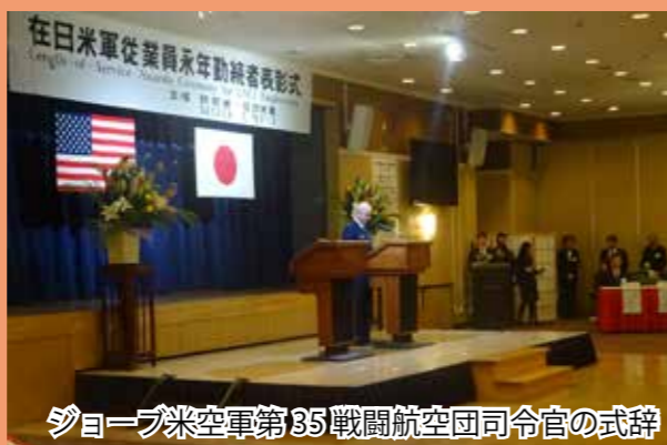
ジョーブ米空軍第35戦闘航空団司令官の式辞

この表彰式は、青森県内に所在する在日米軍施設に永年にわたり勤務した従業員の功績をたたえ、併せて労働意欲及び作業効率の向上を目的として行うものです。なお、在日米軍従業員の募集については15頁に案内を掲載していますのでご覧ください。