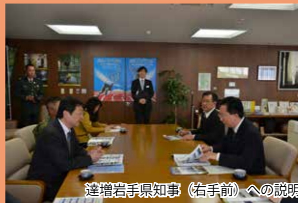
達増岩手県知事（右手前）への説明