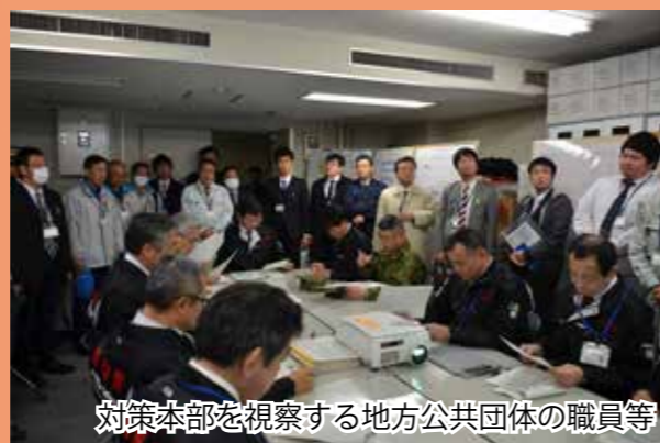
対策本部を視察する地方公共団体の職員等