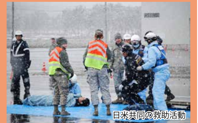
日米共同の救助活動