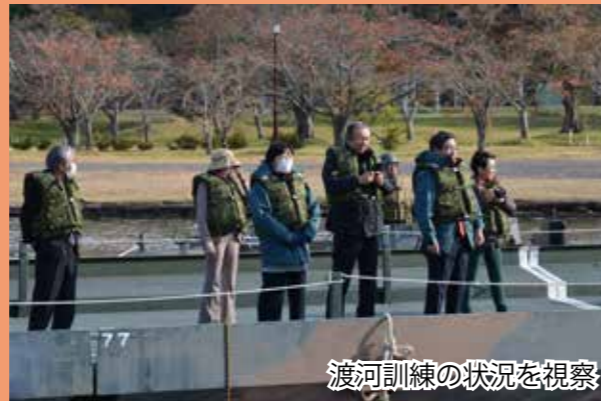
渡河訓練の状況を視察