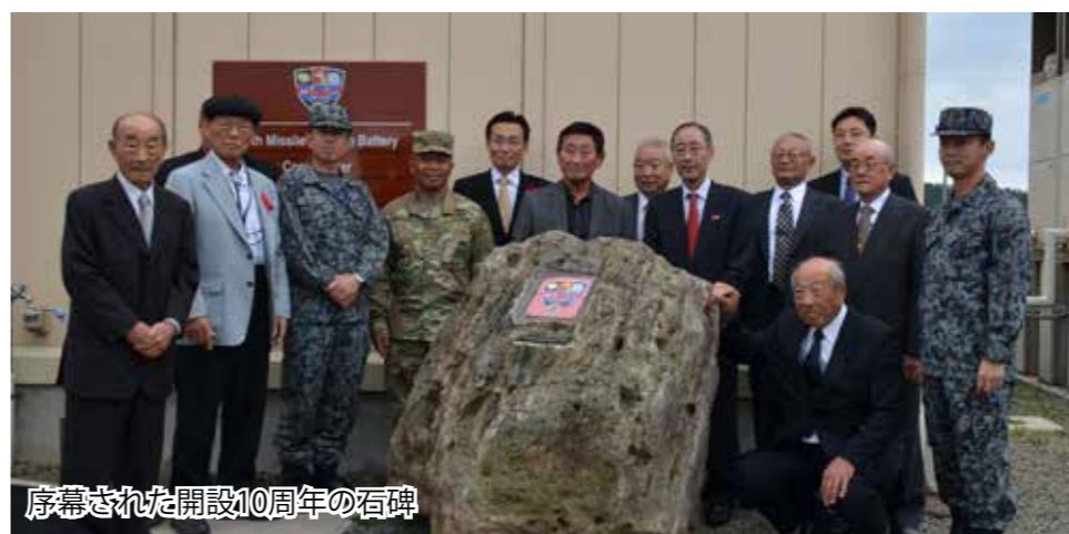
序幕された開設10周年の石碑

その後、米陸軍車力通信所へ移動し、開設10周年の記念石碑の序幕、通信所内の案内が行われ、式典が終了しました。 米陸軍車力通信所に所在する第10ミサイル防衛中隊（サムライ中隊）