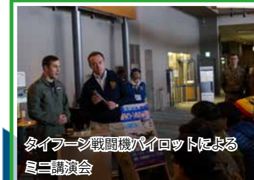
タイフーン戦闘機パイロットによるミニ講演会 11月3日には、三沢基地に隣接する三沢航空科学館において、タイフーン戦闘機のパイロットが来館者向けにミニ講演会を開催し、戦闘機の性能やパイロットの業務について説明し、来館者からの質問に答えるなど、地元との交流を図りました。