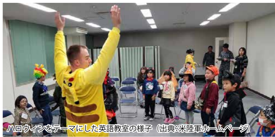
ハロウィンをテーマにした英語教室の様子

の隊員は、地域で重要な一員として認識されており、地域の行事に招待され、子供たちに英語を教えるなど、地域の住民として行動しています。