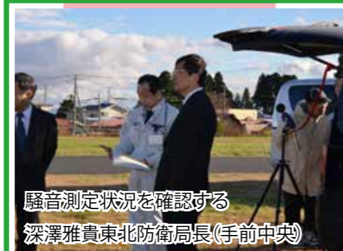
騒音測定状況を確認する深澤雅貴東北防衛局長(手前中央) 現地連絡本部では、三沢市内及び東北町内の9カ所で航空機騒音の測定を実施し、訓練終了後に測定結果を関係自治体へ説明するとともに、ホームページへ掲載しました。 なお、本訓練におけるピーク騒音レベルの最大値は、英国空軍タイフーンが102デシベル、航空自衛隊F-2戦闘機が105デシベルでした。