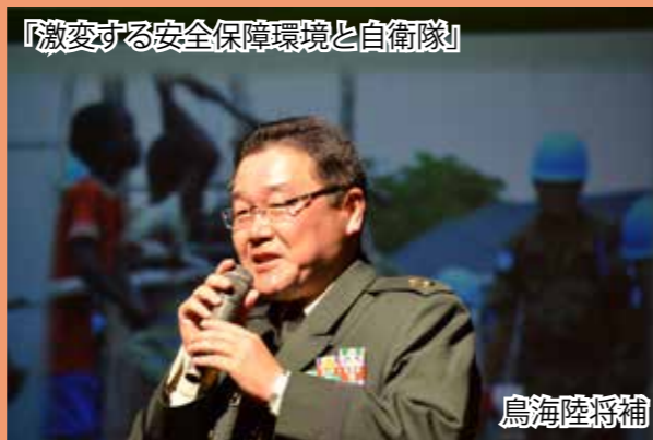
『激変する安全保障環境と自衛隊』