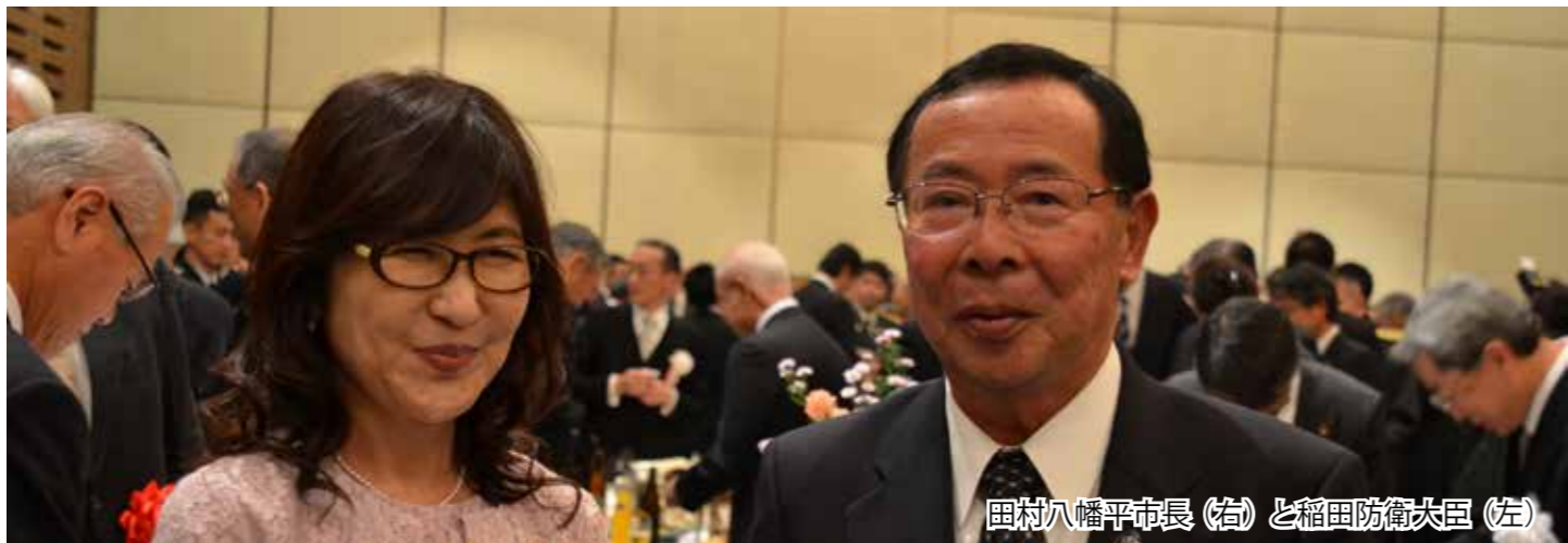
田村八幡平市長（右）と稲田防衛大臣（左）