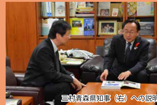
三村青森県知事（右）への説明