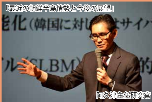
『最近の朝鮮半島情勢と今後の展望』

2人の講師のホットな話題による講演とミニコンサートに来場者も大変満足した様子でした。今後の「防衛セミナー」にご期待下さい。