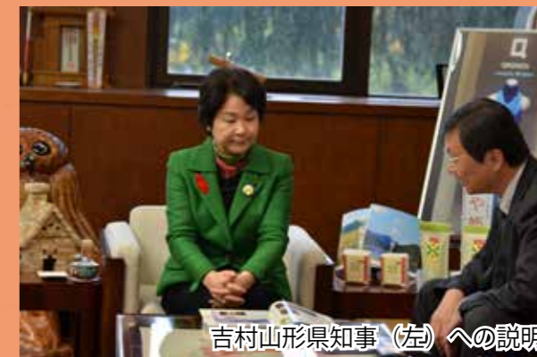
吉村山形県知事（左）への説明

平成28年10月18日には吉村美栄子山形県知事、10月25日には達増拓也岩手県知事、10月31日には三村申吾青森県知事へ深澤雅貴東北防衛局長から平成28年版防衛白書の説明を行いました。