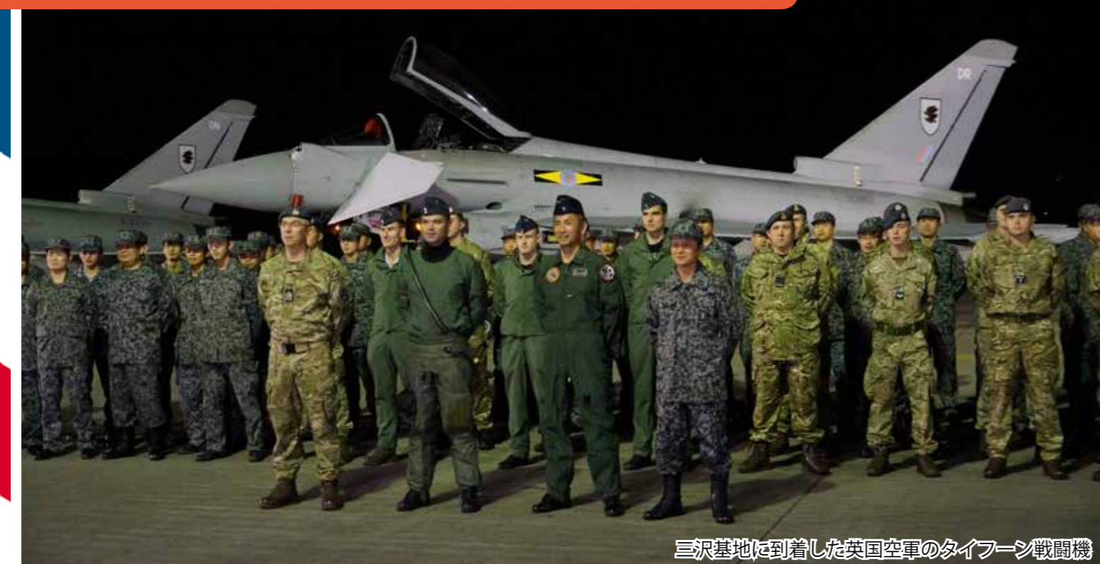
三沢基地に到着した英国空軍のタイフーン戦闘機