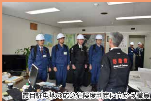
霞目駐屯地の応急危険度判定に向かう職員

当局では、各種事態発生時の対応について練度向上を図るべく、引き続き訓練の実施及び地方公共団体や自衛隊の訓練への参加に努めています。