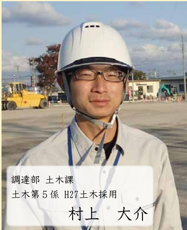
調達部 土木課 土木第5係 H27土木採用