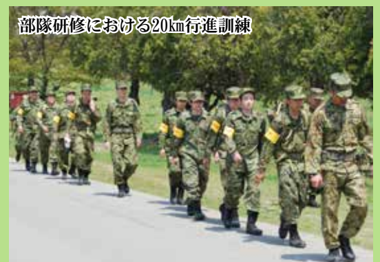
部隊研修における20km行進訓練