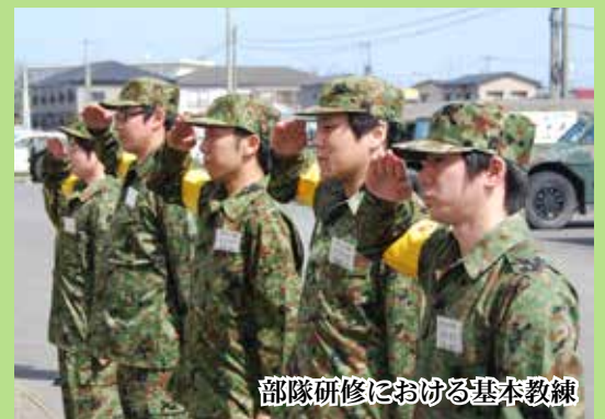
部隊研修における基本教練

東北防衛局では、平成27年度から「部隊の訓練等を自らで体験し、自衛隊の理解を深める」等の目的の下、陸上自衛隊の駐屯地での体験入隊研修を実施しています。平成28年度は、多賀城駐屯地にて2泊3日で基本教練や20km行進、体力検定などが行われました。