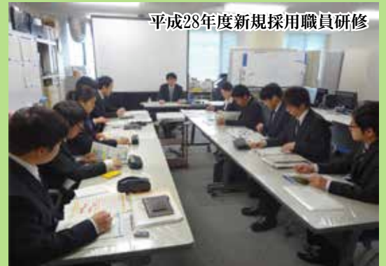
平成28年度新規採用職員研修

東北防衛局新規採用職員研修では、同局の概況などに関する講義が数日間にわたって行われ、東北防衛局職員として必要な業務遂行上の基礎知識等習得し、併せて一体感を培うことを目的としています。