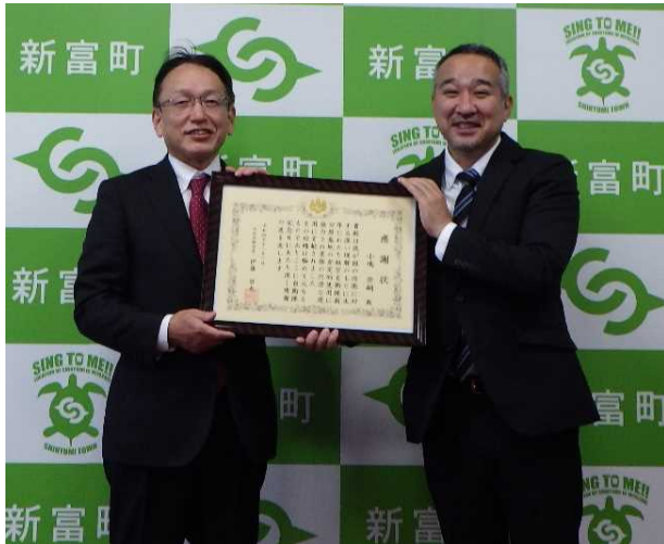
▲小嶋新富町長（右）と北川次長