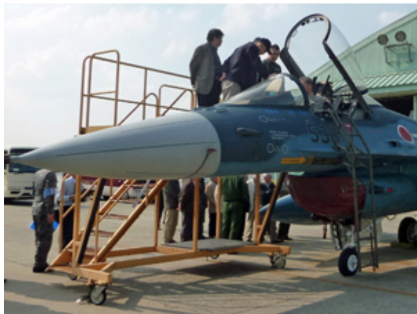
コックピット内の見学