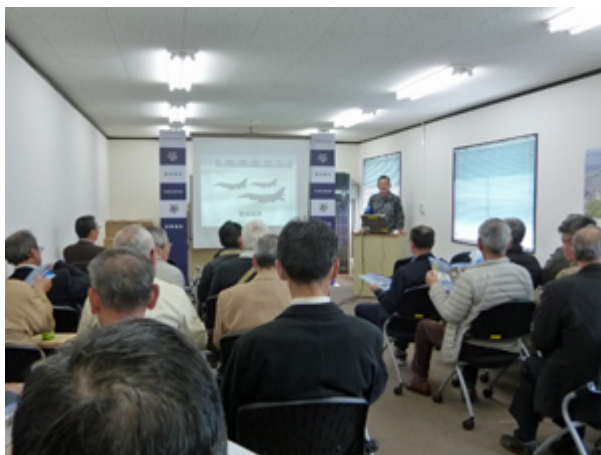
第8航空団司令部基地渉外室広報班長 による基地概況説明