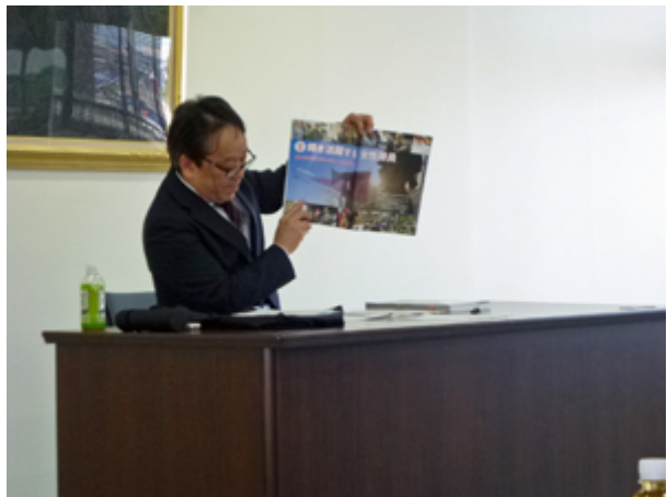
防衛白書の説明をする地方協力確保室長