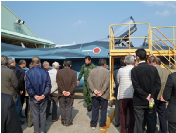
パイロットによる航空機説明