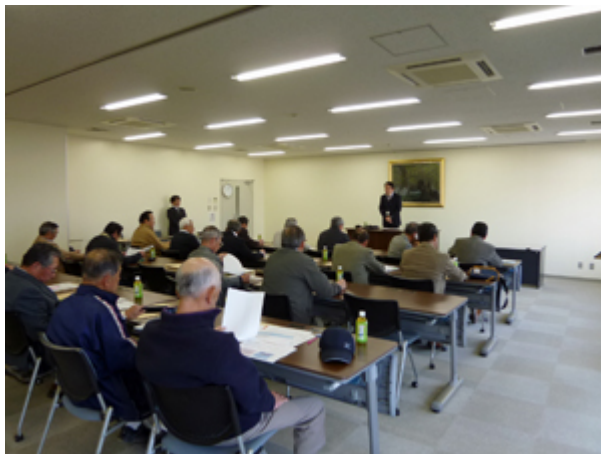
ミニセミナー会場風景

九州防衛局では、防衛省の諸施策や自衛隊の活動について、より多くの方々に理解していただけるよう、今後も各地で防衛問題セミナーを開催していく予定です。ぜひともご参加下さい。